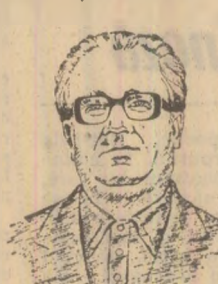
Constantin MORARU Desen de T. ISPAS