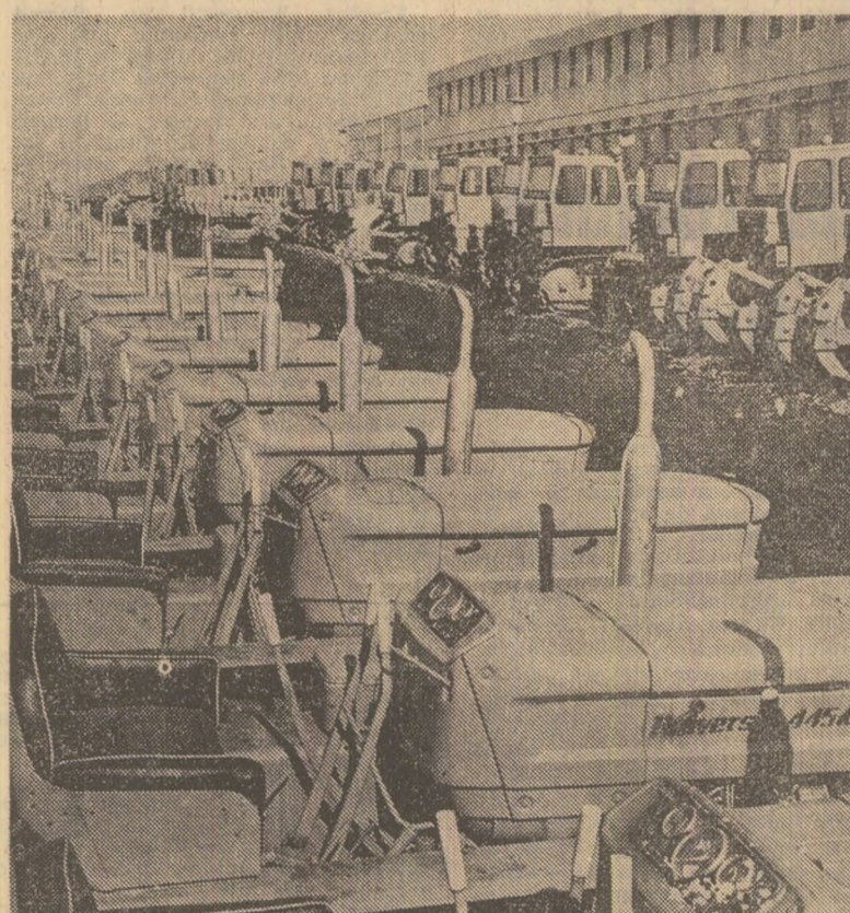
Întreprinderea de tractoare din Miercurea Ciuc: un nou lot de produse — înainte de a fi expedit beneficiarilor

leț tovarășului Nicolae Ceaușescu, secretar general al Partidului Comunist Român, președintele Republicii Socialiste România, de către Comitetul județean Suceava al P.C.R. se arată, între altele: Vă asigurăm și cu acest prilej, mult stimată și iubite tovarășe Nicolae Ceaușescu, că oamenii muncii din agricultura suceveană vor face, în continuare, dovada hărniciei și priceperii lor, sporindu-și tot mai mult contribuția la propășirea scumpei noastre patrii, Republica Socialistă România.