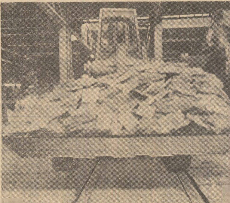
Ceea ce vedeți în fotografie sînt rebuturi de faianță. Ceea ce nu se vede însă în cea ce vedeți în fotografie sînt cele circa 200 kg de combustibil convențional consumate inutil pentru aceste rebuturi. Risipă la pătrat!