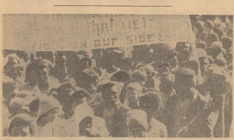
Demonstrație a locuitorilor din Windhoek pentru o Namibie independentă

NAȚIUNILE UNITE (De la trimiterea noastră). Prezentând poziția României față de „încheierea unei convenții internaționale privind înțirirea garanțiilor de securitate pentru statele nenucleare”, ambasadorul Constantin Ene a subliniat că garanția sigură a securității tuturor statelor, ca și a securității internaționale în ansamblu, constă în dezarmarea nucleară, în scoaterea armii nucleare în afara legii și eliminarea ei totală din arsenalele militare. Din aceste motive, a spus oratorului, România a susținut și susține cu toată fermitatea prioritatea dezarmării nucleare.