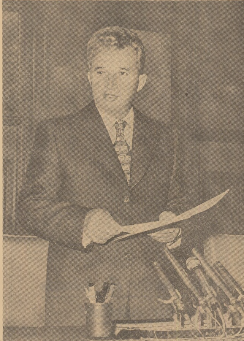
Tovarășul Nicolae Ceaușescu robind cuvintul de încheiere a lucrărilor Plenarei Comitetului Central al Partidului Comunist Român

Miercuri, 1 noiembrie, sub președinția tovarășului Nicolae Ceaușescu, secretar general al Partidului Comunist Român, s-au desfășurat lucrările Plenarei Comitetului Central al Partidului Comunist Român.