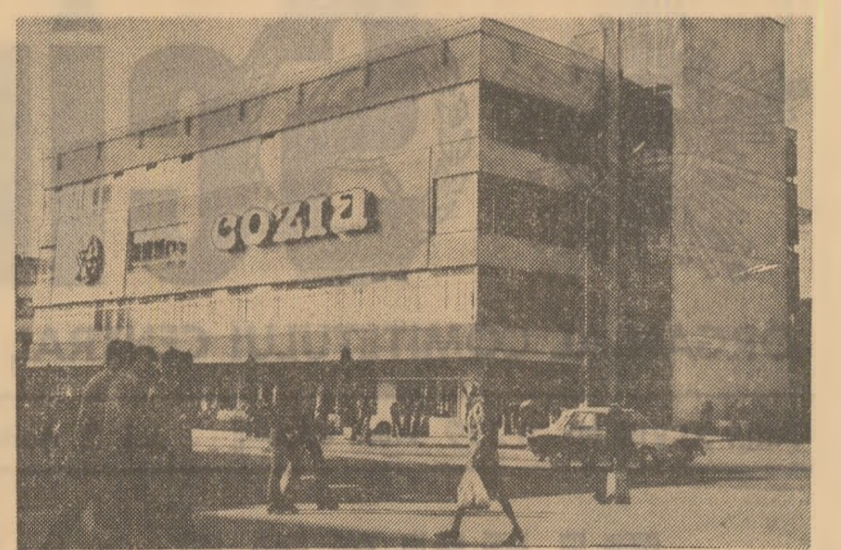
Magazinul universal „Cozia” din Rimnicu-Vilcea