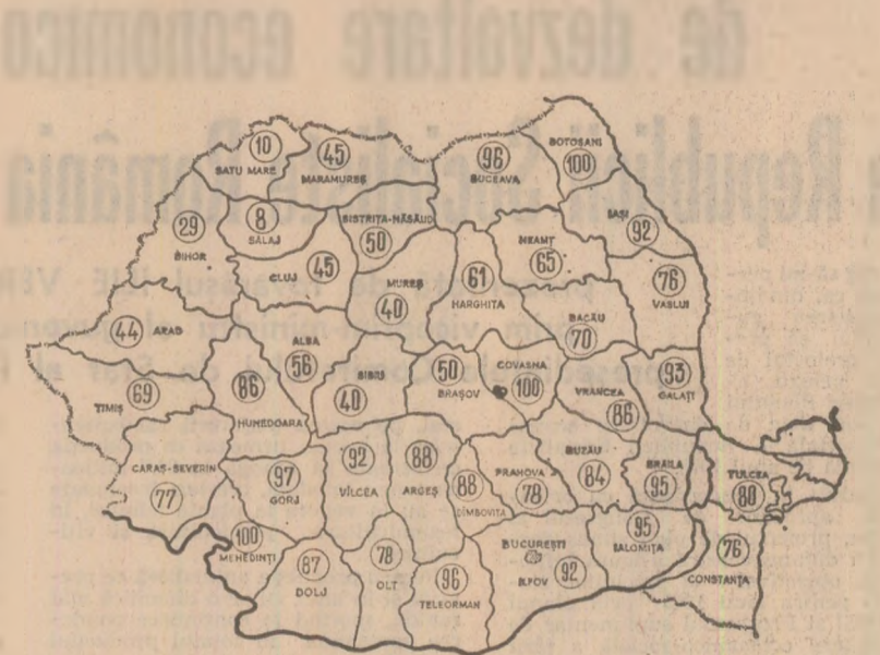
Stadiul recoltării porumbului la 3 noiembrie. Cifrele înscrise pe hartă reprezintă, în procente, suprafețele de care a fost strînsă recolta în cooperativele agricole

Săptămîna care se încheie a constituit o perioadă de muncă rodnică, numeroase unități agricole de stat și cooperatiste terminînd recoltarea culturilor țirzii de pe ultimele suprafețe. Potrivit datelor centralizate ieri la Ministerul Agriculturii și Industriei Alimentare, porumbul a fost strîns de pe 1 915 000 hectare — 79 la sută din suprafața cultivată. Există condiții ca în numeroase județe săvîta în sudul țării, într-o zi, două șase termine recoltarea porumbului.