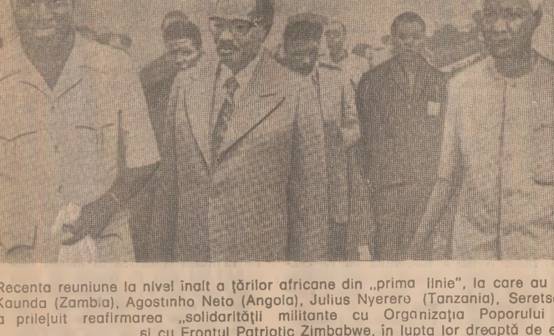
Recenta reuniune la nivel înalt a țărilor africane din „prima linie”, la care au participat patru șefi de stat — Kenneth Kaunda (Zambia), Agostinho Neto (Angola), Julius Nyerere (Tanzania), Seretse Khama (Botswana) — în imagine — a prilejuit reaffirmarea „solidității militante cu Organizația Poporului din Africa de Sud-Vest (S.W.A.P.O.) și cu Frontul Patriotic Zimbabwe, în lupta lor dreaptă de eliberare națională”