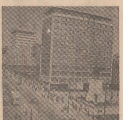
Ankara: Piața Ulus

Agenda lucrărilor cuprinde teme privind instaurarea unei noi ordini informaționale și dezvoltarea mijloacelor de comunicare în masă deosebi în țările în curs de dezvoltare și deconectarea informației.