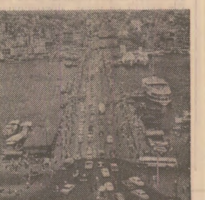
Istanbul: Podul Galata

contribuie efectiv la valorificarea resurselor naturale ale Turciei. Prezența acestor „mesageri” ai industriei românești sînt o dovadă clară a bunelor relații dintre România și Turcia, viguros stimulate de frecvențele dialogului româno-turces care au înalt nivel. Multe sînt filele carnetului de reporter care au înregistrat cuvintele de satisfacție ale interlocutorilor față de modul exemplar cum se traduce în viață avantajul larg de acorduri dintre cele două țări. În domeniul dintr-un grup de țări, și o rață de țară, în vederea înțelegerii și realizării unor proiecte de dezvoltare comună. În acest fel, înțelegerea și realizarea unor proiecte de dezvoltare comună este o necesitate pentru toate țările, în special în țările în curs de dezvoltare.