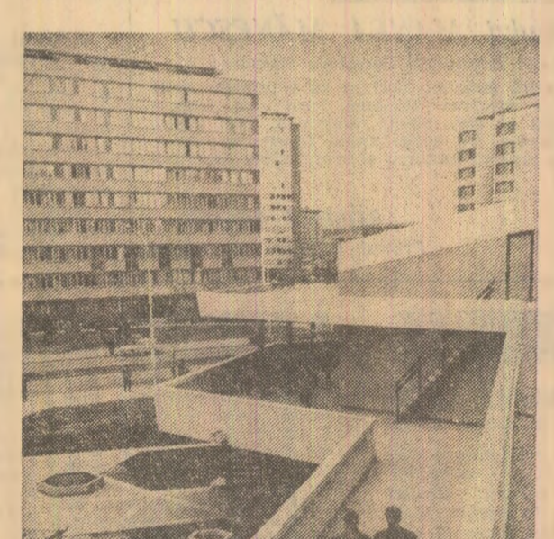
Profiluri în Novi Beograd

Prin tradiție, acest anotimp este totodată un anotimp de intensă activitate politică, determinată de faptul că se apropie de sfîrșit încă un an de muncă și eforturi creatoare. Intense dezbateri se desfășoară în aceste zile în forul legislativ suprem al țării, în alte organe și organizații federale și republicane, care analizează rezultatele obținute în creșterea potențialului economic al țării. Totodată, se schitează planul de dezvoltare pentru anul viitor și se pregătește planul pentru perioada următoare. Cînd cînd, în conformitate cu orientările Congresului al XI-lea al U.C.I. Din tabloul prezentat de presa iugoslavă se desprind o serie de aprecieri pozitive cu privire la bilanțul anului economic. Astfel, se constată că obiectivele fixate în planul de dezvoltare pe acest an (creșterea producției pe ansamblul economiei cu 7 la sută) au fost atinse, ceea ce asigură în continuare o dezvoltare dinamică și echilibrată în toate domeniile. În elaborarea proiectului de dezvoltare pentru cîndva anul economic al țării, în 1980 se pornește de la o bază materială tot mai solidă. În ultimii trei ani, economia iugoslavă a înregistrat o creștere sustinută, continuîndu-se, totodată, ritmul înalt atins în anii precedenți de producția industrială.