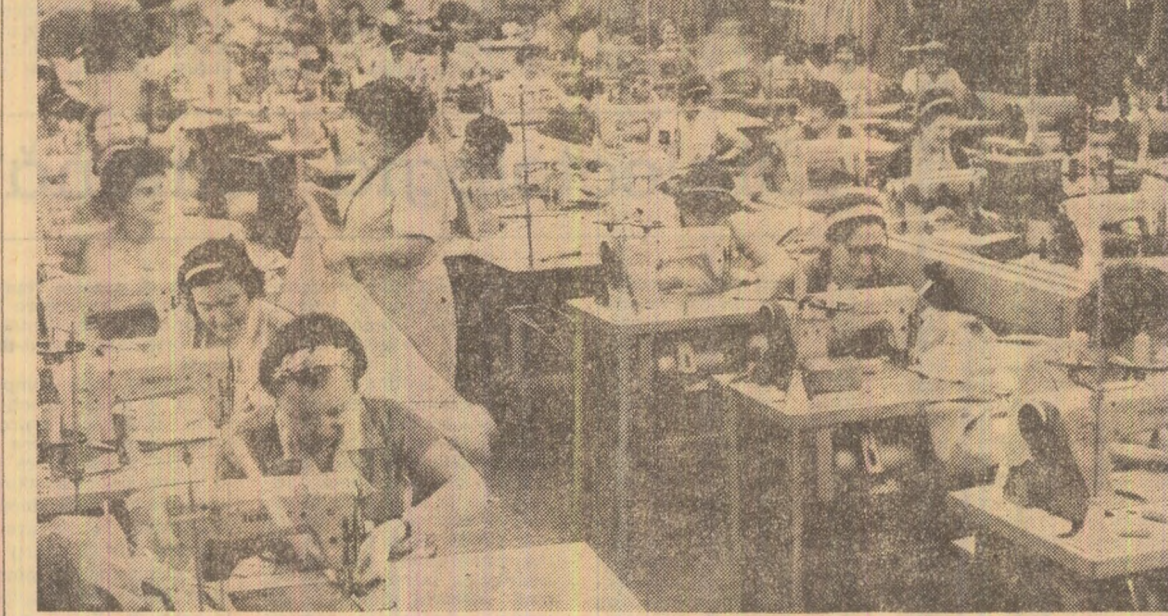
Intr-unul din sectoarele întreprinderii de confecții „Mondiala” din Satu Mare, unde se aplică sistemul de lucru denumit „pe grupe de operații”

Octav GRUMEZA correspondentul „Scintilei”