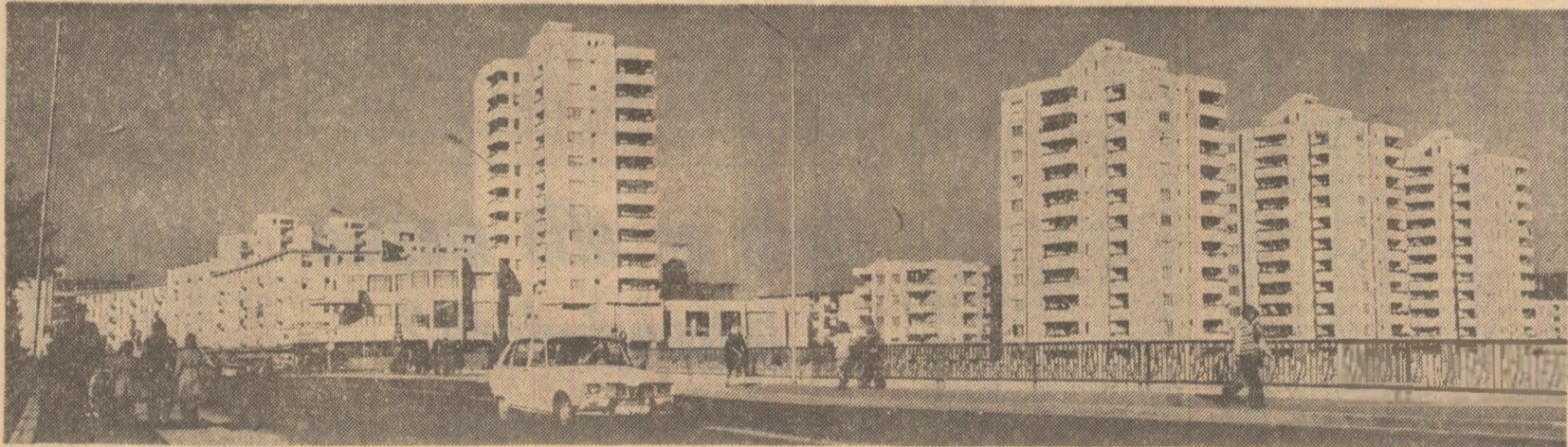
Rimnicu Vilcea: vedere a cartierului Ana Ipătescu

La casa de cultură din localitatea s-a expus macheta de sistematizare a noului centru civic al orașului. Zilnic specialiștii stau la dispoziția tinerilor de vizitați pentru a da explicații asupra proiectului. Noul centru civic al orașului Miercurea Ciuc va cuprinde pe lângă un ansamblu de circa 4 000 de apartamente sediul politico-administrativ, o casă de cultură, o sală de sport polivalentă, spații comerciale, o piață agroalimentară acoperită, școli, grădinițe, creșe, dispensare și alte dotări. (I.D. Kiss)