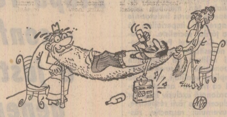
Fără cuvinte. Desen de Adrian ANDRONE

stînd-o... cu gura strîmbă și fără un ochi, dar am internat-o în spital la Iași și am făcut-o bine”. Cînd, dar la a doua lectură, lucrurile în loc să se limpezească, ne-au apărut mai confuze, iar la a treia lectură am început să întrezăresc o datorie în toată seriozitate, am contribuit cînd a fost cazul la apărarea avuților obștești, la respectarea legii, la ajutorarea concetățenilor mei, eu, la rîndu-mi fiind ajutat de ei”. Aceste motive s-au cristalizat în mintea lui D. D. ulterior, cînd faptul se