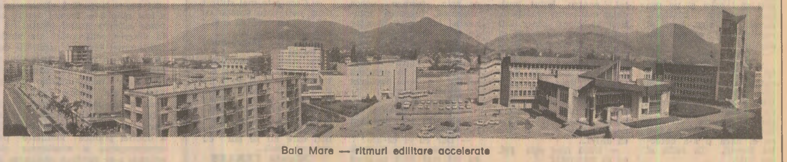
Bala Mare — ritmul edificării accelerate

Însemnări din județul MARAMUREȘ În pagina a III-a