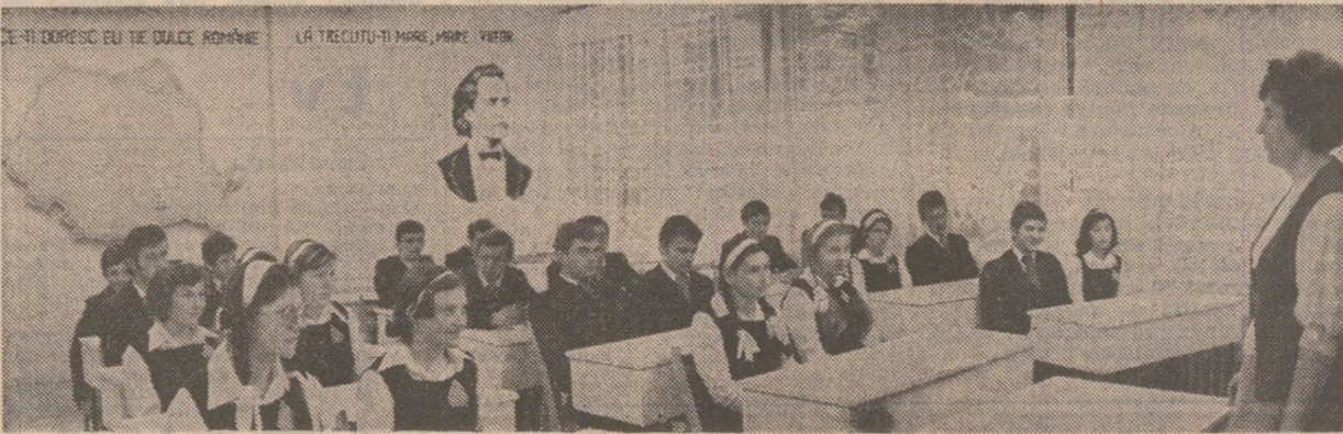
Oră de limba română la Centrul școlar de construcții și arhitectură din Baia Mare

• CU 53 DE ZILE MAI DEVREME au fost realizate sarcinile de plan pe primii trei ani ai cincinalului de oamenii muncii români, maghiari, ucraineni și de alte naționalități din județul Maramureș. Se vor realiza suplimentar, până la sfârșitul anului: 4 266 tone oțel aliat, 6 917 tone cupru în concentrate, piese de schimb auto în valoare de 69 milioane lei, 230,6 mii mp furnire, 822 tone brinzeturi ș.a.