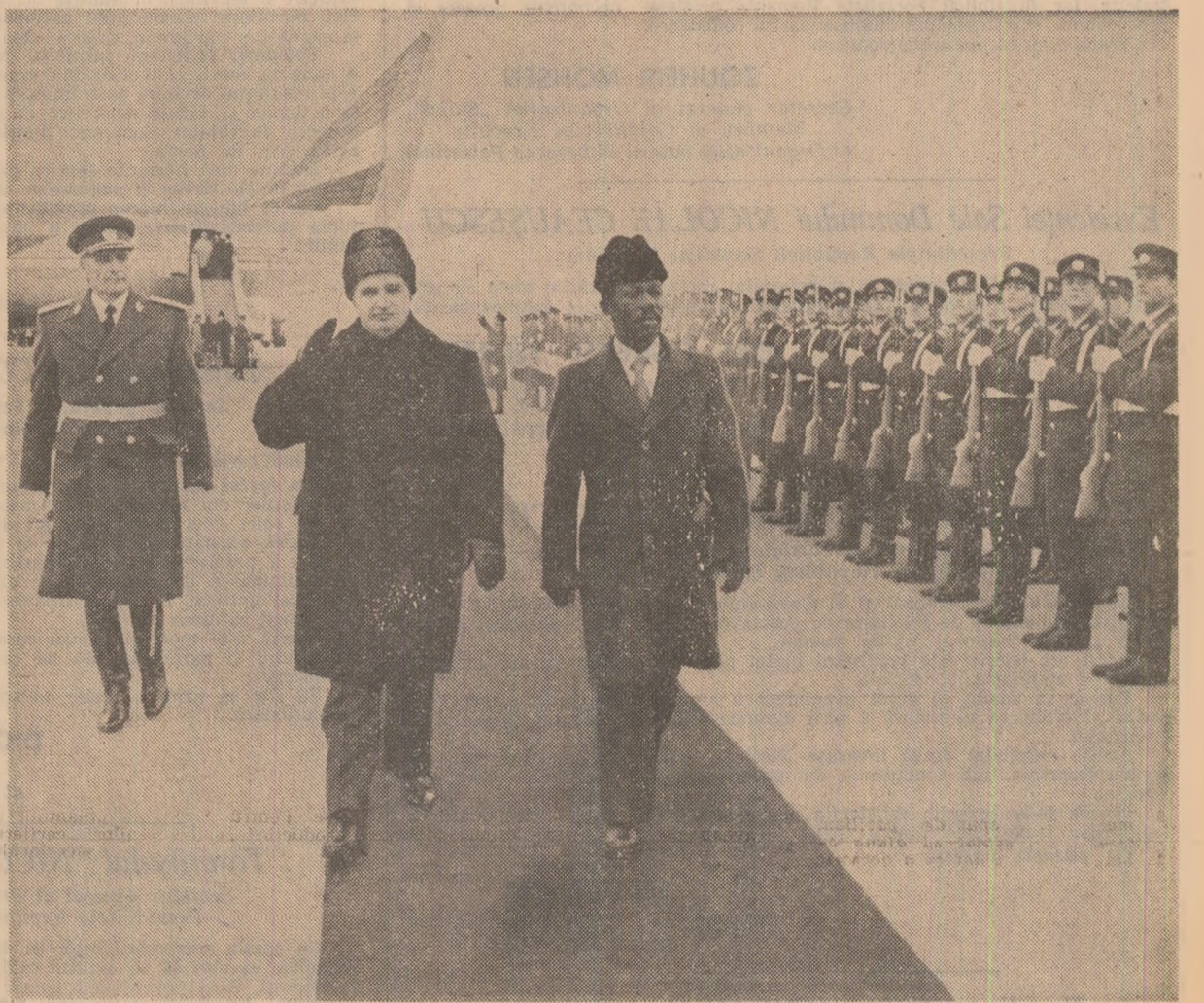
La sosire, pe aeroportul Otopeni