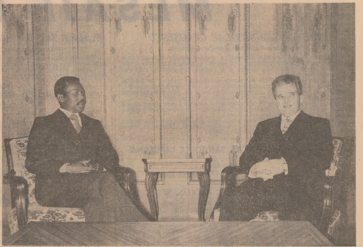
Înaintea dinelului oficial