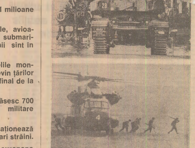
Ample desfășurări de forțe, manevre militare însemnând o uriașă risipă de materiale și combustibil, sporirea neîncrederei, agravarea tensiunii între state (aspecte de la manevrele de toamnă ale N.A.T.O.)

Europa a unei zone în care să nu fie amplasate nici un fel de armate și armamente, unde să nu se desfășoare nici un fel de manevre și demonstrații militare. Este știut că întodeauna concentrările de trupe și armamente, manevrele militare la linia de demarcare a celor două blocuri au generat stări de neliniște și tensiune. Măsurile întreprinse de o parte au declanșat întodeauna reacții în lanț de cealaltă parte. Și este cu totul firesc ca sporierea ponderii militare, demonstrațiile de forță în asemenea regiuni atât de sensibile să trezească suspiciuni, neîncredere. De aceea, adoptarea hotărârilor de a crea o zonă demilitarizată între cele două blocuri ar duce, fără îndoială, la diminuarea încordării, ar permite dezvoltarea unor relații de colaborare, bazate pe încredere și res-