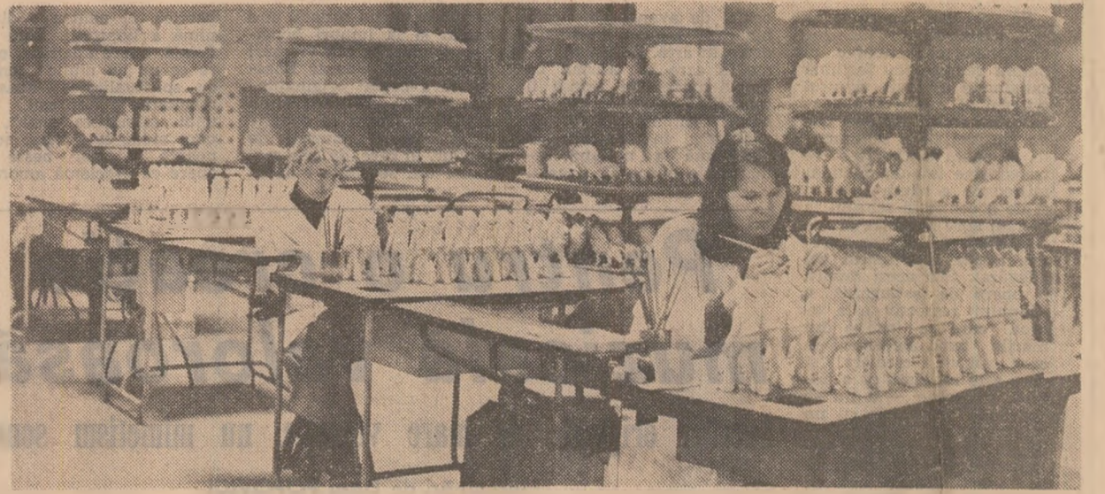
Atelierul decor de porțelan din Alba-Iulia - locul unde se împletesc armonios grația, micalia și priceperea