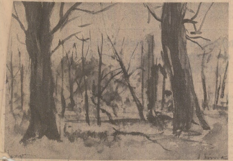
Ion SIMA Toamnă în parc

20.15 Film artistic : „Infrîngînd prejudecăţile”. Premieră TV. Producţie a studiourilor americane 21.50 Atelier de creaţie literar-artistică 22.30 Închiderea programului PROGRAMUL 2 17.00 Selecţiuni din „Albumul duminicilor” 17.35 Bionote — Informaţii utilitare 18.15 Caseta cu imagini 19.00 Album corat 19.20 100 de secunde 19.30 Teleturnal 19.50 Radar pionteresc 20.15 Capodopere, mari interpreţi 21.10 Telex 21.15 Consultări juridice 21.35 Studio liric '78