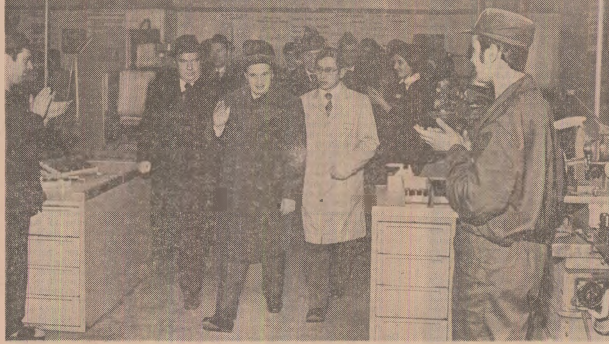
La întreprinderea de mecanică fină, ca și în celelalte unități vizitate, tovarășul Nicolae Ceaușescu este primit cu deosebită căldură și prețuire

Această vizită se înscrie ca un nou și semnificativ moment al dialogului permanent, nemijlocit, pe care tovarășul Nicolae Ceaușescu îl are cu fauritorii de bunuri materiale și spirituale în probleme esențiale ale activității economico-sociale, ale creșterii bunăstării celor ce muncesc. Desfășurată în săptămîna ce încheie un intens și rodnic an de muncă în toate domeniile construcției socialiste, noua întîlnire de lucru a prilejuit analizarea la fața locului a modului în care se materializează indicațiile privind realizarea în țară a unor produse de vîrf ale tehnicii, precum și a rezultatelor obținute în 1978 de întreprinderile vizitate — unități reprezentative ale industriei construcțiilor de mașini și industriei chimice, cit și pe ansamblul acestor ramuri de o importanță deosebită pentru dezvoltarea economiei noastre. A fost examinată îndeaproape felul în care aceste colective muncitorești au acționat pentru îndeplinirea obiectivelor prioritare puse în fața lor, a întregii economii naționale — gospodărirea judicioasă a mijloacelor de care dispun, folosirea rațională, cit mai eficientă, a materiilor prime și materialelor, diminuarea consumurilor de combustibili și energie, stimularea gândirii științifice și tehnice, sporirea și