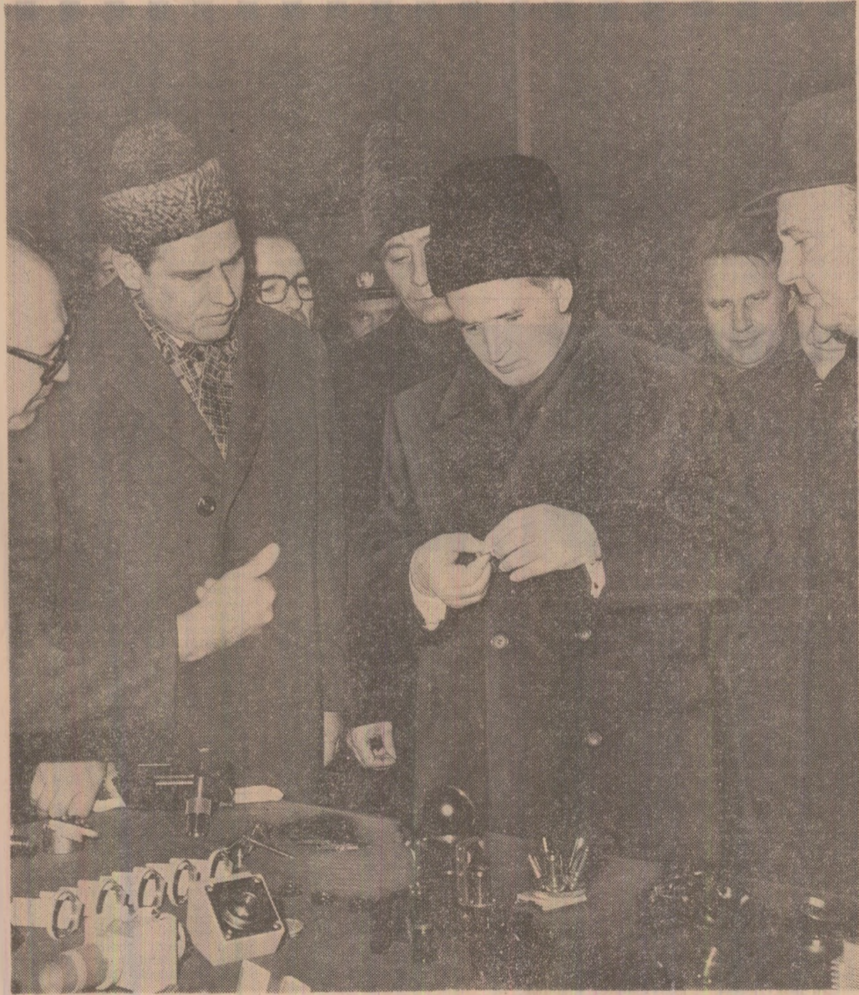
La Întreprinderea Optică Română, tovarășul Nicolae Ceaușescu examinează cu atenție produsele prezentate

În noua hală — de 12 000 mp — destinată fabricării de strunguri carusel, construită cu circa 6 luni în avans față de termenele planificate, tovarășul Nicolae Ceaușescu este informat că această mare suprafață de producție dispune, între altele, de o instalație de termostatare prin care se menține în interior o temperatură constantă, se elimină praful și variațiile de umiditate. Prin această nouă investiție se asigură întreprinderii condițiile optime pentru trecerea, din 1978, la fabricația de mașini-unelte cu performanțe deosebite, de precizie a prelucrării și de productivitate, numărîndu-se printre cele mai mari strunguri carusel existente pe plan mondial. El poate prelucra piese de diferite forme și de greutate pînă la 400 tone, fiind capabil să execute operații de strunjire, frezare, alezare, găurire în coordonată, rectificarea și filetare. Utilajul, în greutate totală de 850 tone, dispune de 52 de motoare electrice de acționare și de două echipamente electronice de comandă numerică.