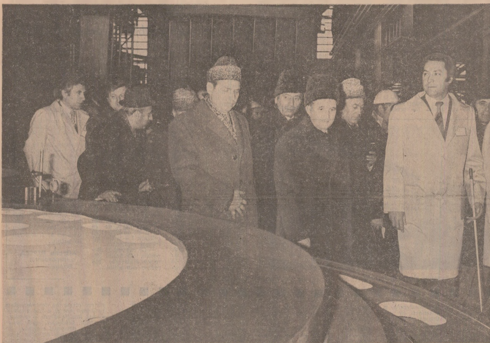
La întreprinderea de mașini-unelte și agregate, secretarul general al partidului este informat despre preocupările colectivului pentru realizarea de produse cu performanțe tehnice deosebite, de mare complexitate