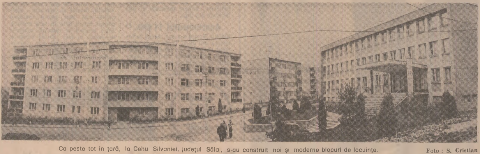
Ca peste tot în țară, la Cehu Silvaniei, județul Sălaj, s-au construit noi și moderne blocuri de locuințe.