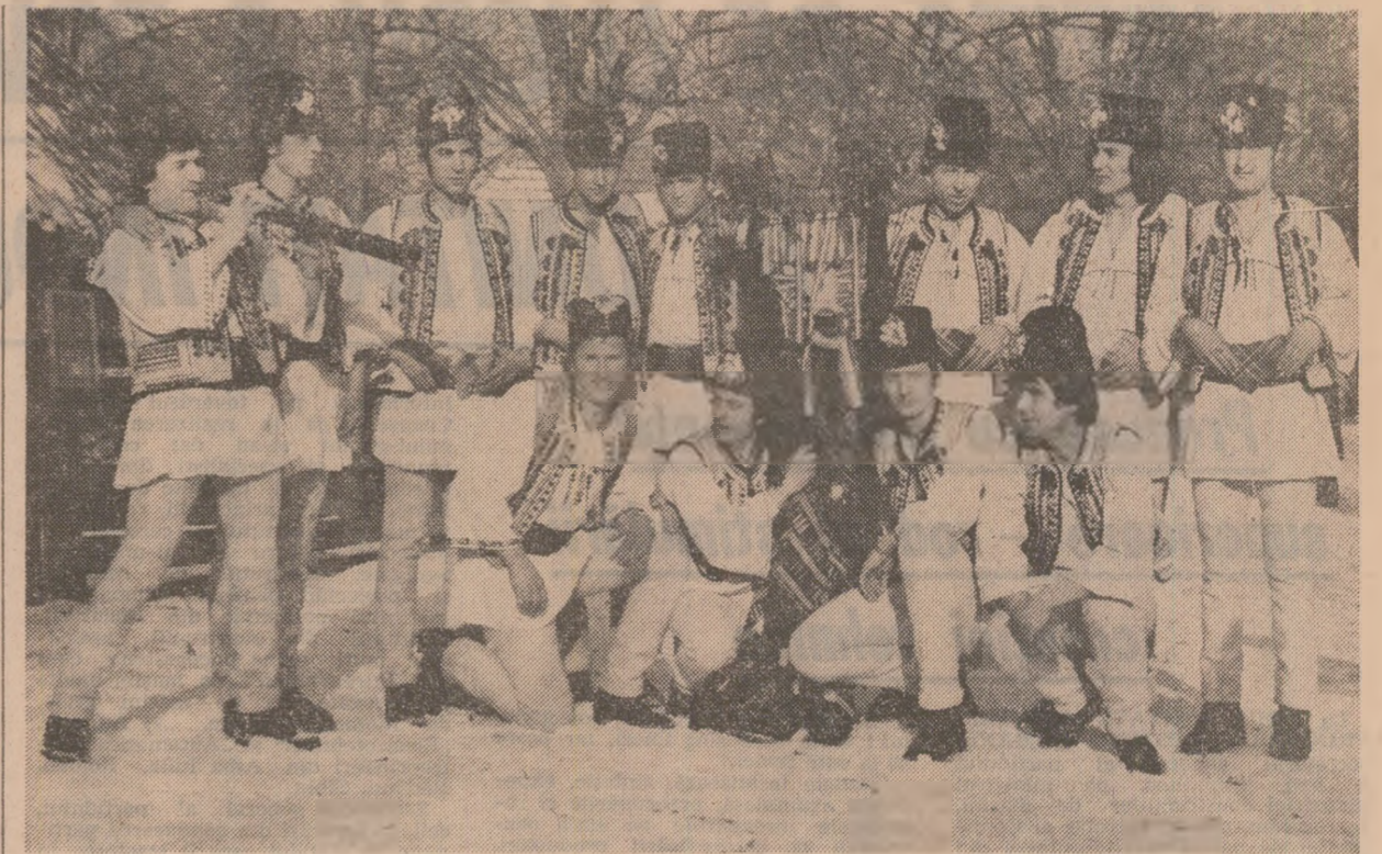
Obiceiuri de iarnă prezentate de grupul folcloric al Casei de cultură din Mediaș, județul Sibiu

Pe de altă parte, și ca urmare a celor menționate, asumarea de „responsabilitate socială” nu ar contraveni „noilor obiective” ale corporațiilor ci, din contră, ar exprima „o optică luminată, pe termen lung” — cum afirmă, conștient magnat al automobilului Henry Ford al III-lea. O asemenea optică ar caracteriza deja comportamentul multor monopoluri și problema care se pune ar fi doar generalizarea ei. După cum se observă, doctrina „în-