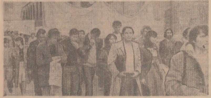
Demonstrație studentească la Paris împotriva rasismului și politicii de apartheid

Namibia peste 28 000 tone de cupru, 39 000 tone de plumb, 48 000 tone de zinc, imense cantități de diamante. În raportul Comitetului O.N.U. pentru decolonizare se arată că profiturile pe care aceste companii le obțin în Namibia sînt de trei-patru ori mai mari decît celea din R.S.A.