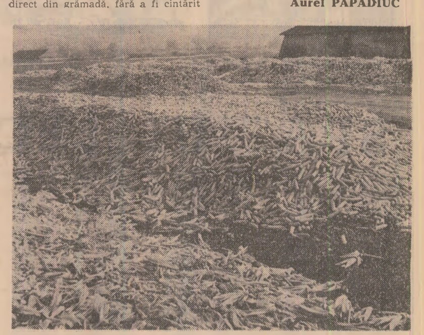
Întoarcerea la muncă este deosebit de importantă pentru agricultorii din județul Constanța: sute de tone de porumb, în loc să fie puase la odă, au fost lăsate direct pe câmp, sub cerul liber, la voia întâmplării.