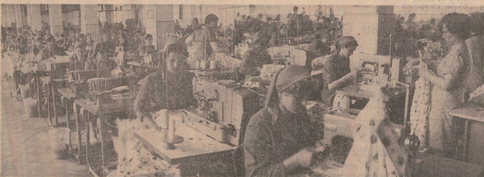
La Fabrica de confecții din Botoșani

verin plătește amortizări în valoare de 3,3 milioane lei. Și în primul caz, și în al doilea se aduc tot felul de „justificări”. Iar în timp ce factorii de conducere din aceste unități se justifică... darbuierii cresc. Cum s-ar zice, pe la dumneaor spiritul gospodăresc cam lipsește. N-ar putea fi altfel ? (Virgilu Tătaru).