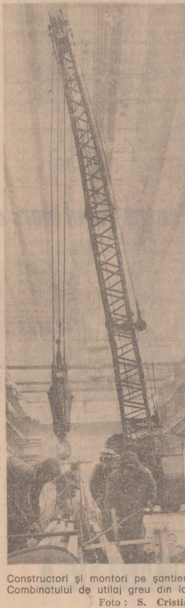
Construcții și montaj pe șantierul Combinatului de utilaj greu din Iași.