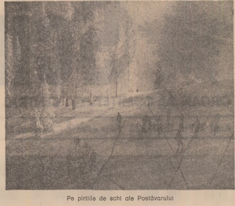
Pe pirtile de schi ale Postăvarului

Asadar, în județul Argeș se acționează cu bune rezultate pentru întărirea autogospodăriei, pentru trecerea tuturor localităților la autofinanțare. Este de datoria consiliilor populare să facă totul ca măsurile stabilite să prindă viață. Gheorghe CIRȘTEA correspondentul „Științei”