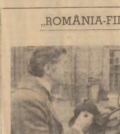
„ROMANIA-FILM” prezintă: „Între oglinzi paralele” CASA DE FILME 5

Realizarea unei producții sporite de legume, într-un sortiment variat, îngrădarea lor esențială, astfel încît să existe în condiții de producție și condiții de distribuție, este o sarcină deosebit de importantă pentru întreprinderile noastre.