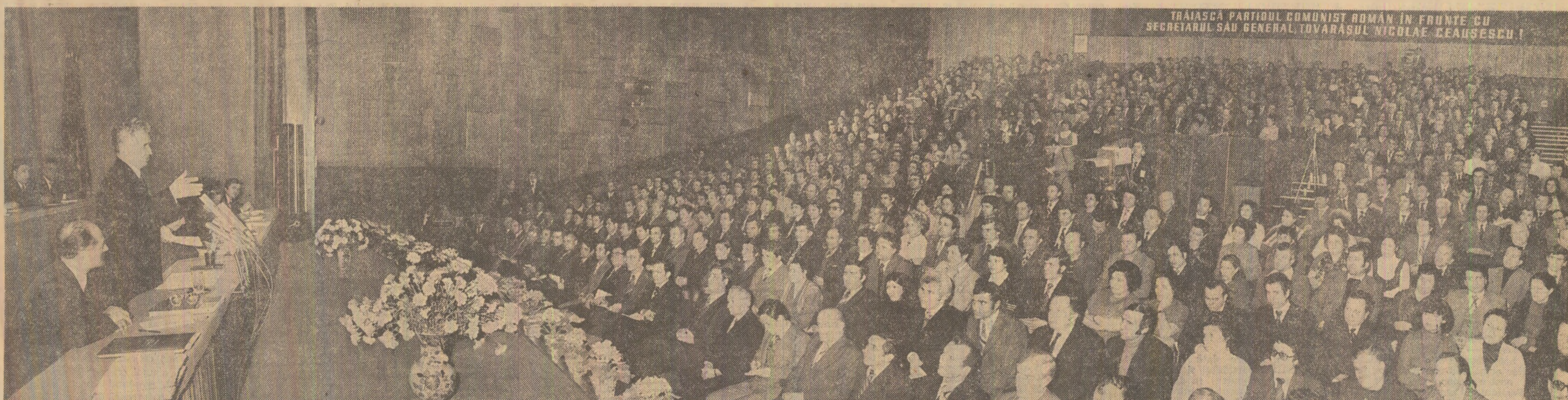
TRĂIASCĂ PARTIDUL COMUNIST ROMÂN ÎN FRONTE CU SECRETARUL SAU GENERAL, TOVARĂȘUL NICOLAE CEAUȘESCU!