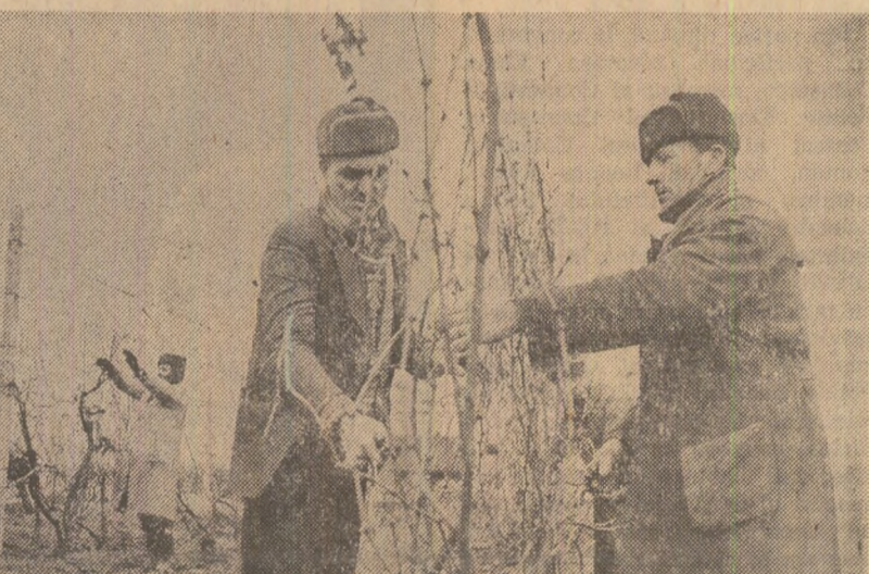
La cooperativa agricolă din Ciocirla se pregădesc răsadurile și se amenajează solarile pentru legume (fotografia din stînga). Pe cele 160 hectare cu plantații de vie ale I.A.S. Urziceni se execută tăieri și se repară spaliere (fotografia din dreapta)