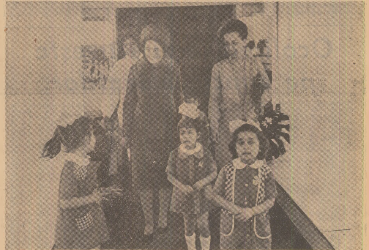
În timpul vizitei la creșa și grădinița „Gheorghe Dimitrov”

de specialiști și muncitori pentru importantele înfăptuiri de pînă acum și le urează noi și tot mai mari succese în activitatea lor lesată de creșterea nivelului de trai și de civilizația al oamenilor muncii. În continuare se vizitează creșa și grădinița „Gheorghe Dimitrov”, aflate în zona în care prinde contur cel mai nou cartier de locuințe al orașului. Sute de elevi ai școlii profesionale din apropiere fac tovarășei Elena Ceaușescu o primire emoționantă. Se scandează, cu toată vigoarea vârstei, „Vecina drujba”, „Vecina drujba!” („Prietenie veșnică!”). La intrarea în complexul creșei și grădiniței, un grup de copii, îmbrunși de emoție, adresează în limba maternă urarea: „Bine-ați venit la noi!”. Ei înconjoară cu toată dragostea pe tovarășele Elena Ceaușescu și