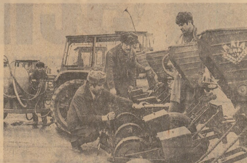
La secția de mecanizare din Adîncata, comisia unică de recepție a început verificarea calității reparărilor și stării de funcționare a tractoarelor care vor fi folosite în campania de primăvară

● repararea tractoarelor și mașinilor agricole care vor lucra în această primăvară — termen 20 februarie; ● transportul utilimelor cantități de îngrășăminte organice aflate în unitățile agricole; ● fertilizarea fazăla la griu și orz,