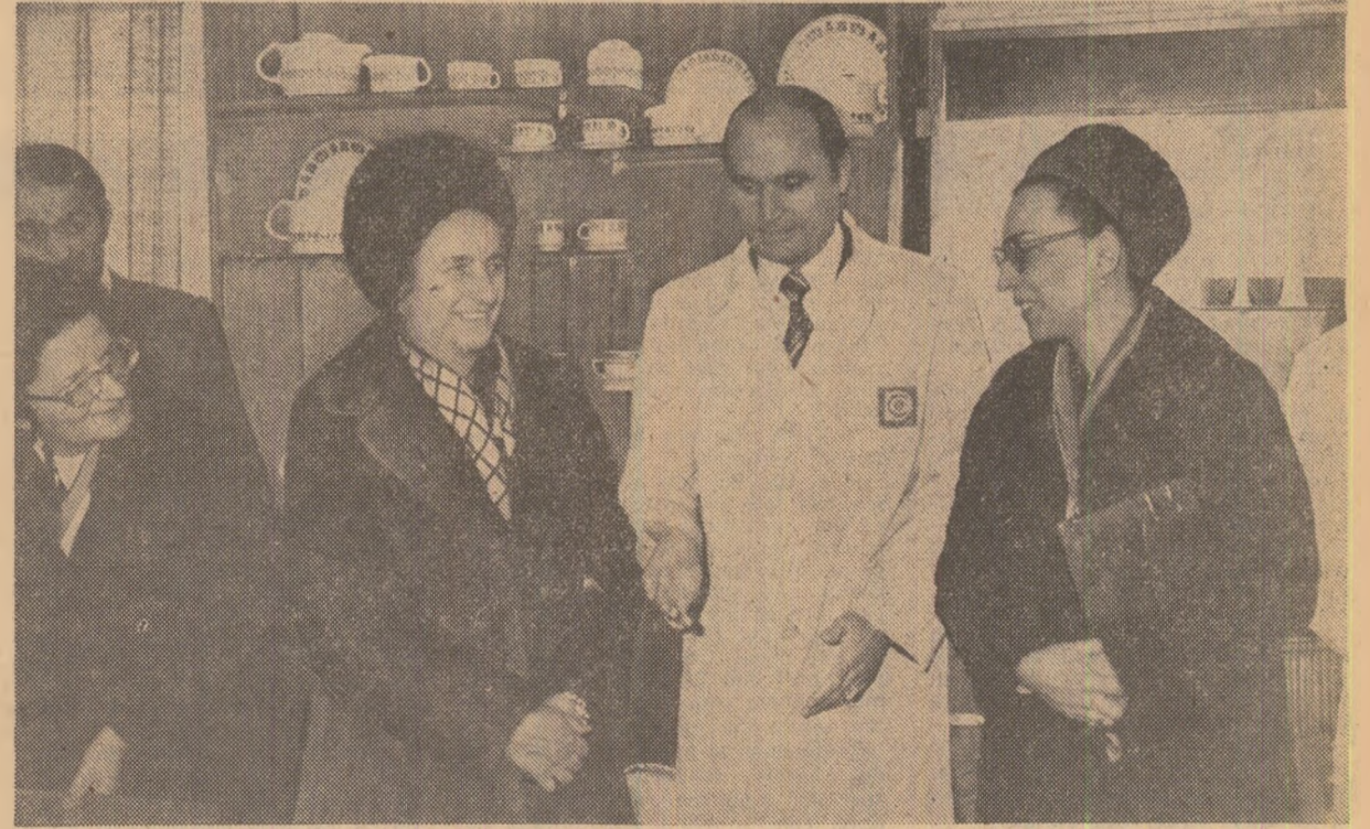
La întreprinderea de sticlărie și porțelanuri