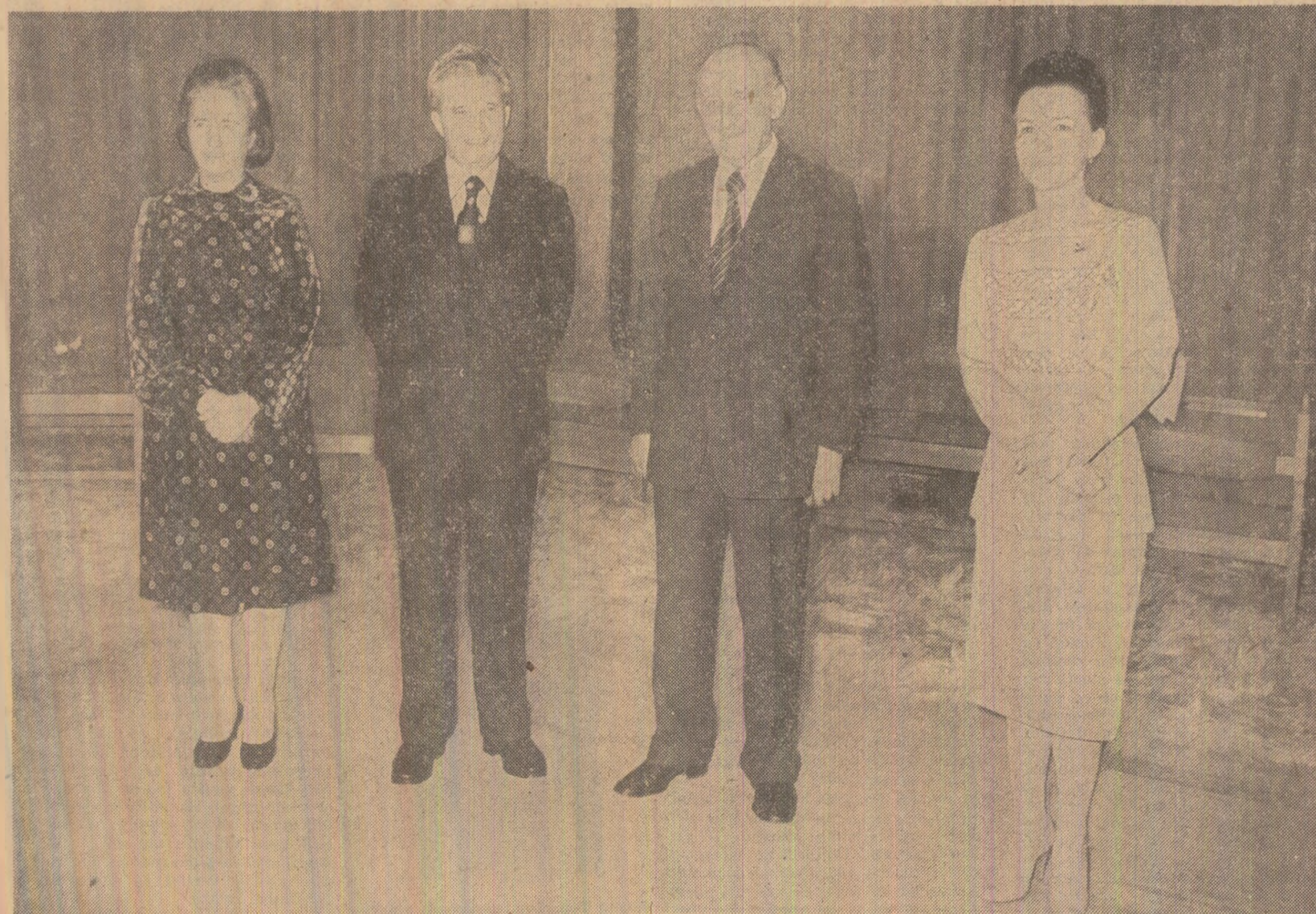
În timpul dîneului

(Din toasturile rostite la dîneul din seara zilei de 15 februarie)