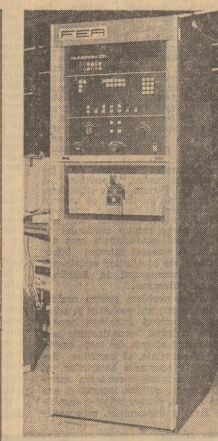
Echipamentul NUMEROM 331

După cum se cunoaște, unul dintre obiectivele importante ale actualului plan cincinal îl constituie realizarea în țară, pînă la sfîrșitul anului 1980, a peste 80 la sută din necesarul mijloacelor de automatizare. Cerințele sporite privind accelerarea ritmului de înnoire și modernizare a producției în toate ramurile economiei, realizarea de produse cu performanțe tehnice și calitative superioare, competitive cu cele atinse în țările dezvoltate, creșterea marcată a productivității muncii și reducerea consumurilor de materii prime și materiale, de energie și combustibili împlică în modul cel mai direct introducerea automatizării în diferitele ramuri și sectoare ale economiei. În țara noastră colaborarea dintre institutele de specialitate și întreprinderi contribuie, cu rezultate tot mai bune, la transpunerea în viață a acestor importante sarcini stabilite de conducerea partidului.