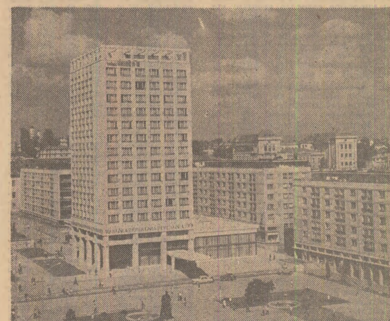
Den nouel peisaj arhitectonic al Iașului

Sere didactice. Pentru prețuirea practică a elevilor din județul Olt s-au amenajat în diferite școli sălăși sere și solarii didactice, care vor însuma în acest an 1 600 mp. În aceste sere cresc în prezent primele culturi de legume, de tomate și ardei. (Emilian Roud)