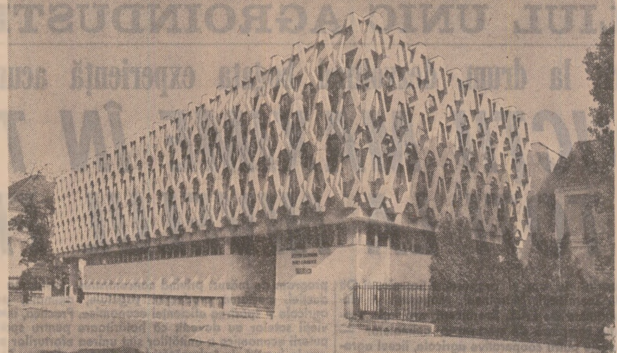
Biblioteca filialei din Cluj-Napoca a Academiei Republicii Socialiste Românie