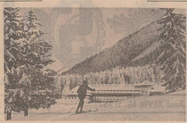
Excursii la Predeal și Poiana Brașov

„Prita s-a certat cu tatăl ei și acesta îl provoacă să degradeze oalele de gătit fierbindu-le pe sobă“... Din caietul grefierului