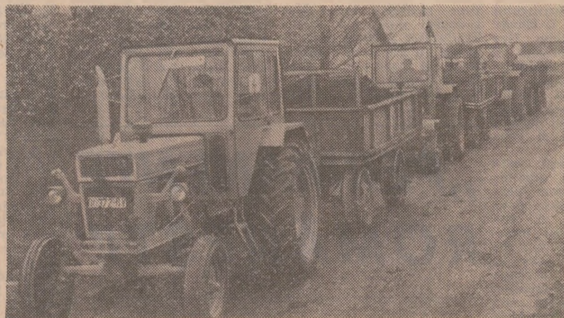
Cînd se „îngrășă” cîmpul, cresc recoltele