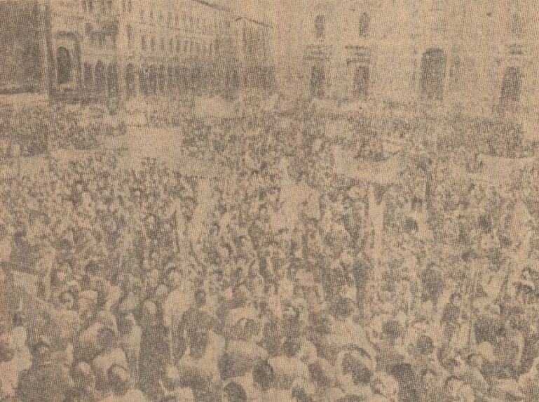
Amplă demonstrație a muncitorilor metalurgiei desfășurată zilele trecute la Milano (Italia) în sprijinul reînnoirii contractelor colective de muncă și satisfacției revendicărilor social-economice

SOFIA 7 (Agerpres). — Plenara C.C. al P. C. Bulgar, care a dezbătut probleme ale organizației și conducerii agriculturii, a adoptat o rezoluție care subliniază necesitatea perfecționării complexe a organizațiilor socialiste a muncii și trecerea la conducerea acestui sector pe baza unor criterii economice. În acest scop, se va trece la crearea de uniuni agrar-industriale naționale, din care vor face parte toate organele economice ale sistemului industrial-agrar național, inclusiv cele care se ocupă cu știința, activitatea tehnică și de proiectări, achizițiile, aprovizionarea, comerțul etc. Principiile de bază ale perfecționării conducerii agriculturii vor fi aplicate, de asemenea, în activitatea construcțiilor de mașini agricole, industriei alimentare, comerțului exterior și altelor.