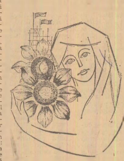
Desen de Tudor ISPAS