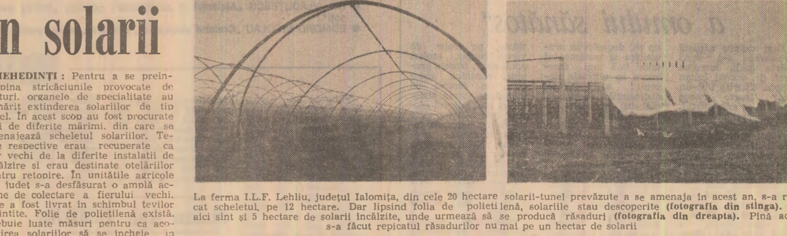
La ferma L.F. Lehliu, județul Ialomița, din cele 20 hectare solarii-tunel prevăzute a se amenaja în acest an, s-a ridicat scheletul pe 12 hectare. Dar lipsind folia de polietilenă, solarile stau descoperite (fotografia din stînga). Tot aici sînt și 5 hectare de solarii încălzite, unde urmează să se producă răsaduri (fotografia din dreapta). Pînă acum s-a făcut repetațiul răsadurilor nu mai pe un hectar de solarii