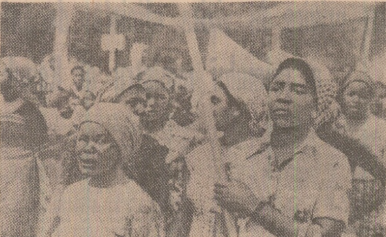
La Maputo, în Mozambic, ca și în alte orașe de pe continentul african, se face tot mai puternic auzul glasului de protest al opiniei publice împotriva politicii inumane de discriminare rasială promovate de regimurile de la Pretoria și Salisbury.