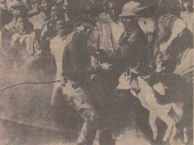
O scenă frecventă în orașele sud-africane: manifestațiile populației în susținerea drepturilor și libertății sînt însoțite de brutalitate, din ordinul autorităților rasiște.