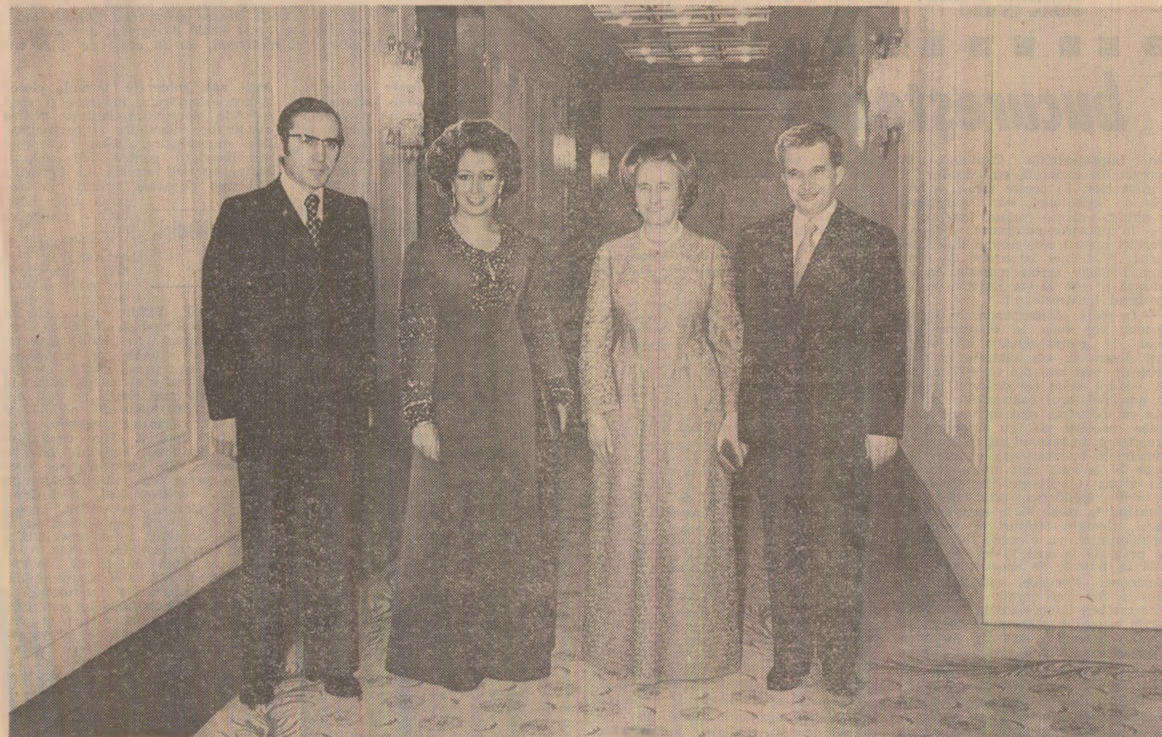
Înainte de dineul oficial

oficiale care îl însoțesc pe președintele portughez. Au luat parte, de asemenea, ambasadorul României în Portugalia și ambasadorul Portugaliei în România. Au fost intonate imnurile de stat ale celor două țări. În timpul dineului, care s-a desfășurat într-o atmosferă caldă, cordială, președintele Republicii Socialiste România, tovarășul Nicolae Ceaușescu, și președintele Republicii Portugheze, generalul Antonio Ramalho Eanes, au rostit toasturi, urmărind cu atenție și subliniind cu aplauze