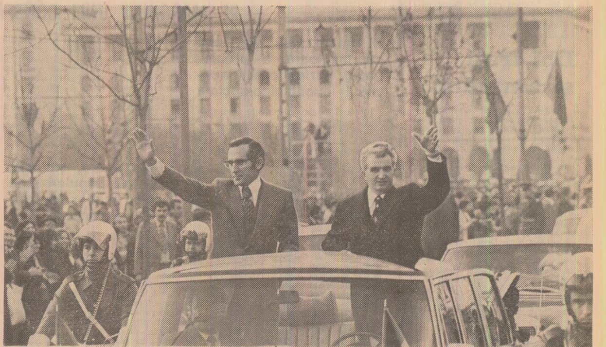
Populația Capitalei aclamă călduros pe cei doi președinți