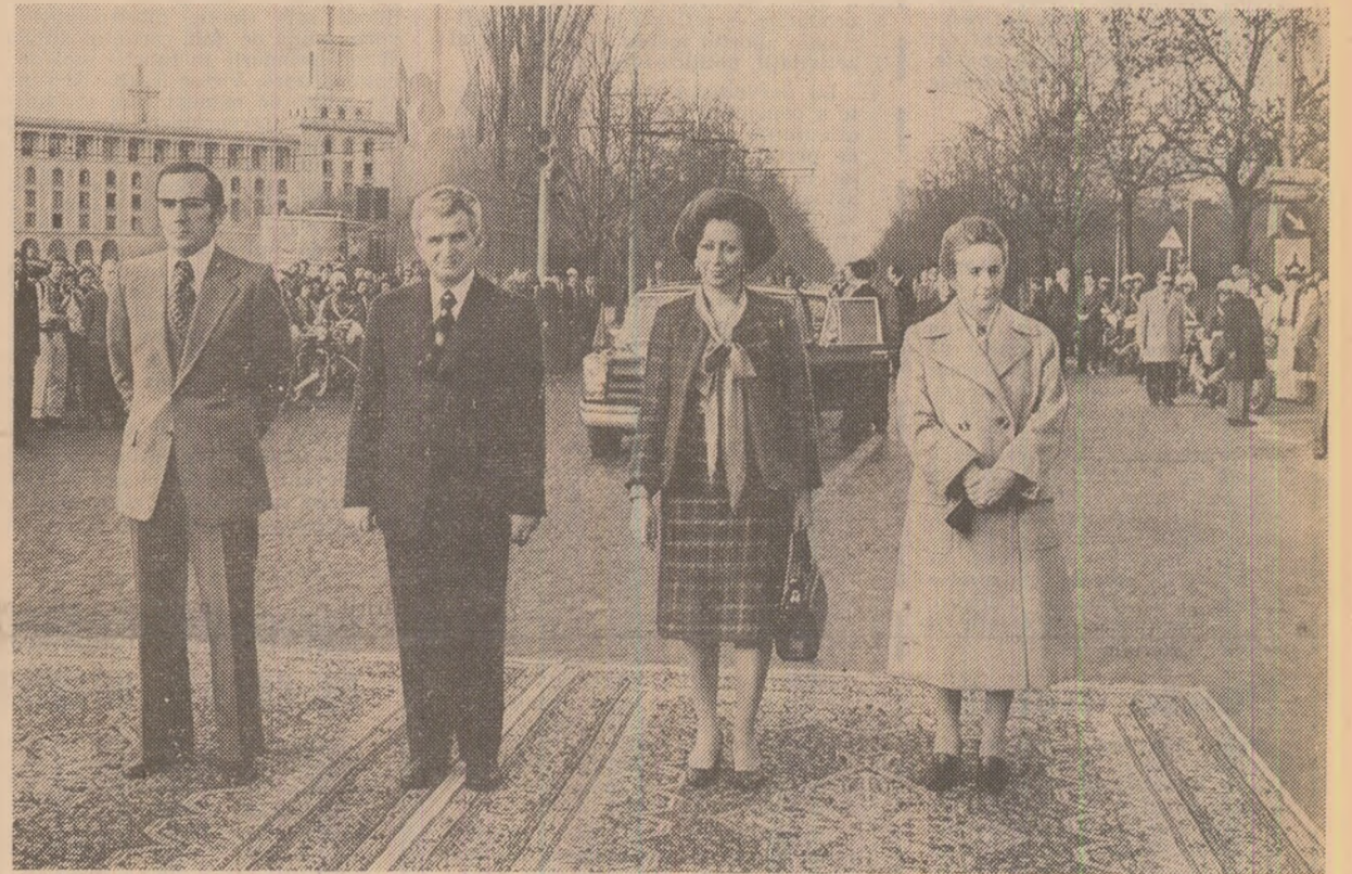
În Piața Școlii, cu prilejul înmîndrii cheii orașului București

bilaterale să fie examinate în cadrul întîlnirilor de lucru între factorii de răspundere din delegațiile celor două țări, în vederea identificării de noi căi și modalități care să ducă la intensificarea și diversificarea cooperării economice, a schimburilor comerciale, la dezvoltarea generală a relațiilor româno-portugheze.