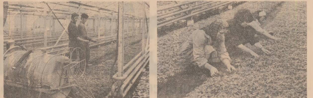
La complexul de sere ale I.L.F. lași se produc răsădirile necesare plantării în solarii și grădini. Iată două aspecte din timpul lucrărilor de îngrijire: tratamentul fitosanitar al răsădirilor de tomate (fotografia din stînga) și executarea plivutului (fotografia din dreapta)

— Fără îndoială! După lucrările de restaurare și modernizare, vor fi reînnoite în circuitul turistic hotelurile „Nations“, „Ambasador“, „Opera“ și „Athénée Palace“, ceea ce va face ca în acest an capacitatea de cazare a rețelei hoteliere bucureștene să ajungă la peste 9 500 locuri. Într-un mare număr de unități de alimentație publică se vor crea condiții pentru servirea în aer liber, amenajîndu-se terase pentru încă 2 000 de mese. Se vor deschide noi unități de desfacere și de alimentație publică în zonele de agrement