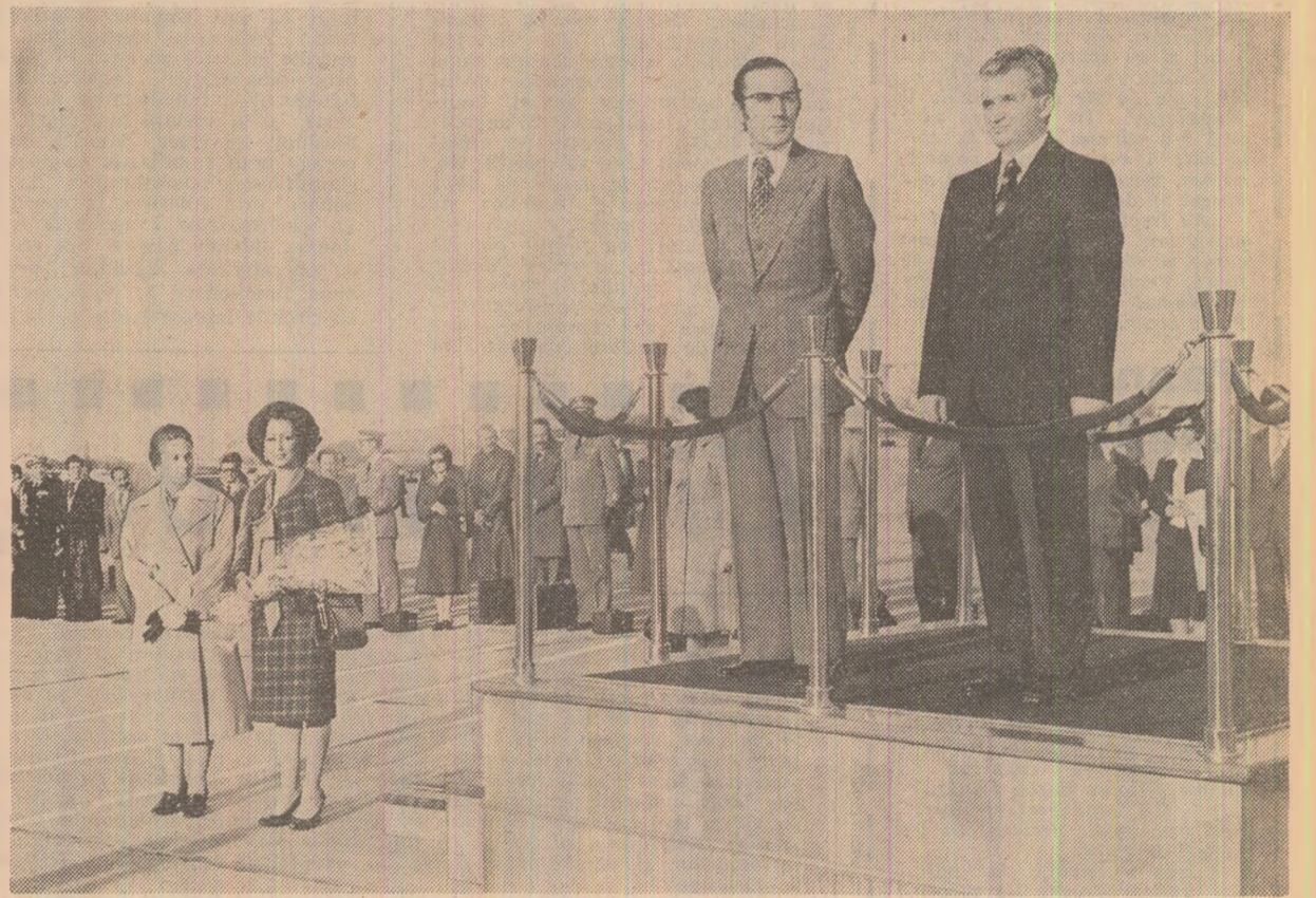
Moment de la ceremonia sosirii