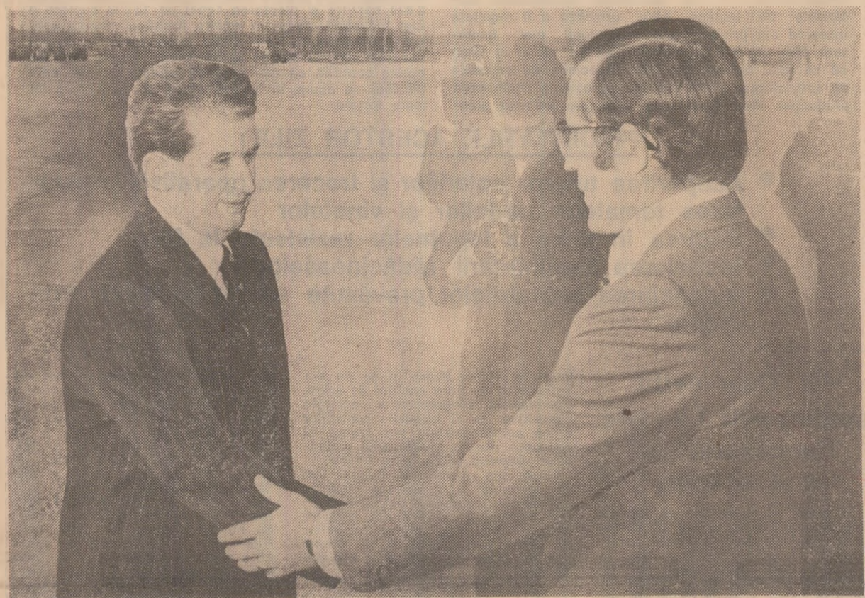
La sosire, pe aeroportul Otopeni