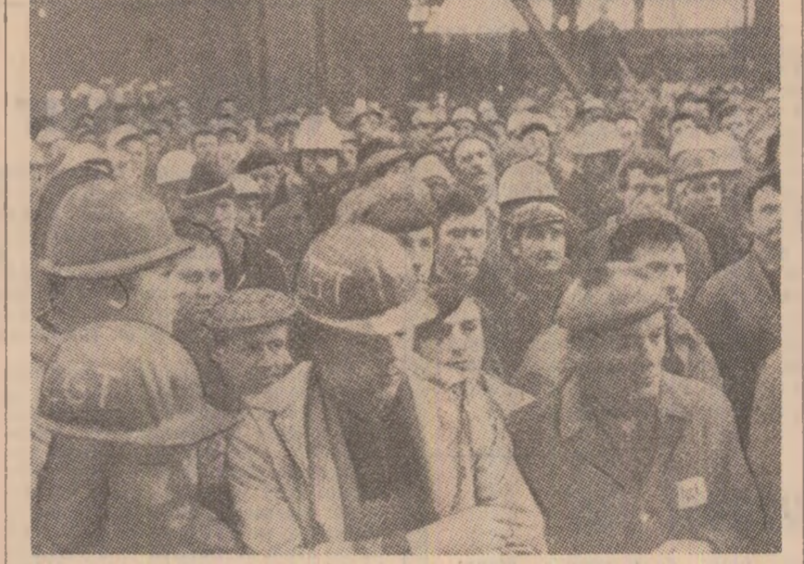
O puternică frămîntare a cuprins siderurgia, „industria bolnavă” a economiei occidentale. Măsurile de restructurare preconizate amenință zeci de mii de muncitori cu perspectiva sumbră de a deveni șomeri. Ca urmare, săptăzîna aceasta a marcat o nouă creștere a valului de proteste în diverse centre siderurgice vest-europene. În fotografie: demonstrație a siderurgistilor francezi pentru garantarea locurilor de muncă