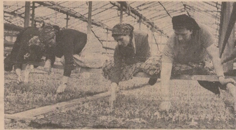
La Centrul de producere a răsadurilor de la Movilița, județul Ilfov, există două hectare de sădă imnului și șase hectare soiului încălzite.

Pentru a obține în acest an fructe mai multe și de bună calitate, în primăvara în care am pășit urmează să se execute în livezi un mare volum de lucrări: tăieri, opriri, fertilizarea și îngrijirea solului.