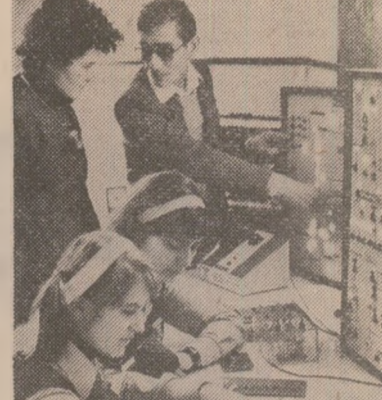
Liceul „Mihail Eminescu” din Satu Mare. Aici a fost realizat de elevii liceului trusu complex de circuite logice, care a obținut premiul I pe țară la Festivalul național „Cîntarea României”