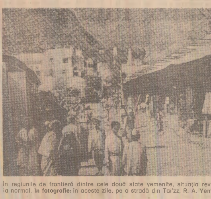
În regiunile de frontieră dintre cele două state yemenite, situația revine la normal. În fotografie: în aceste zile, pe o stradă din Ta'izz, R. A. Yemen

în acest cadru probleme legate de aplicarea acordului intervenției între R.A. Yemen și R.D.P. Yemen după retragerea completă a forțelor armate ale celor două state în limitele frontierelor naționale.