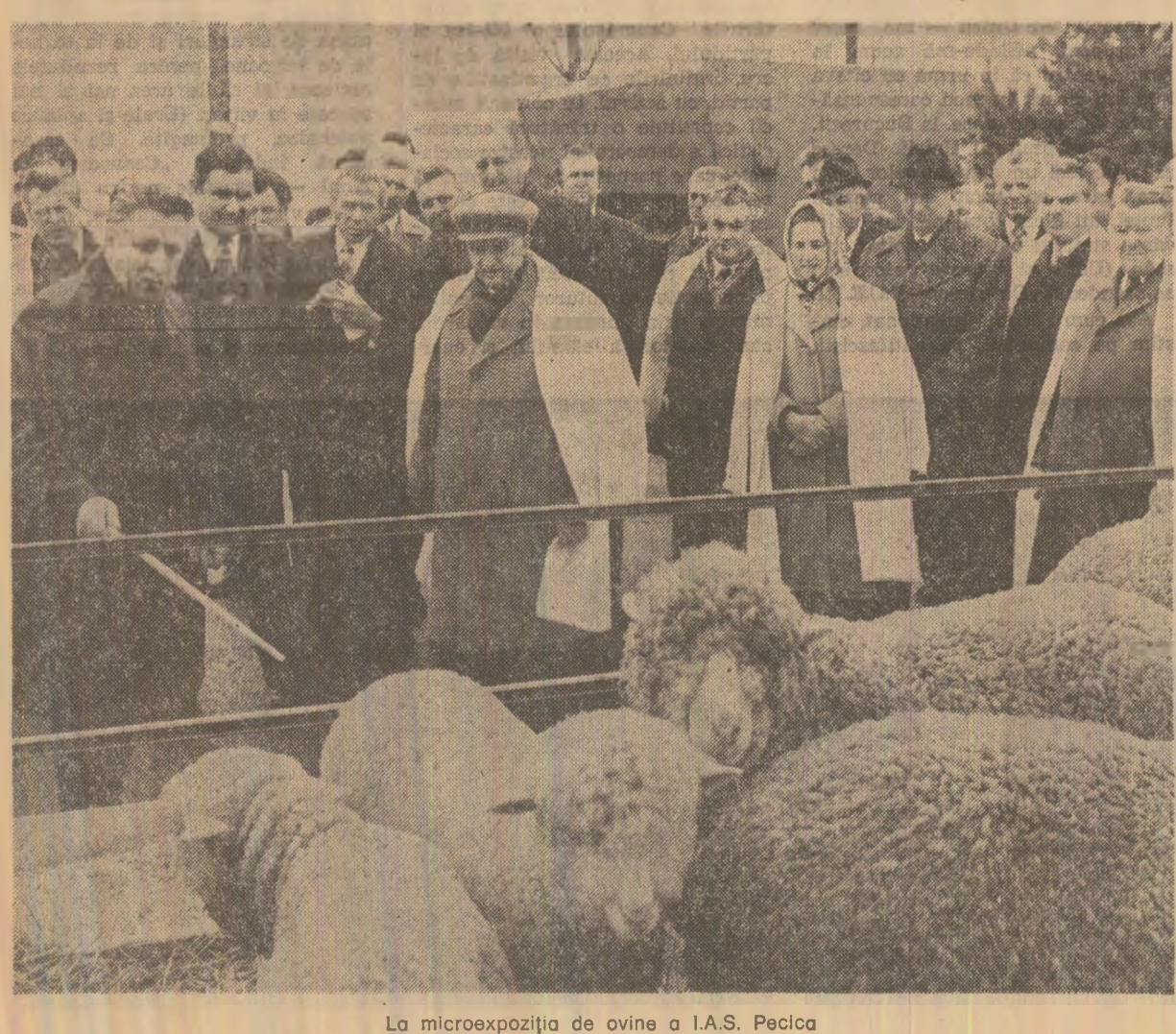
La microexpoziția de ovine a I.A.S. Pecica