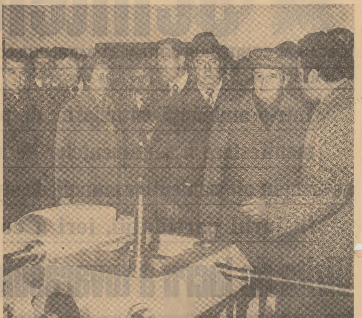
Sînt analizate probleme privind ridicarea competitivității strunzurilor românești

Vă rog să-mi îngăduiți, totodată, ca, în aceste zile, cînd întregul nostru popor sărbătorește 5 ani de la