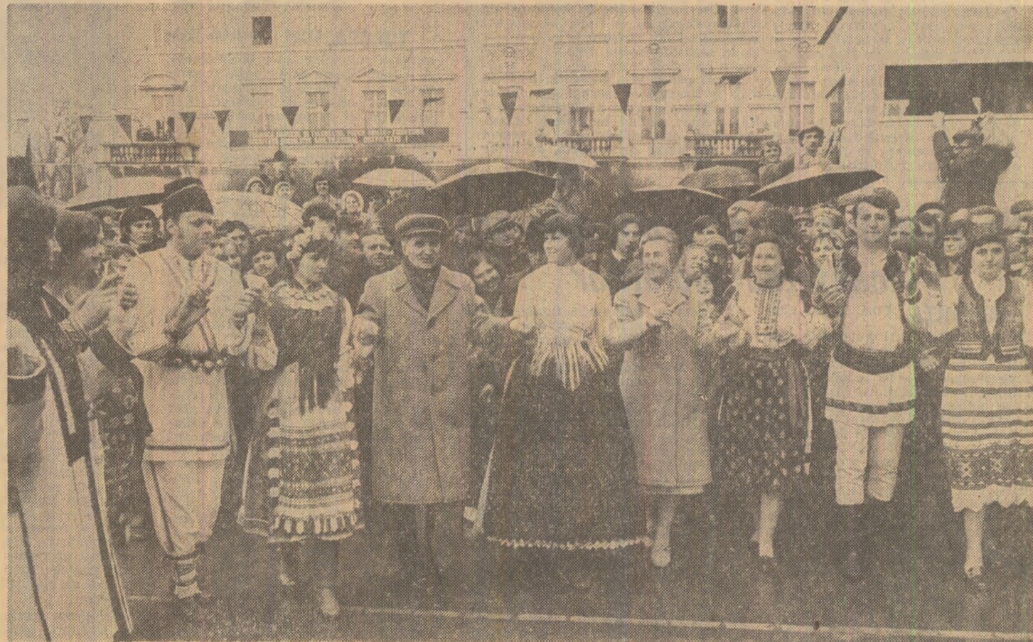
În marea piață a municipiului — hora frăției și unității