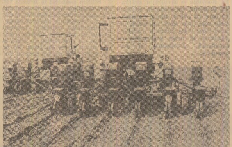
Imagini surprinse pe ogoarele județului Olt: la I.A.S. Redea se pregătește terenul pentru însămînțări, iar la C.A.P. Olteca de Sus se acționează cu toate forțele pentru semănatul florei-soarelui

vegetale. În fermele întreprinderilor agricole de stat Rahmanu, Căsimcea, Traianu, Sarinasu ș.a., adîncimea de semănat a fost mărită cu 1-2 cm față de media recomandată. De asemenea, pe terenurile cu umiditate suficientă, adîncimea de semănat a fost redusă la 4-5 cm. Este însă nevoie de mai mult discernămint în stabilirea uneia sau alteia dintre lucrări, în dirijarea utilitatelor în raport cu starea fiecărei parcele de teren. O situație anormală constatată la una din fermele I.A.S. Traianu a fost corectată din mers de către specialiștii trustului: pe un teren curat și nivelat se lucra cu discurile, în loc să se folosească grapele reglabile, în schimb, pe altă parcelă plină de bolovan și resturi vegetale se foloseau grapele, fiind necesar să se întervină cu discurile la pregătirea terenului. Stringerea resturilor vegetale de pe terenuri constituie în momentul de față o problemă presantă pe ogoarele județului Tulcea: în multe locuri, cocenii de po-