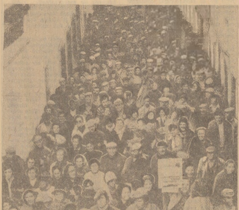
In orașul portughez Portalegre s-a desfășurat o mare manifestație populară...