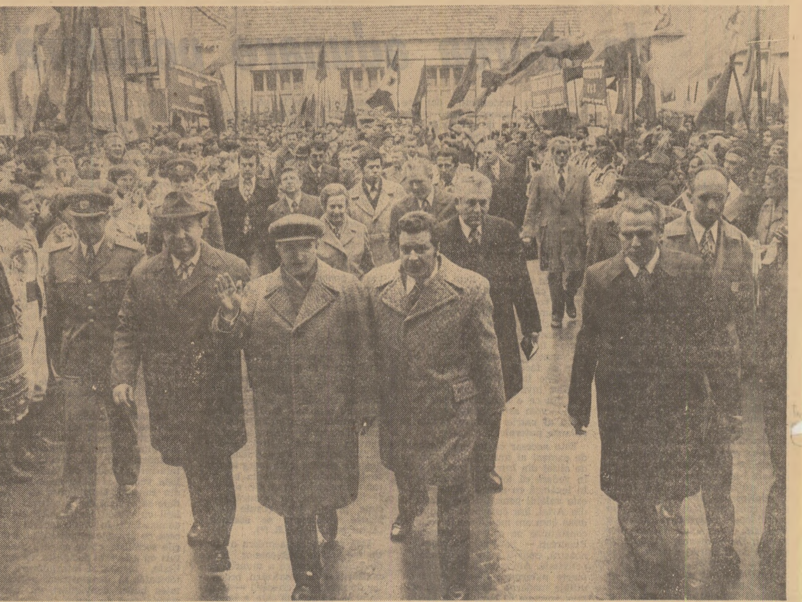
Primire entuziastă la întreprinderea de strunguri

Adresîndu-se tovarășului Nicolae Ceaușescu, la sfîrșitul cuvîntării, primul secretar al comitetului județean de partid a spus: Vă audecem, încă o dată, multumirile cele mai profunde, recunoștința noastră