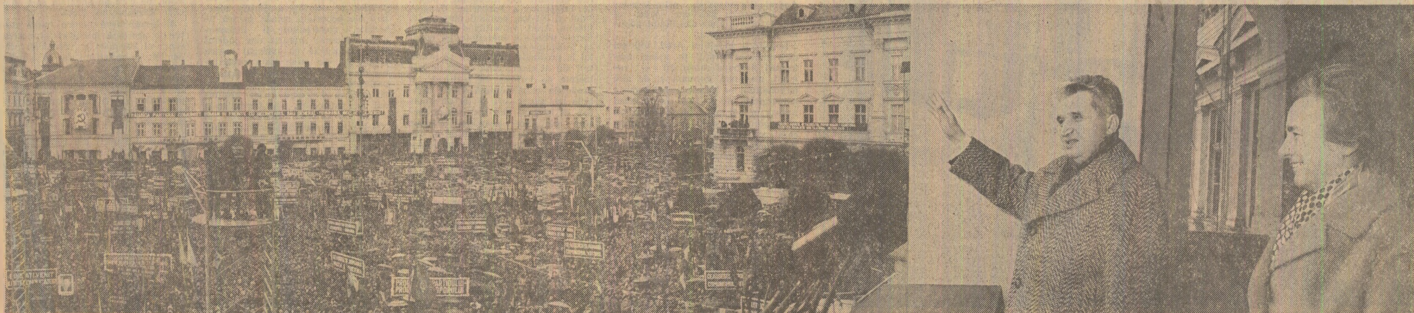
În timpul marii adunări populare

NICOLAE CEAUȘESCU Președintele Republicii Socialiste România