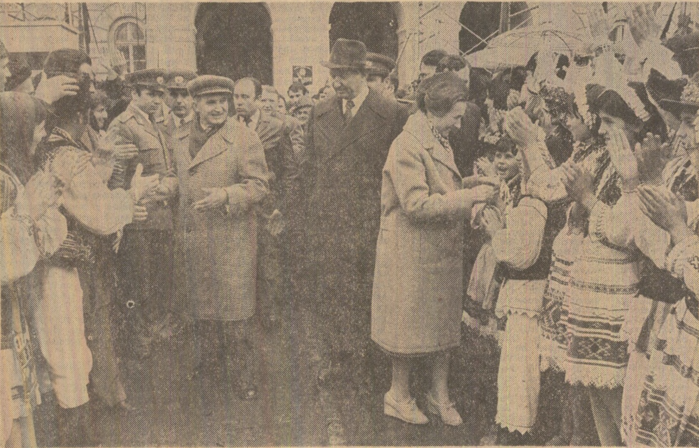
Calde aplauze pentru oaspeții dragi

Dragi tovarăși și prieteni, Aș dori, în încheiere, să exprim convingerea că oamenii muncii din Arad, atît din industrie, cit și din agricultură, precum și din celelalte sectoare și ramuri de activitate, vor face totul pentru a îndeplini în cele