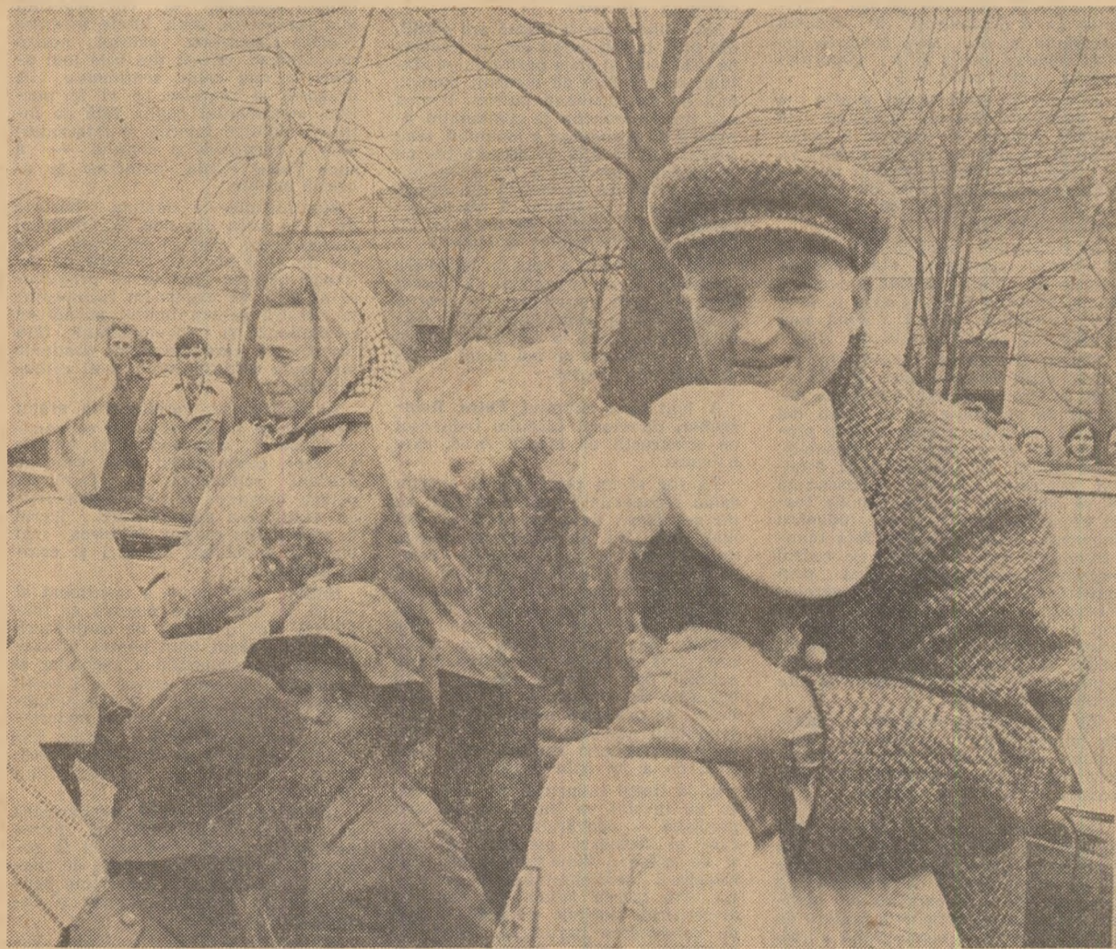
Flori ale dragostei și recunoștinței

Sîntăm neabătut la temelia tuturor relațiilor noastre internaționale principiile deplinei egalități în drepturi, respectului independenței și suveranității naționale, neamestecului în treburile interne, renunțarea cu desăvîrșire la forța sau la amenințarea cu forța. Ne pronunțăm ferm pentru dreptul fiecă-