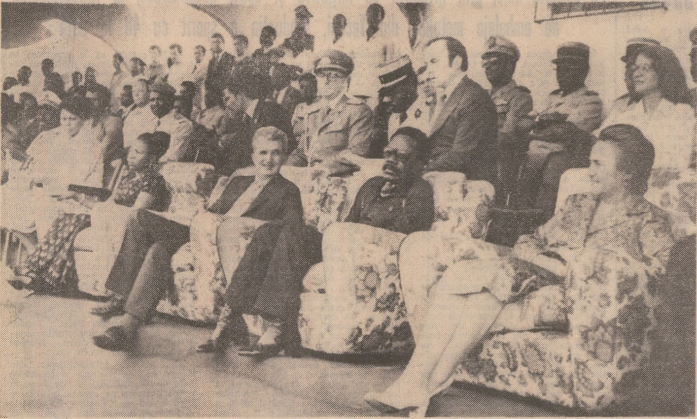
La mitingul din Franceville