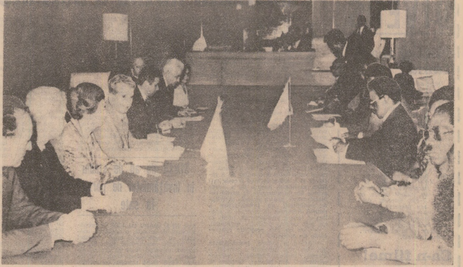
În timpul convorbirilor oficiale din prima zi a vizitei