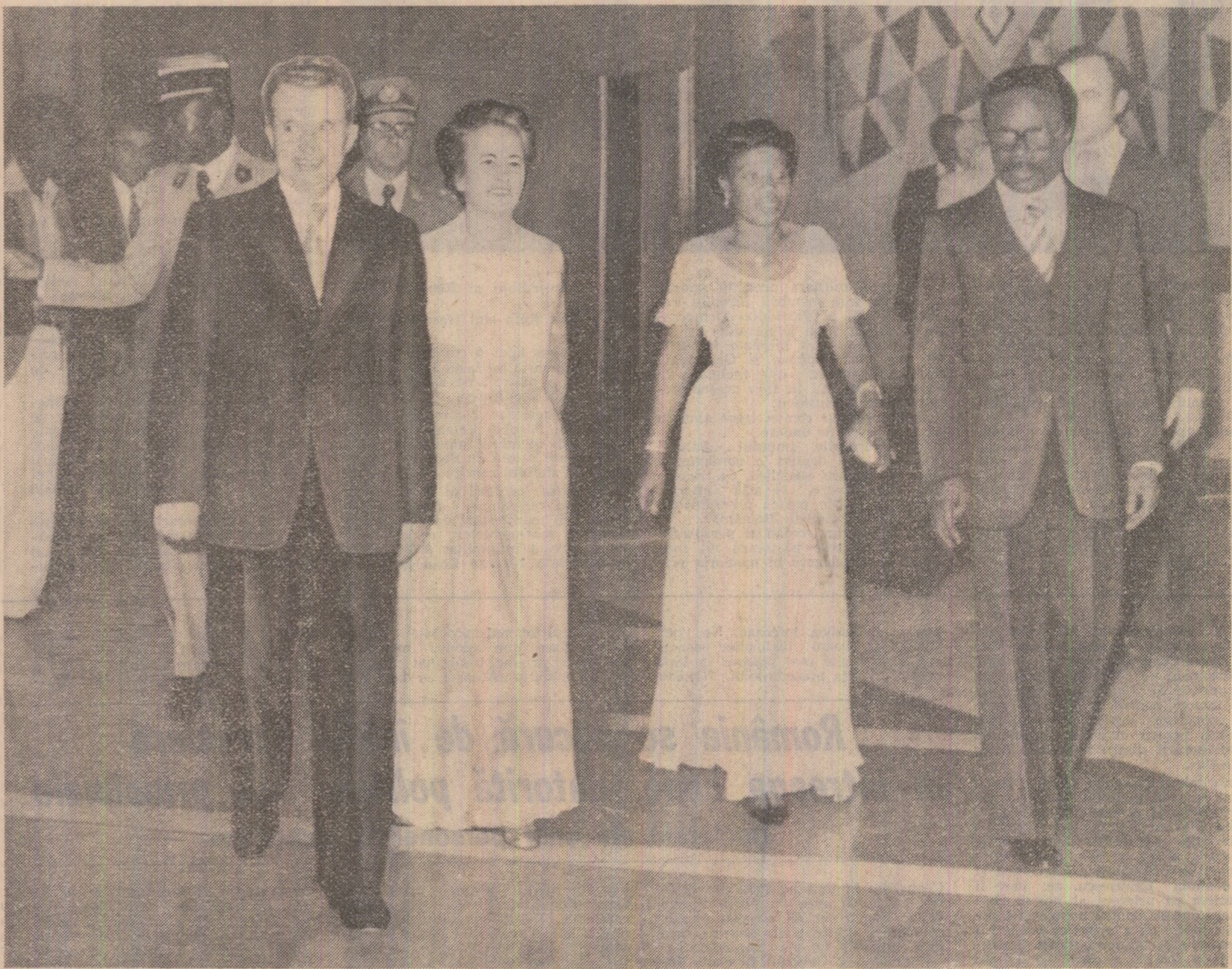
La dîneul oferit în onoarea președintelui Nicolae Ceaușescu și a tovarășei Elena Ceaușescu în prima zi a vizitei oficiale