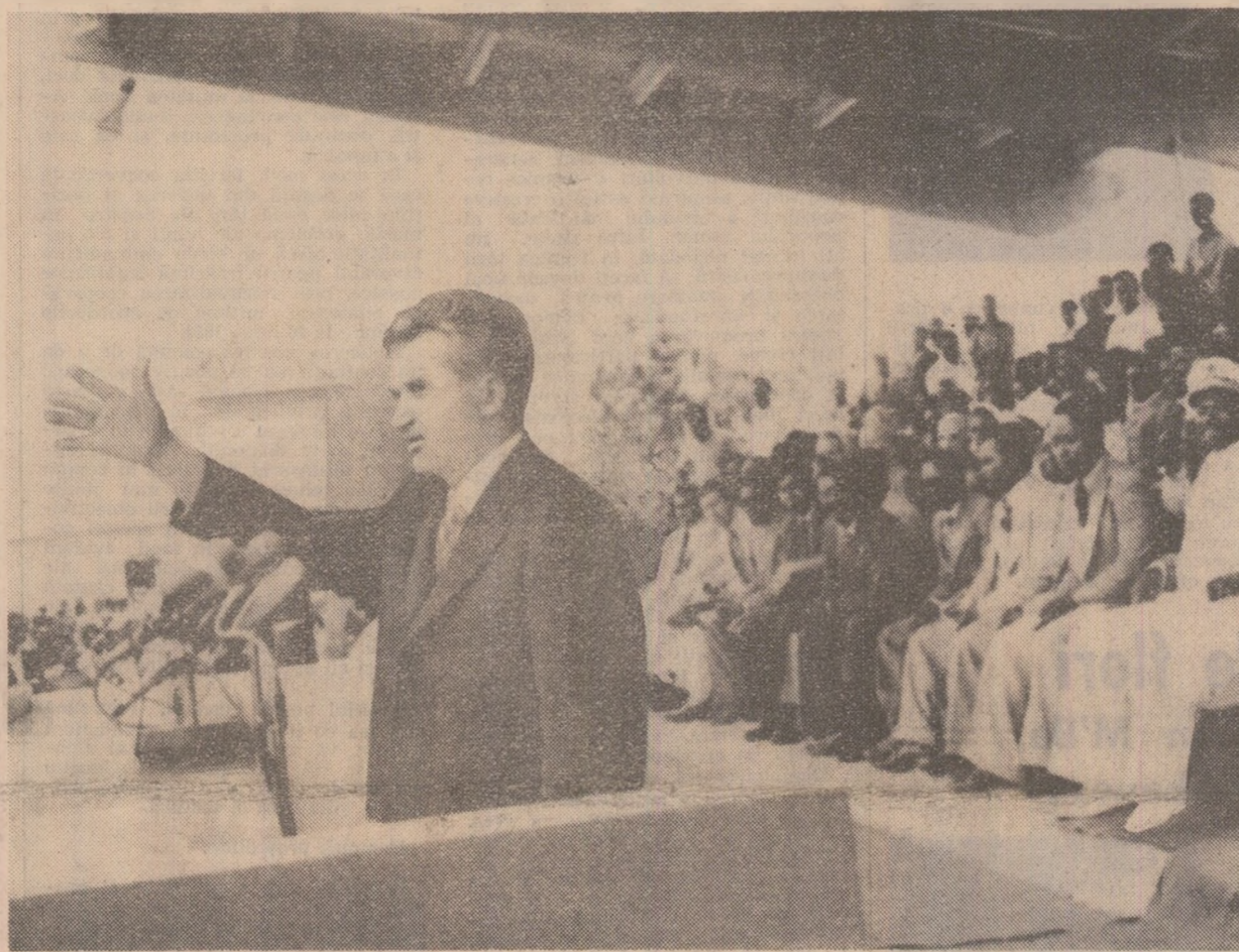
În timpul mitingului prieteniei dintre popoarele român și gabonez din orașul Franceville

Noi nu putem decît să vă mulțumim pentru sprijinul pe care n-ați încetat niciodată să-l acordați soluționării problemelor africane de către africanii înșiși, întăririi unității și solidarității statelor africane și pentru sprijinul pe care, de asemenea, nu ați încetat niciodată să-l acordați luptei popoarelor din Rhodesia și Namibia, cauzei lichidării oricărei politici și oricărei practici de discriminare rasială în lume.