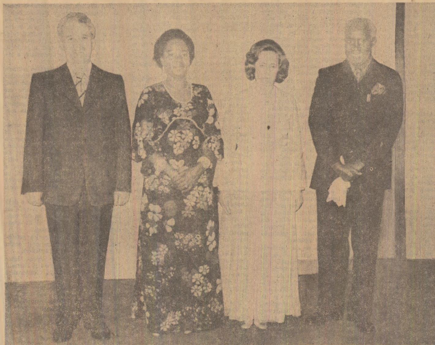
La dineul de marți seara oferit în onoarea președintelui Nicolae Ceaușescu și a tovarășei Elena Ceaușescu