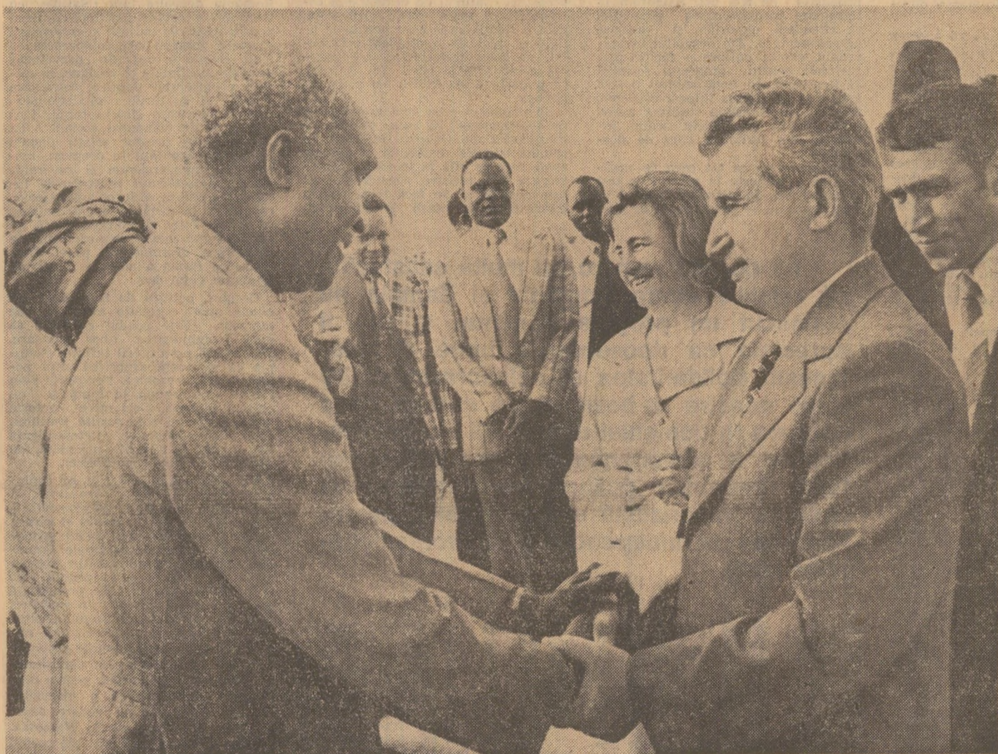
Președintele Nicolae Ceaușescu și președintele Kenneth David Kaunda își iau un cordial rămas bun

O nouă etapă istorică în dezvoltarea colaborării strinse, multilaterale, dintre popoarele român și zambian, în interesul reciproc, al cauzei independenței naționale și progresului social al tuturor popoarelor