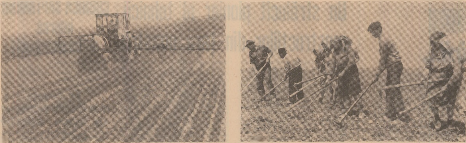
La cooperativa agricolă din Dobra, județul Dimbovița, utilajele lucrează la erbicidarea inului (fotografia din stânga). Pentru combaterea buruienilor, la cooperativa agricolă din Cojașca, județul Dimbovița, toată sulfarea satului este la prășitul steclei de zahăr (fotografia din dreapta)