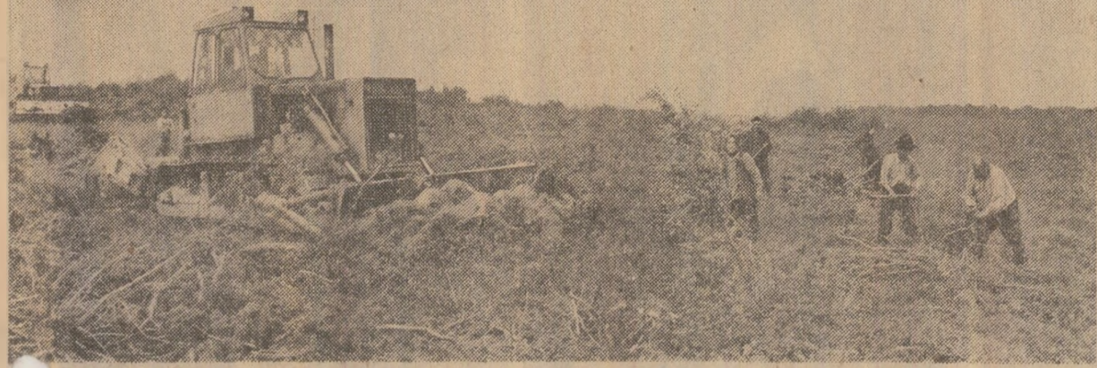
C.A.P. Dragodana, județul Dimbovița, au fost identificate toate sursele de teren pentru creșterea suprafeței arabile. Cu mijloace mecanice de mare putere, dar și manual, se lucrează la scoaterea mărcinișilor de pe două hectare de teren, care vor fi cultivate cu pepeni încă din acest an.