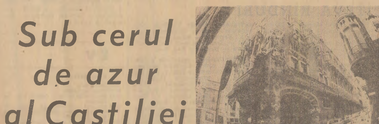
Insulețită de genul arhitectural hispanic, piatra devine simfonie