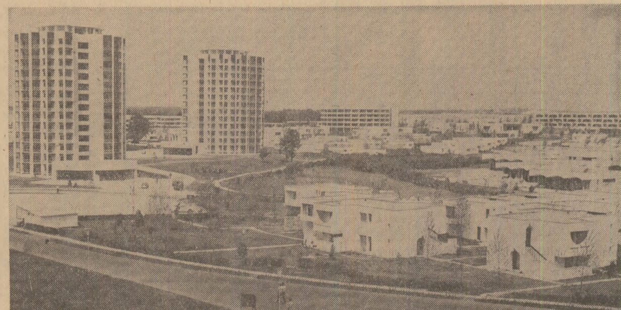
AI. PLAIESU Gh. CRISAN

Ce bine ar fi dacă străzile din orașul Zalău ar avea, nasturi sau fermoare. Nasturi si fermoare cu care să se poată deschide și închide după dorință. Cel mai mare și mai mult s-ar bucura. Ințînăși de prezentare, două moduri diferite in care este privită gria față de cumpărătorii. (Gh. Giurgiu).