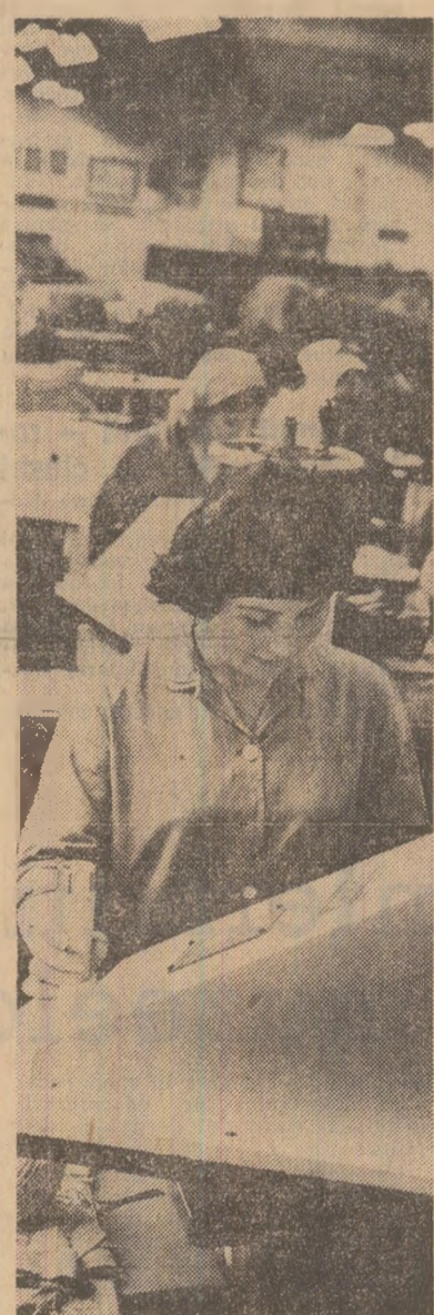
Întreprinderea de piele și încălțămînt „Crișul” Oradea. Aspect din secția șantajat țefte

Gheorghe SUSA correspondentul „Scintilei”