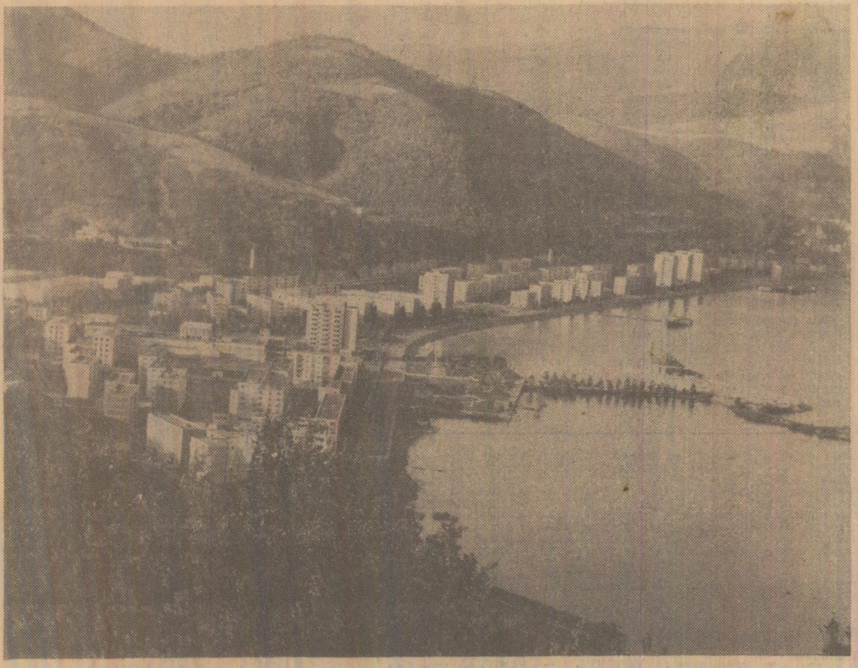
Orșova nouă — oraș simbol al forței și hîmniciei constructorilor de la Dunăre în aspra bătălie pentru supunerea apelor bătrînului fluviu

Realizarea producțiilor prevăzute a se obține în acest an în agricultură — 24,6 milioane tone cereale și recolte superioare la celelalte culturi — presupune cultivarea întregii suprafețe arabile, cit și aplicarea corectă a tehnologiilor stabilite. În lumina indicațiilor și a sarcinilor subliniate de tovarășul Nicolae Ceaușescu, secretarul general al partidului, la Consfățuirea de lucru de la C.C. al P.C.R., organele și organizațiile de partid, direcțiile agricole, consiliile unice agroindustriale, fiecare unitate agricolă au obligația de mare răspundere de a asigura folosirea rațională a fiecărui metru pătrat de pămînt, cultivîndu-l în mod corespunzător. De ce conducerea partidului pune cu atîtă acuitate problema cultivării integrale a suprafeței arabile, a executării cu răspundere și în cele mai bune condiții a lucrărilor agricole? Mai presus de orice, pentru că folosirea cu chibzuință a tuturor terenurilor agricole și creșterea randamentului la hectar constituie factori hotărîtori în realizarea programului de dezvoltare a producției agricole.