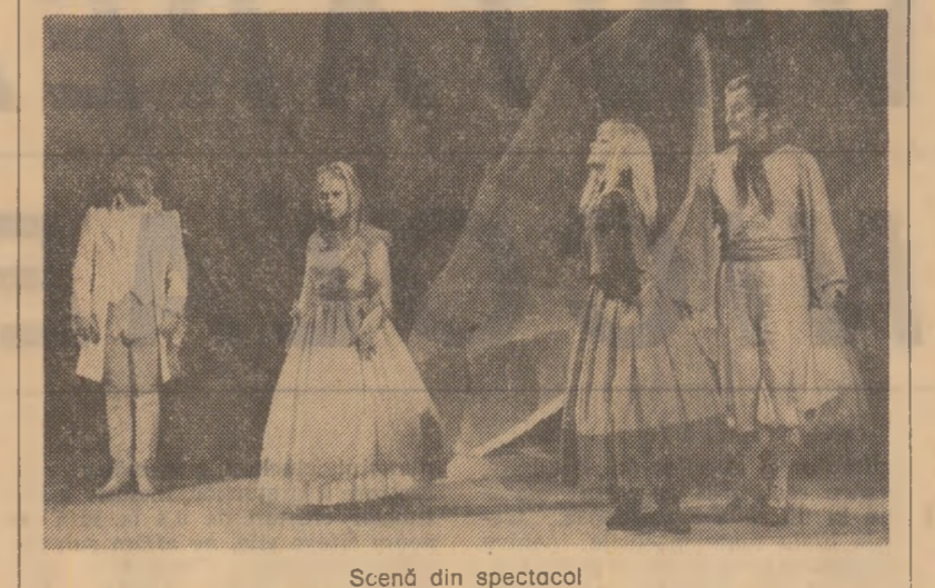
Scenă din spectacol

Un eveniment editorial deosebit îl constituie apariția, în aceste zile în Editura Politică, a „Dicționarului diplomatic”, prima lucrare de acest fel în literatură politică românească. Dicționarul își propune să realizeze, într-o prezentare cât mai sintetică, o expunere științifică a noțiunilor cel mai frecvent utilizate în activitatea de relații externe în cîteva mari domenii — istoria, diplomația, relații politice și economice internaționale, drept internațional. Volumul însuși măsoară nu mai puțin de 4000 de articole, definiții și informații asupra principalelor concepte, evenimente, probleme și noțiuni uzuale din domeniul diplomației și al relațiilor internaționale în general. Sînt cuprinse, de asemenea, articole privind un important număr de organizații internaționale guvernamentale și neguvernamentale, cu precădere acelea din care face parte România. Acoperind o largă arie informațională, dicționarul prezintă selectiv evenimente și probleme ce au constituit momente deosebite în evoluția vieții internaționale într-o anumită etapă. În tratarea diferitelor