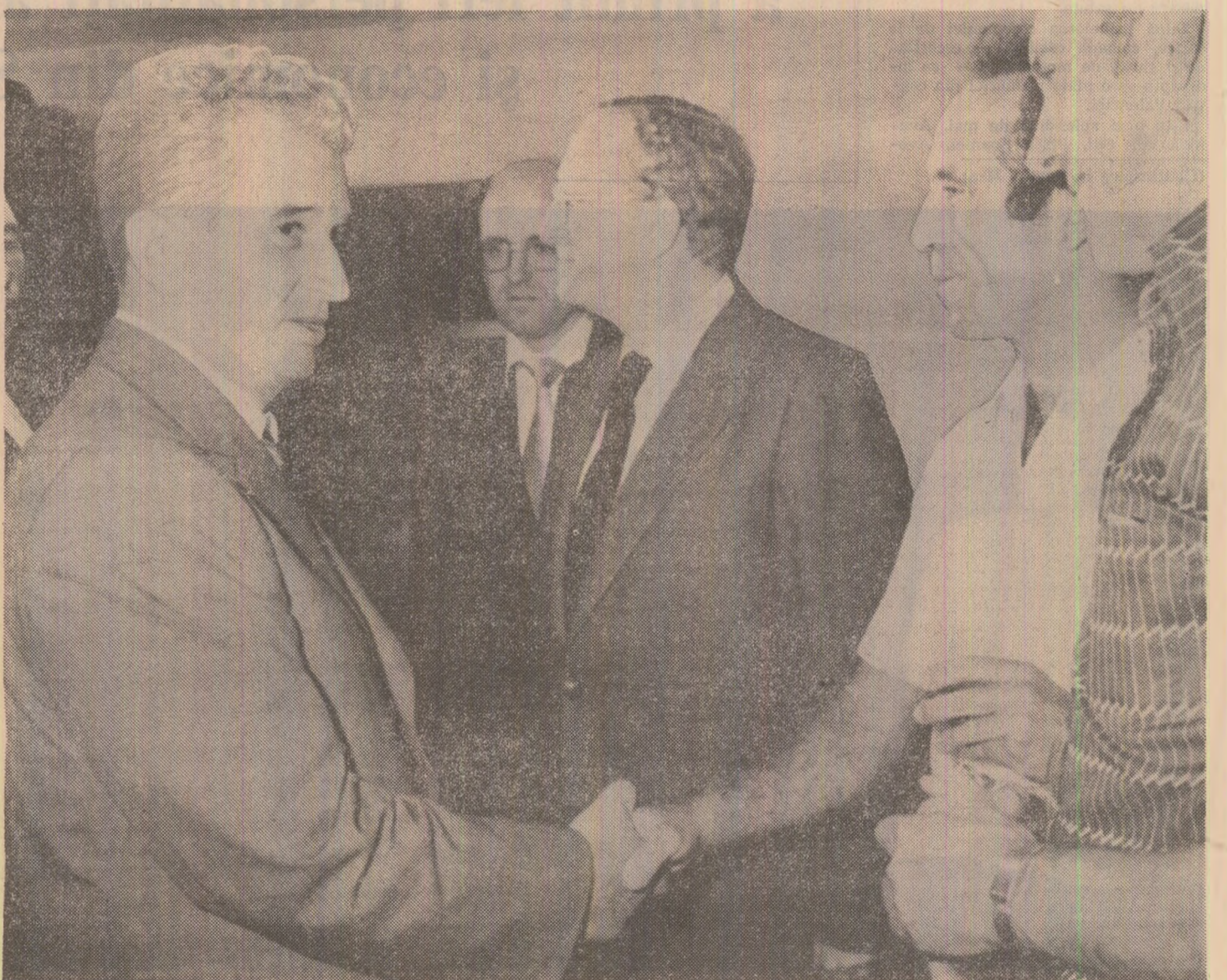
Primele călduroasă la Combinatul siderurgic „Altos Hornos del Mediterraneo“ din Sagunto