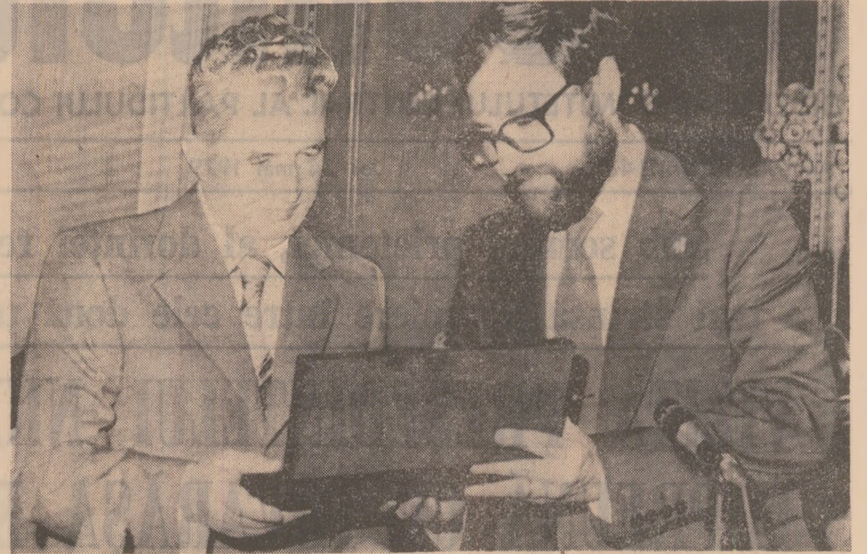
În timpul festivității de la primăria orașului Valencia