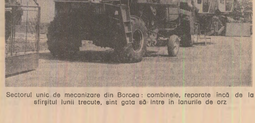
Sectorul unic de mecanizare din Borcea: combinete, reparate încă de la sfârșitul lunii trecute, sînt gata să intre în lanurile de orz