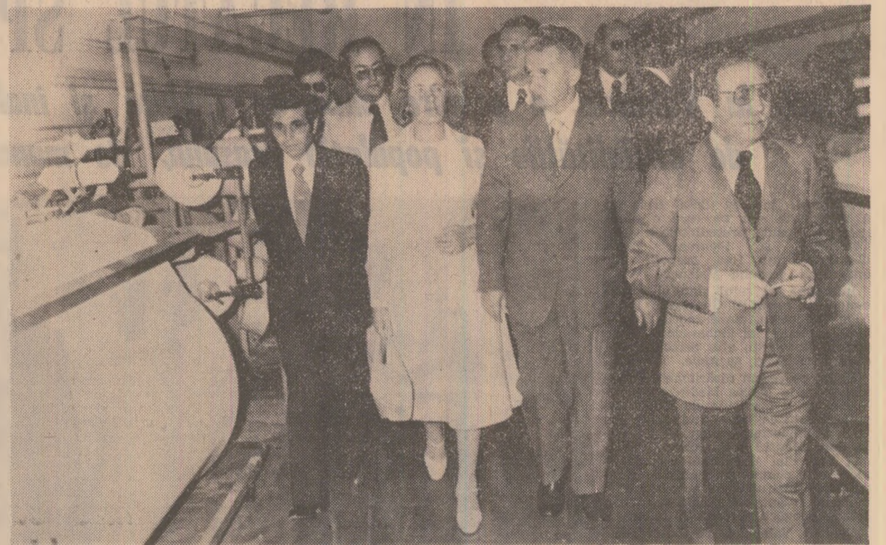
La fabrica de textile „Lois“

ciei, datînd din secolul XV, din perioada războaielor pentru reînțegirea Spaniei. La plecare, înalții oaspeți români își iau un călduros rămas bun de la gazdele municipale. Numeroși cetățeni aflați în Piața Primăriei salută pe președintele Nicolae Ceaușescu și pe tovarăsa Elena Ceaușescu, exprimîndu-și bucuria și satisfacția de a-i avea ca oaspeți de onoare în orașul lor. Tovarășul Nicolae Ceaușescu și tovarăsa Elena Ceaușescu răspund acestor manifestații de simpatie.