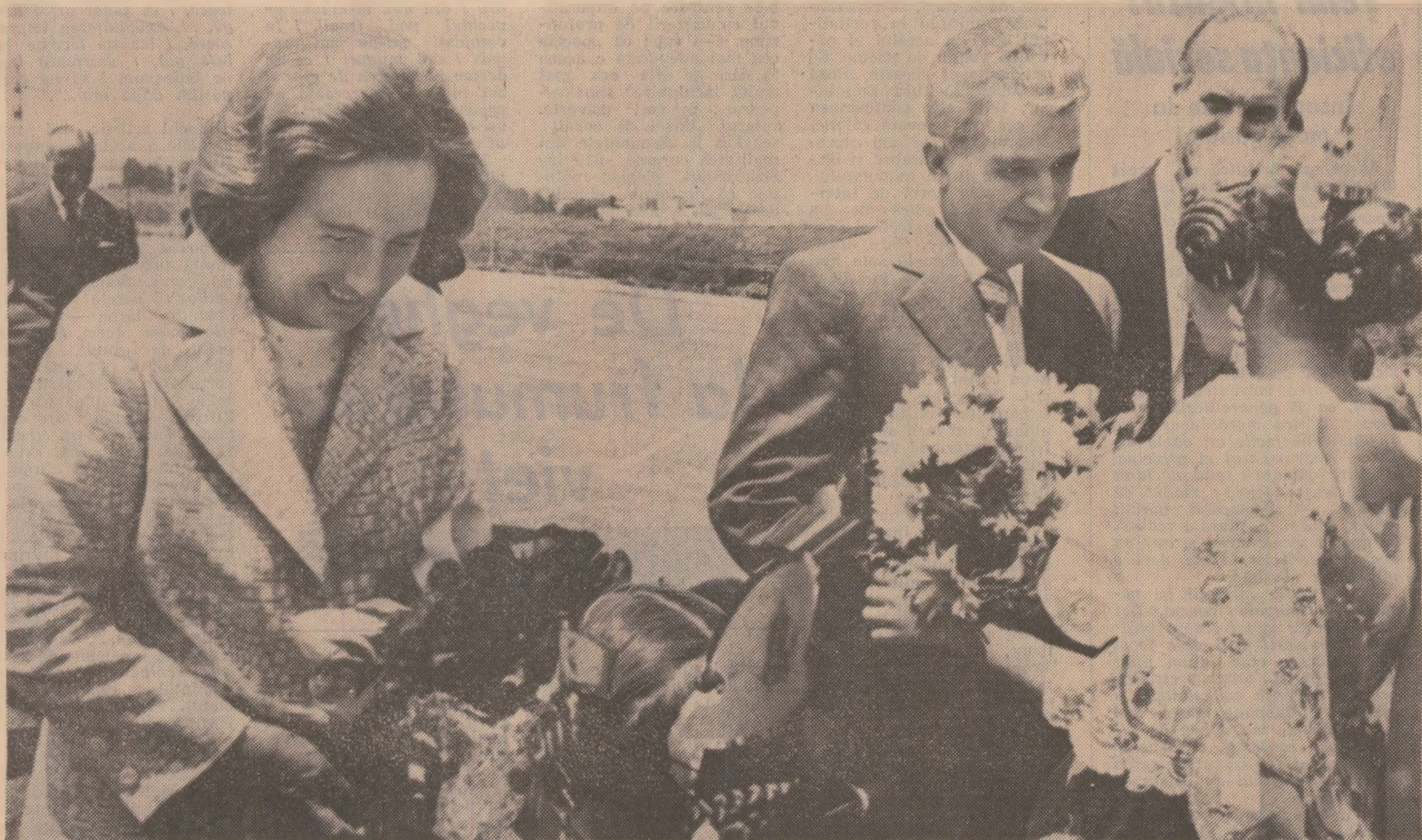
Distingșii oaspeți le sînt oferite buchete de flori