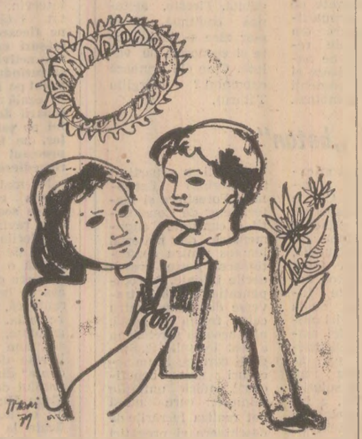
Desen de Traian VASAI

Într-un articol conceput la Oradea în primii ani ai secolului nostru, consacrat vîitorului omenirii — copii — pe care îl poartă cu pasiune și dragoste nefermîrită, Ady Endre, în cuvînt înflăcărat, a adresat oamenilor de pe aceste meleaguri, vîorbînd limbi diferite, chemarea de a-și stringe rîndurile într-o unitate frățească, de a-și înconjura pe copii cu sentimentul dragostei, al înțelegerii și înăduinței. Mă gîndeam la această chemare a sufletului unui mare poet, la avertismentul său de neuitat în timp ce mă delectam la spectacolul dăruit publicului de ansamblul de dansuri aparținînd Casei pionierilor și oimilor patriei din municipiul Tg. Mureș.