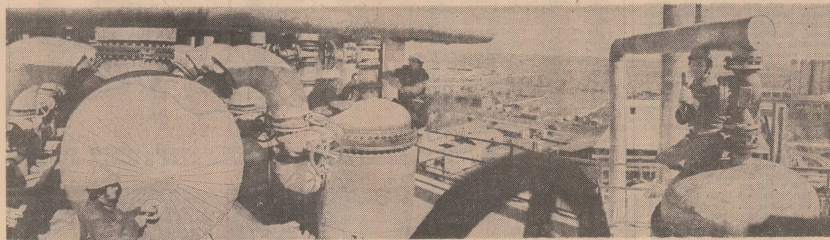
Combinatul chimic din Giurgiu