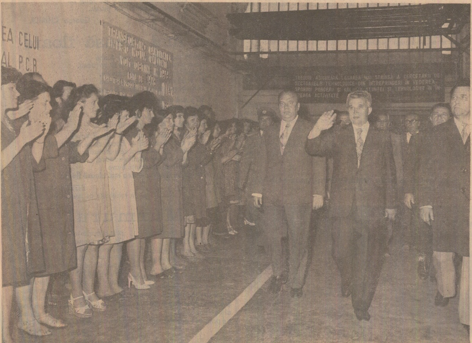
Pretutindeni, tovarășul Nicolae Ceaușescu l se face o primire entuziastă

Tovarășul Nicolae Ceaușescu răspunde cu prietenie acestor gesturi de căldură simpatie, aclamațiilor și ovățiilor muncitorilor, inginerilor și tehnicienilor.