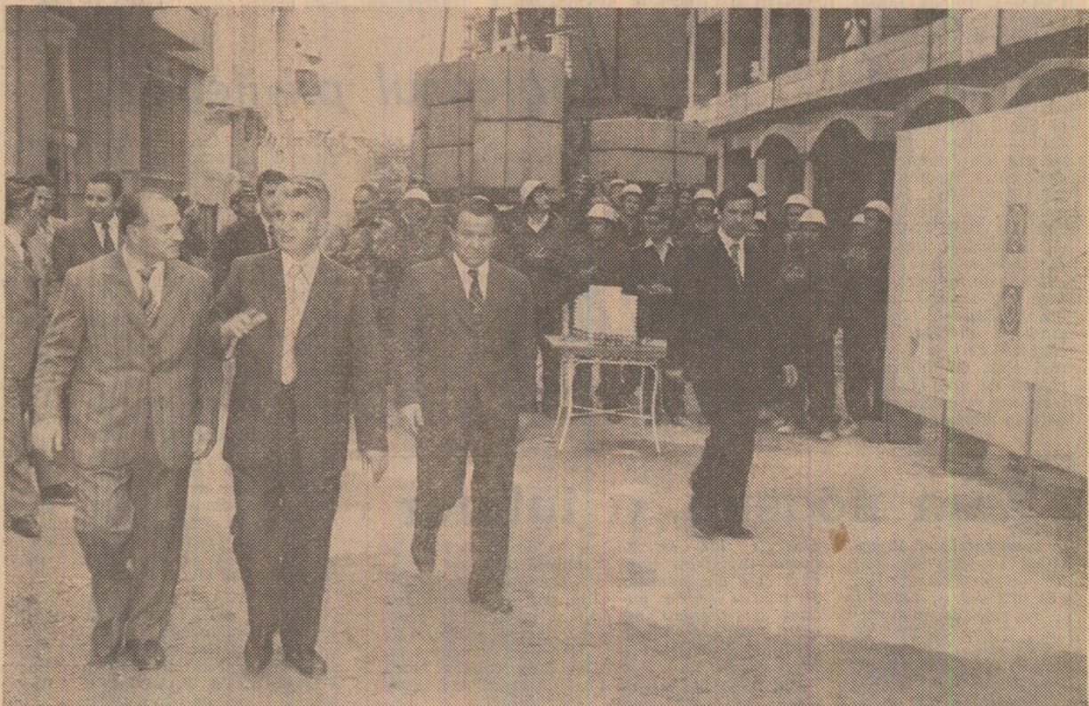
Pe șantierul noului bloc „Grădinița”