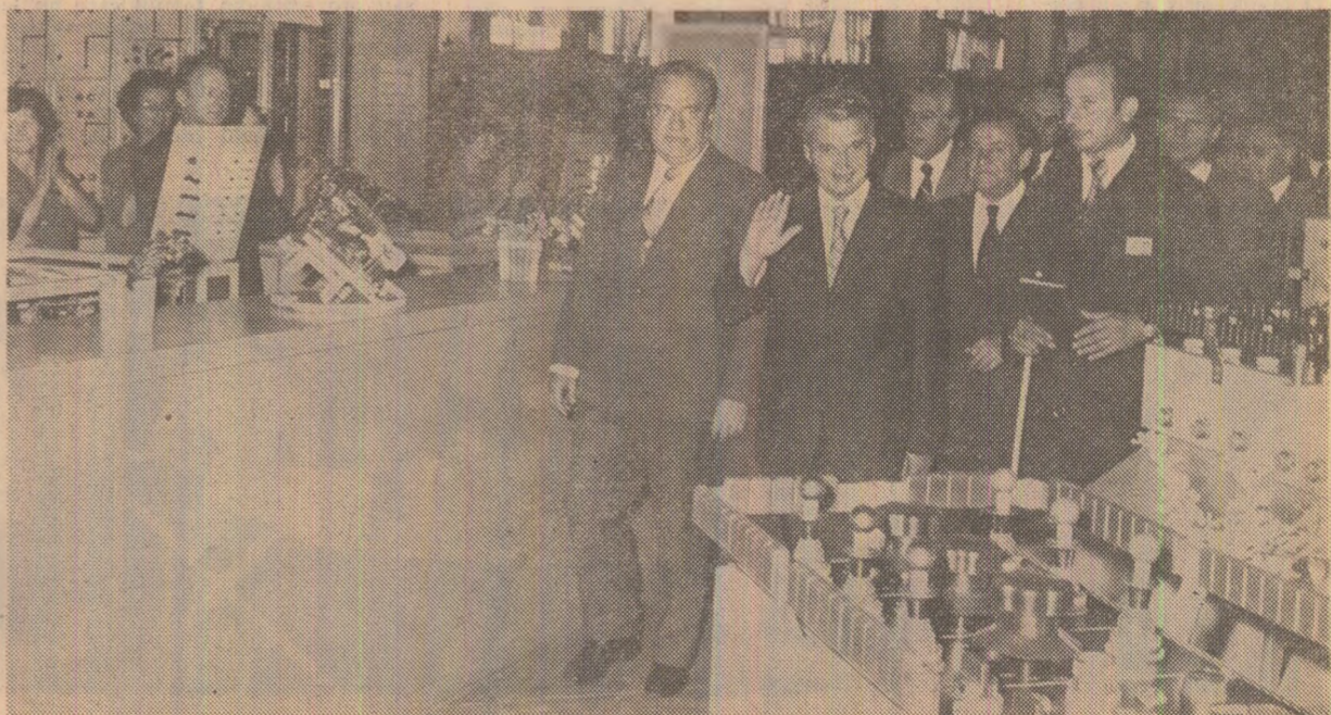
În timpul vizitei la întreprinderea „Automatica”