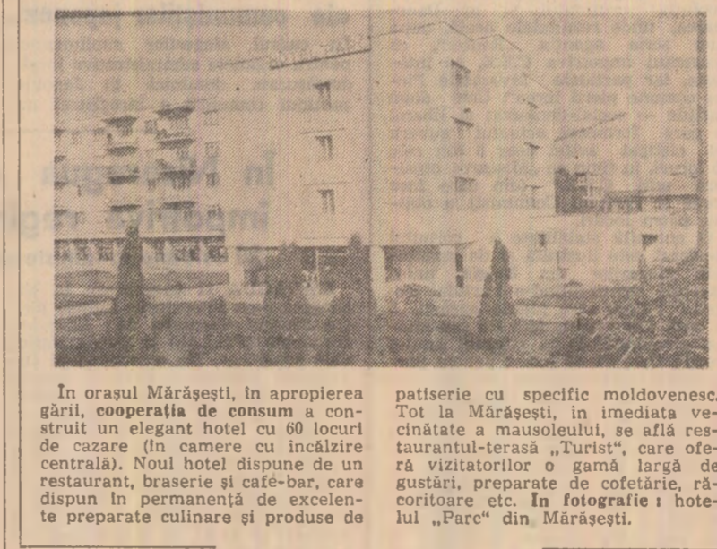
În orașul Mărășești, în apropierea gării, cooperativa de consum a construit un elegant hotel cu 60 locuri de cazare...