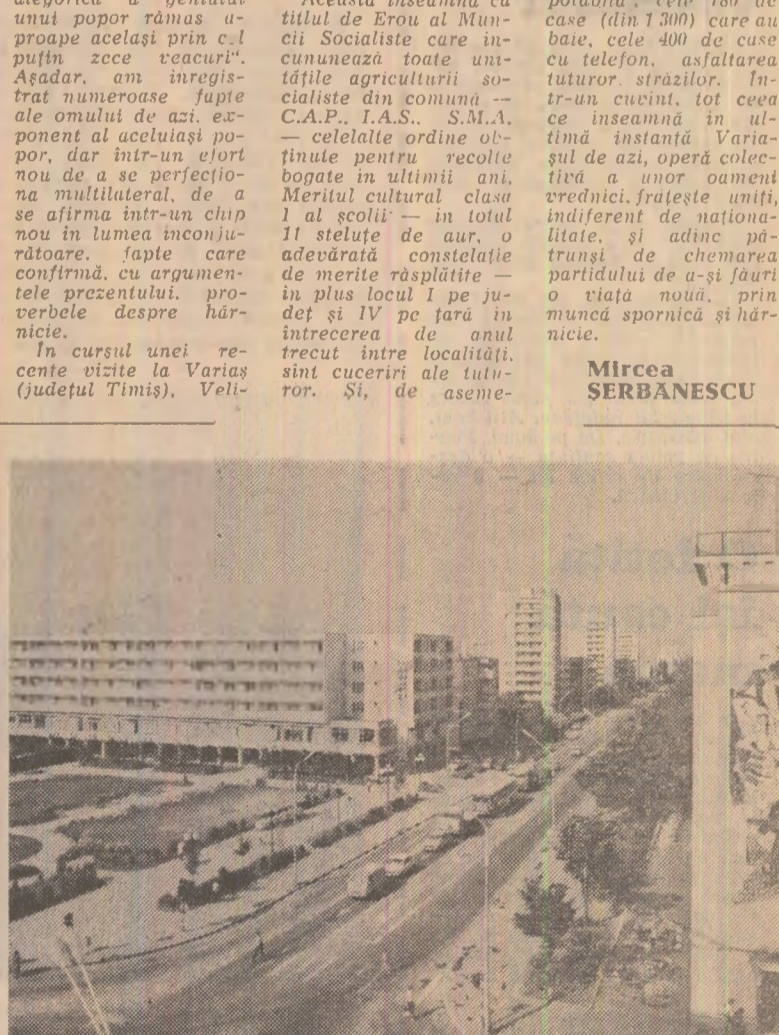
Baia Mare: O imagine panoramică a unei dintre cele mai circulare artere din oraș: Calea Bucureștilui