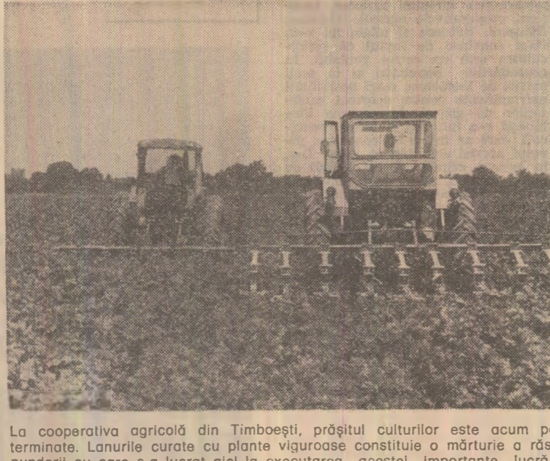
La cooperativa agricolă din Timboești, prășitul culturilor este acum pe terminate. Lanurile curate cu plante viroase constituie o mărțorie a rășpindelii cu care s-a lucrat aici la executarea acestei importante lucrări