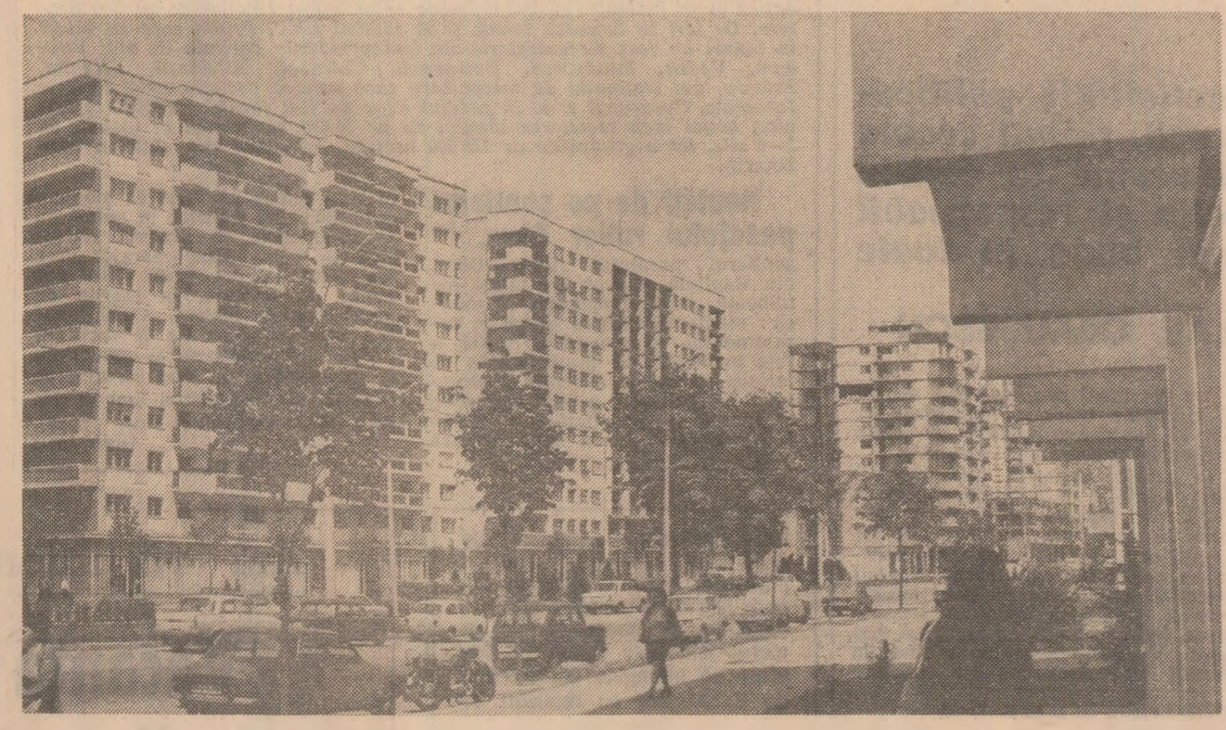
Construcții noi pe bulevardul Nicolae Titulescu din Capitală.

— În total, cadrele cu munci de răspundere din acest sector au fost însumate să în parcurgă claritatea cursurile de reciclare pe plan central sau județean. O mare importanță, de asemenea, lectoratele tehnico-științifice organizate pe