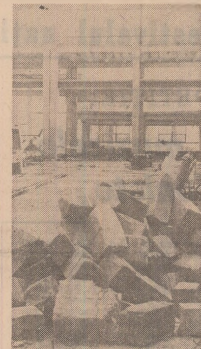
Așa arăta hala principală de producție în ziua core trebuia să marcheze debutul ei industrial. Iar faptul că, nici măcar atunci, nici un constructor nu se găsea în ea face oricât comentariu de prisos

Pînă atunci, centrala de resort trebuie să asigure livrarea nelintirziată a restanțelor de panouri de la întreprinderile amintite, precum și să acopere din alte surse producția nerealizată de întreprinderile de prefabricate din Giurgiu.