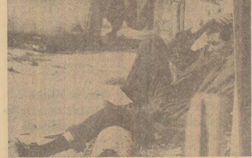
În fața cocoabelor unde și-a găsit adăpost — contra unei chirii ce li înghite ultimele economii — un muncitor imigrant în zădarnica așteptare a unei slujbe

În pofida impedimentelor de tot felul, imigranții își intensifică eforturile pentru desfășurarea unei activități pe baza organizate în vederea dobîndirii de drepturi corespunzătoare. În acest sens, un moment notabil l-a reprezentat recentul congres de la Amsterdam, la care au luat parte 200 de reprezentanți ai unor grupuri de muncitori imigranți din țările C.E.E. Participanții au cerut respectarea drepturilor politice și cetățenești ale lucrătorilor străini din cele nouă țări comunitare. Documentul publicat cere ca muncitorii imigranți să li se asigure dreptul la muncă, la salarii egale cu muncitorii localnici, precum și a libertății de intruniri și de asociere în sindicate.