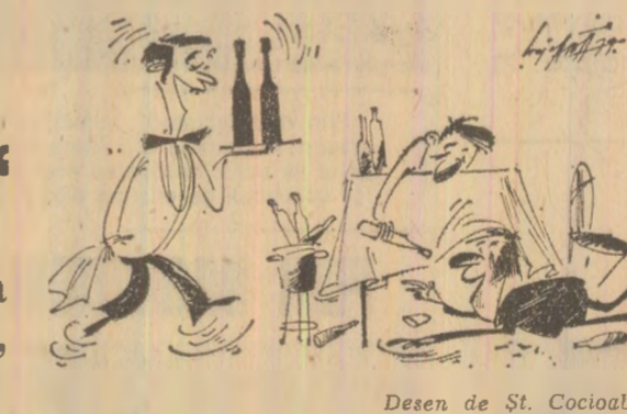
Desen de St. Cociobă

mare de alcool consumată. Tache, Cerel şi Leonte, odată plecaţi de la mla pre „ospitalieră”, „Amfora”, la mla pe Viorel H., îl lovea sălbatic, să se rotînească de descriere prin vizuina băuturilor alcoolice. Conştient în practica unui comerţ cu adevărat civilizată, unii lucrători din localurile publice îl împing ei, cum i-au împins şi pe cei trei tineri, spre alcoolul care, asa cum am văzut, întîmplea minţile”. Despre această mentalitate necomercială, păgubitoare din toate punctele de vedere pe plan uman şi moral, am mai scris la rubrica noastră „Din instanţă în faţa opiniei publice”. „Dosarele alcoolului” etc. Nu o dată am stăruit a-