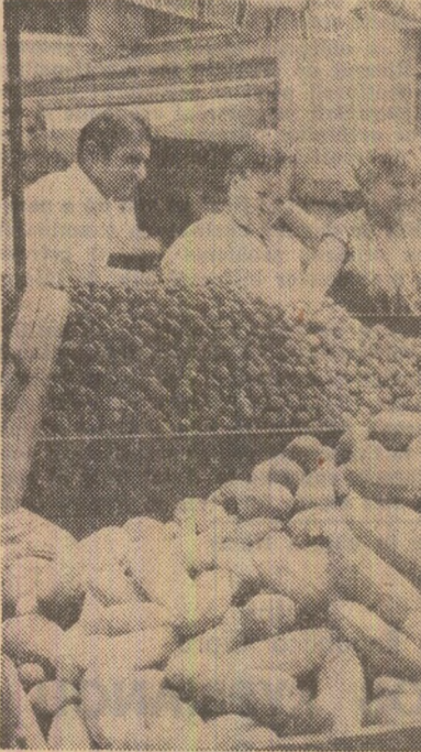
O imagine cotidiană în piața „Ilie Pritile” din Capitală

prafata grădiniilor din întreaga țară a crescut cu 30.000 de hectare. E posibil ca unora această cifră să nu le spună prea mult. De aceea voi da câteva detalii suplimentare. Astfel, toate lucrările sînt terminate și așteptăm numai aceste utilaje. Cu toate că furnizorul ne-a promis că va livra ceea ce mai mare parte din aceste utilaje la 15 iunie — și acest termen a expirat. Deci, după obligații contractuale