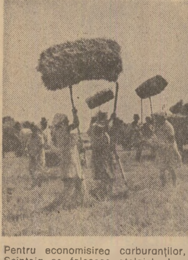
Pentru economisirea carburanților, la cooperativa agricolă din comuna Șcînteia se folosesc otelajele la eliberarea terenului de baloții de paie