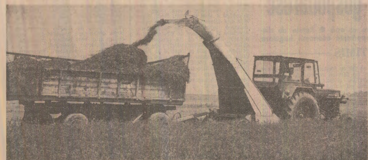
Recoltarea furajelor pentru insulozare la I.A.S. Bacău