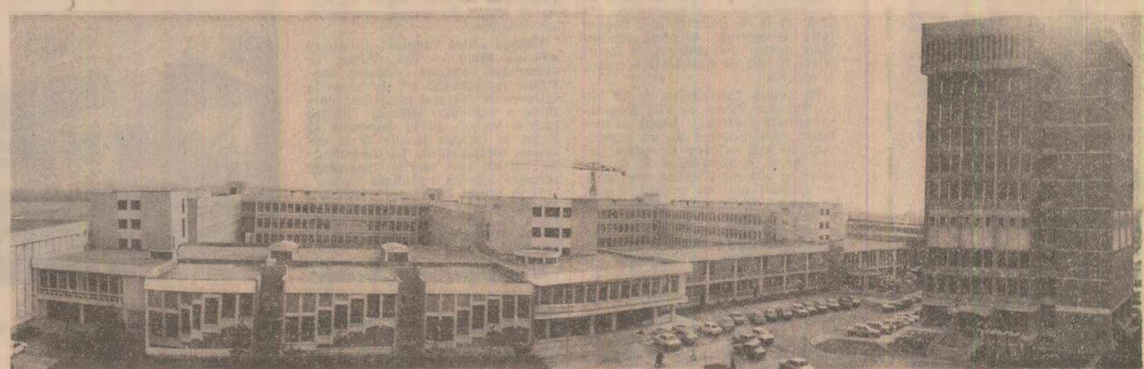
Vedere de ansamblu a Institutului central de fizică

Reporteri ai „Scînteii“, însoțind echipe de control al oamenilor muncii, încearcă să răspundă la întrebarea: