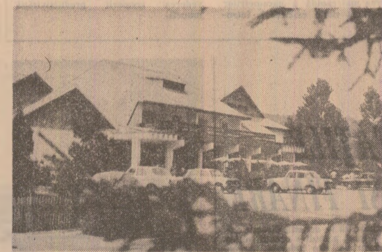
În fotografie: hanul „Topologu”.

La Horezu, la 44 km de Rm. Vlcea, pe șoseaua spre Tg. Jiu, cooperata de consum deține un han cu 56 locuri de cazare, precum și un restaurant.