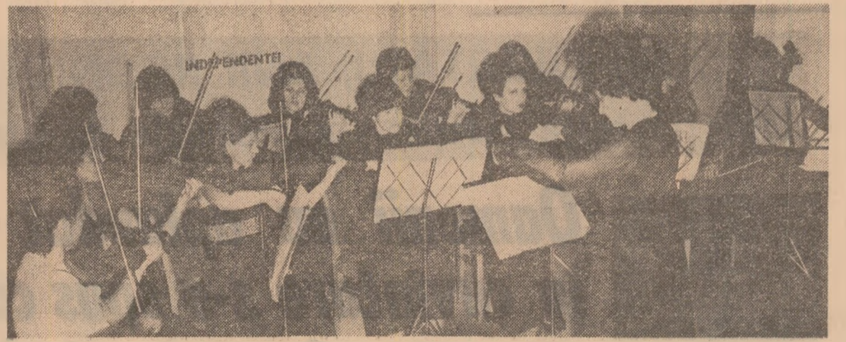
Orchestra de cameră „Simfonia“