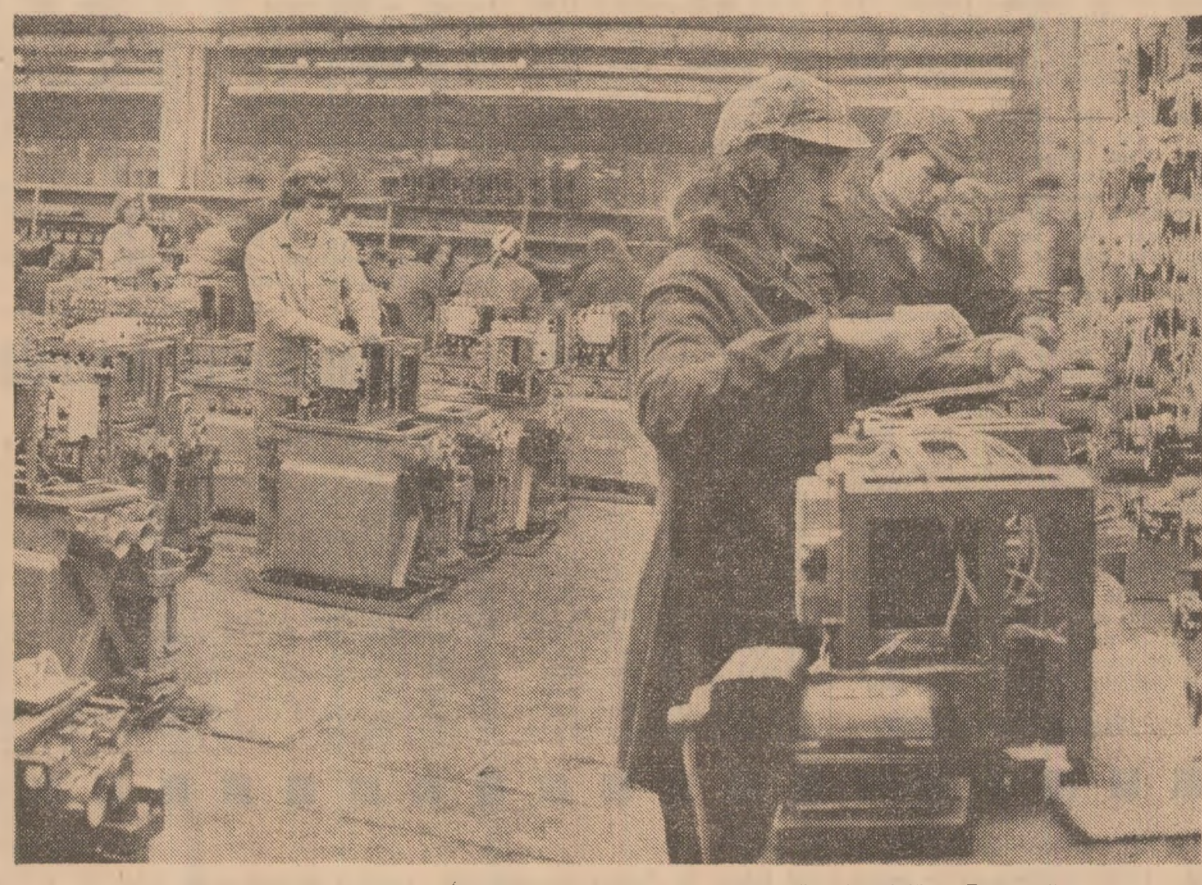
Electrocontact, una din noile întreprinderi de pe noua platformă industrială a Botoșaniilor

— I.A.T.C.-ul, Întreprinderea de utilități și piese de schimb, „Electrocontact”. Întreprinderea de izolatoare, Întreprinderea mecanică... Adresa industrială de date re-