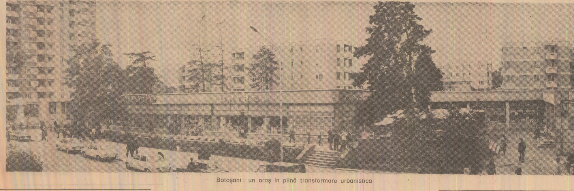
Botoșani: un oraș în plină transformare urbanistică

Recolta de grîu au fărîm-o agricultorii care au arat, semănat și care acum seceră. Dar au contribuit la plămîndirea ei și oamenii muncii din industrie, pe care aduc la noi unelte, îngrășăminte chimice și stăntare pentru combaterea dăunătorilor. Pîinea e a poporului. Și întregul popor este interesat ca recolta de grîu să fie strînsă la timp și fără pierderi. Este obiectul săpămîntului care urmează. Să-l îndeplinim exemplar!