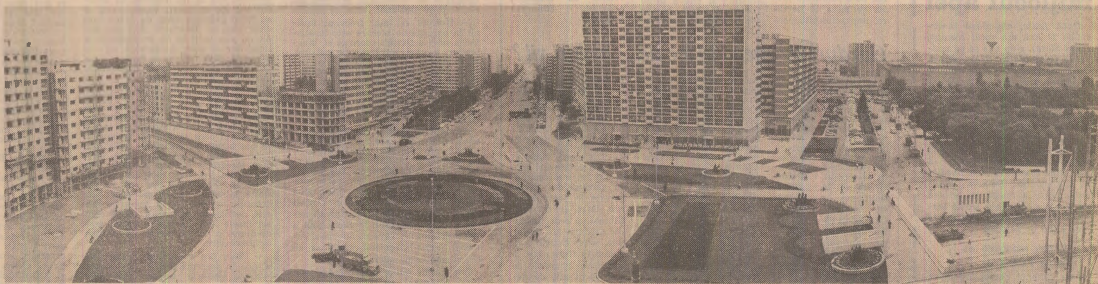
Pașajul Bucur-Obor — cea mai nouă efigie urbanistică a Bucureștiului de astăzi, care întîmpină cu un frumos suris tineresc a 35-a aniversare a Eilberdrii