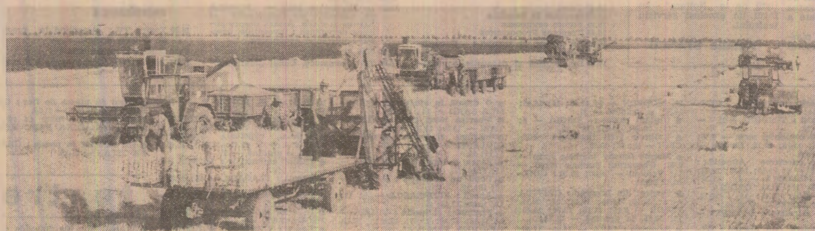
Se acționează intens la recoltarea grîului și stringerea paelor în lanurile C.A.P. Gottlob, județul Timiș

bazelor de recepție să se desfășoare neîntrerupt, ziua și noaptea. Prelucrare grîului se va face la umiditatea cu care este adus din lan, uscarea lui urmînd să se realizeze cu ajutorul instalațiilor de condiționare de care dispun silozurile, inclusiv uscătoarele. Cantitățile de grîu cu umiditate mai mare vor fi depozitate în straturi subțiri, pentru a putea fi aerate, astfel încît să se realizeze uscarea naturală. În acest scop, instalațiile de condiționare trebuie să funcționeze neîntrerupt. În această perioadă de vîrf a muncii agricole, cea mai importantă sarcină a organelor și organizațiilor de partid, a direcțiilor agricole și consiliilor unice agroindustriale este de a asigura folosirea la întreaga capacitate a combiner și mijloacelor de transport, astfel încît odată cu grăbirea recoltatului să se asigure depozitarea în cele mai bune condiții a produselor. (Const. Simion, Crăciun Lăucei, Gh. Băltă).