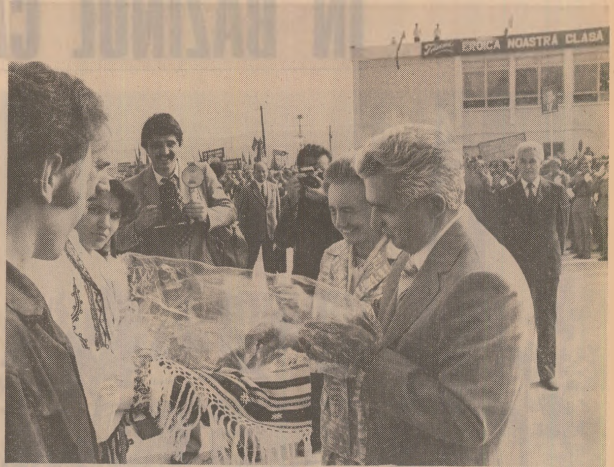
La Turceni, înalții oaspeți sînt invitați să guste din tradiționala piine a ospitalității

(Urale îndelungi, aplauze și ovăși îndelungate; se scandează minute în șir „Ceaulescu — P.C.R.”, „Ceaulescu și poporul!”). Toți cei prezenți la marea adunare populară aclamă îndelung pentru partid, pentru Comitetul Central, pentru secretarul general al partidului și președintele republicii, tovarășul Nicolae Ceaulescu.