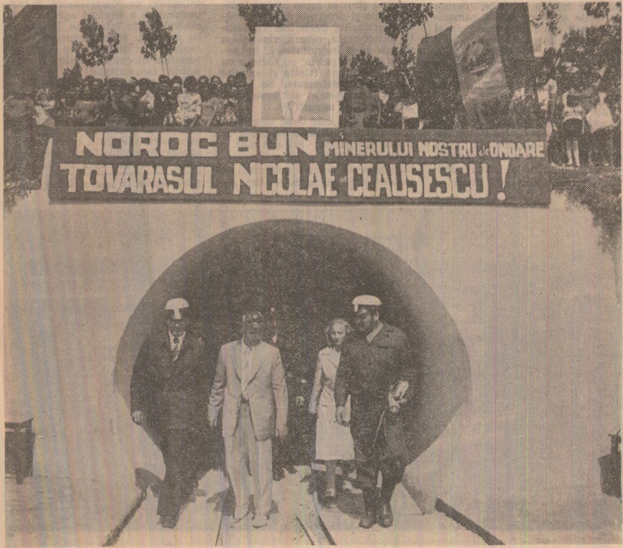
La ieșirea din mina Urdari

Se stabilește zona de deschidere a carierei Tismana II