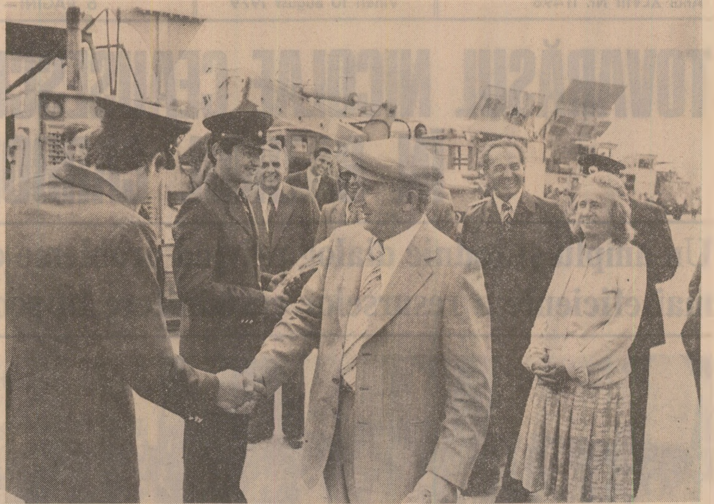
Secretarul general al partidului îi felicită pe minerii de la Gîrla și le urează noi succese