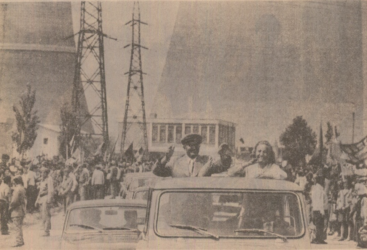
Moment din timpul vizitei la Rovinari