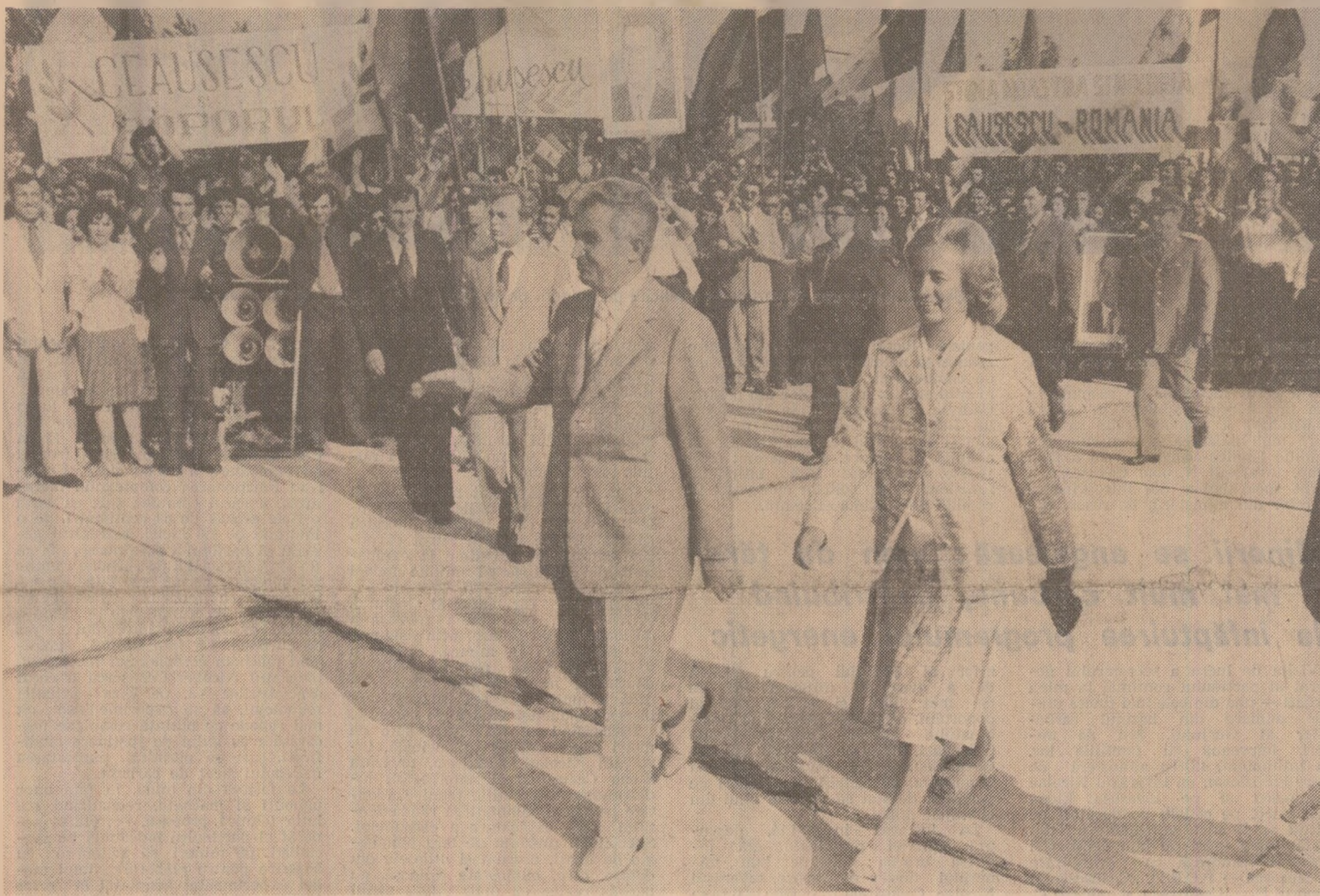
Primire caldă, entuziastă, pe aeroportul din Craiova

Un amplu și rodnic dialog privind probleme esențiale ale creșterii producției și utilizării mai eficiente a resurselor carbonifere în scopul sporirii potențialului energetic al țării