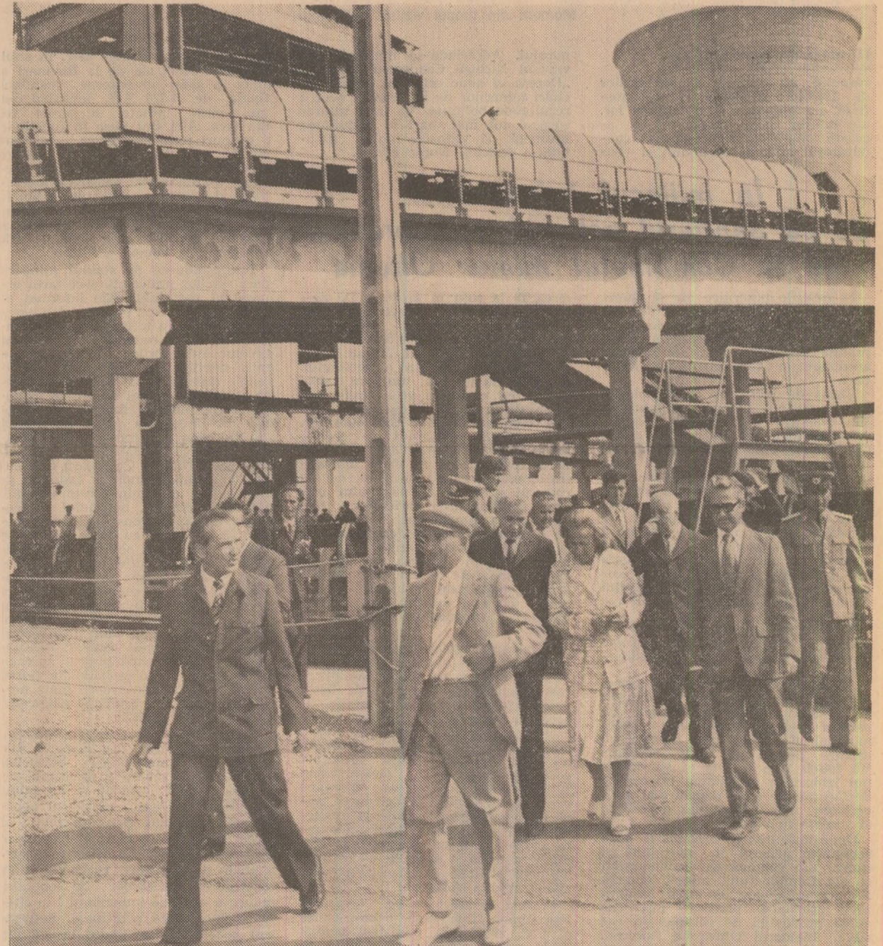
Sînt analizate probleme ale activității și dezvoltării întreprinderii electrocentrale Turceni