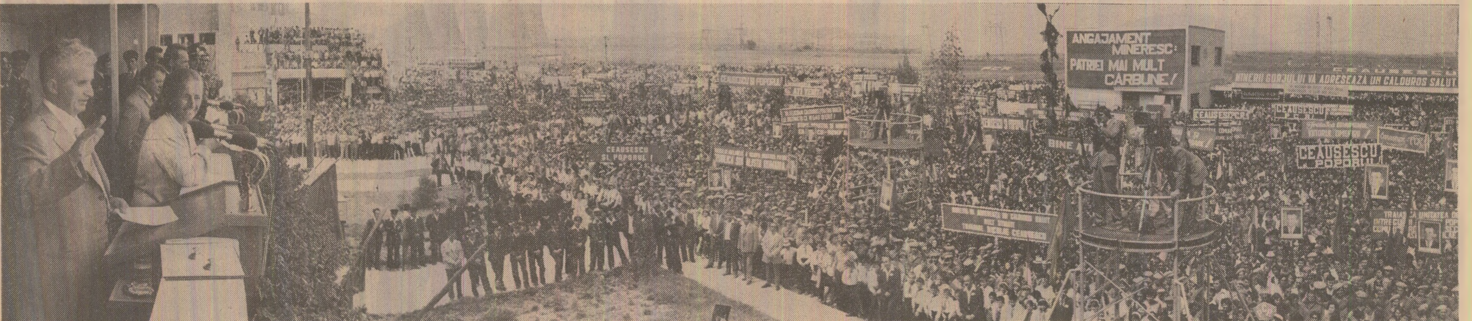
Aspect din timpul mării adunări populare de la Rovinari