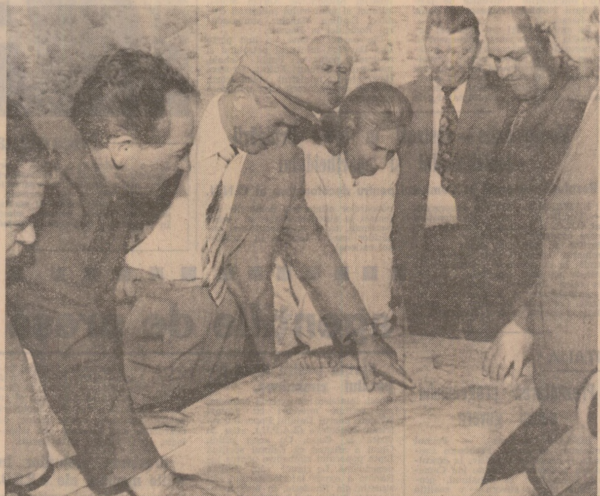
Se analizează amplasarea unor viitoare obiective economice din județul Mehedinți

O formație constituită din militari ai forțelor armate, membri ai găzilor patriotice și ai formațiilor de pregătire a tineretului pentru apărarea patriei a prezentat onorul. A fost intonat Imnul de Stat al Republicii Socialiste România. În uralele și ovatiile celor prezenți la momentul sosirii, soimii al patriei, pionieri, tineri și tineri-le au oferit buchețe de flori. După data străbună, tovarășul Nicolae Ceaușescu