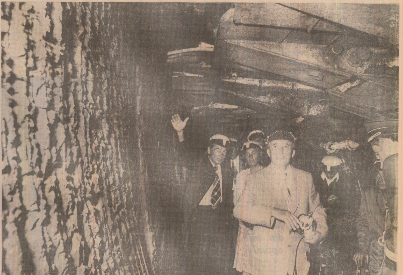
Într-unul din abatajele minei Urdari