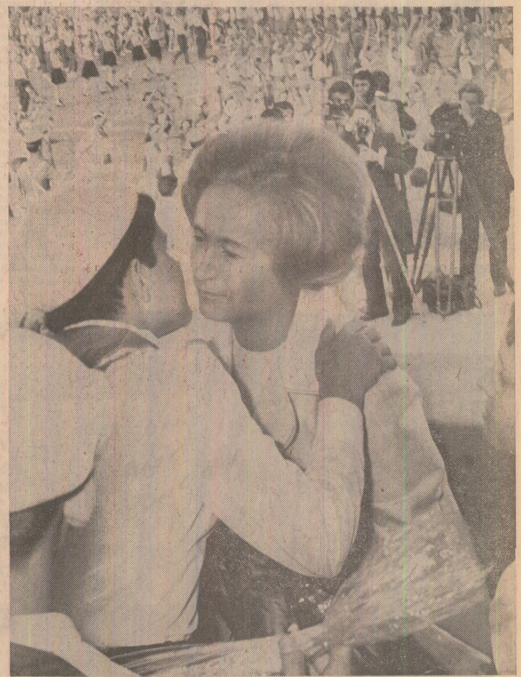
Dragoste și recunoștință pentru copilăria fericită