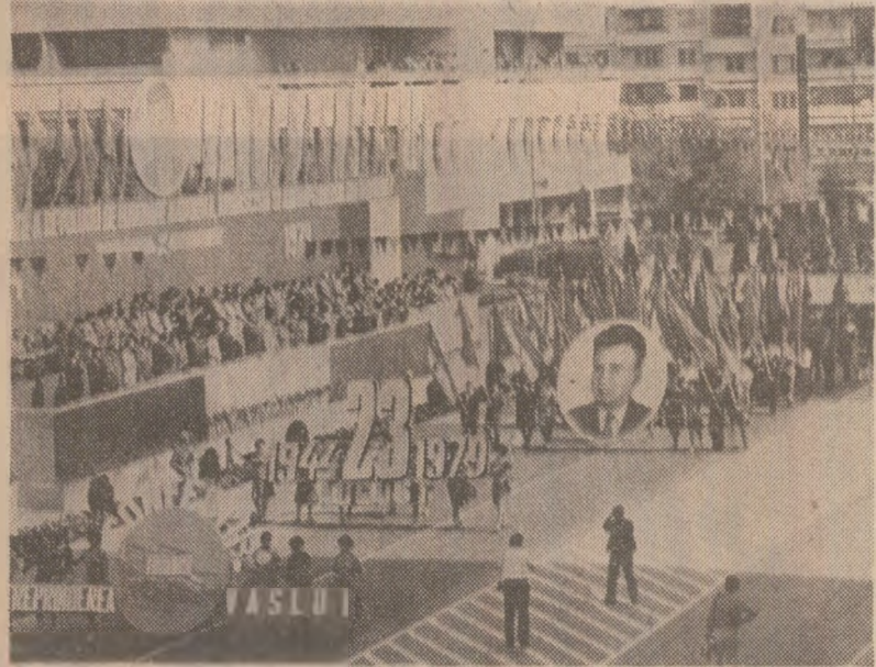
VASLUI: Defilează colectivul unuia dintre noulle întreprinderi de pe harta industrială a județului