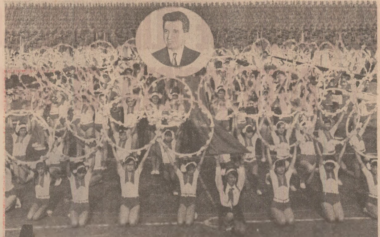
Omagiu sub soarele de August