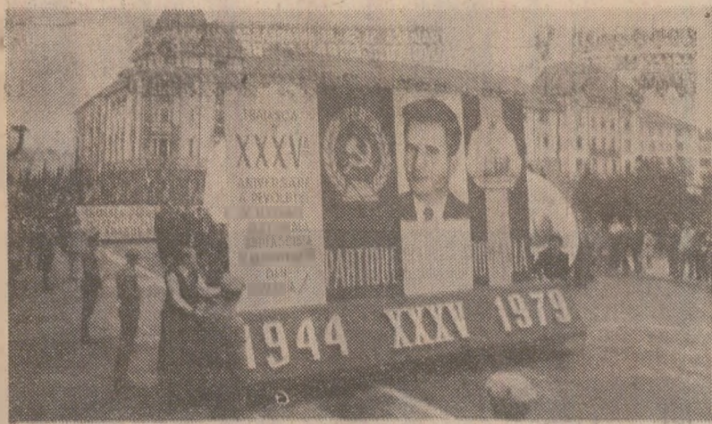
CRAIOVA: Raport muncitoresc