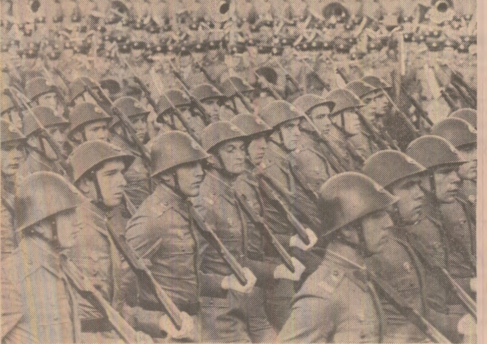
Infanteriștii, purtătorii celor mai vechi tradiții ostășești ale armatei noastre