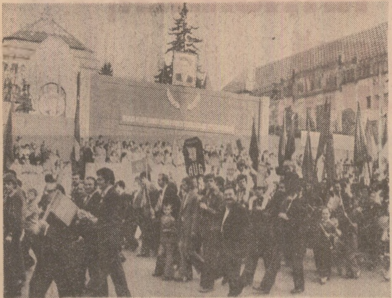
TIRGU MUREȘ: Coloanele muncii și vieții înfrățite