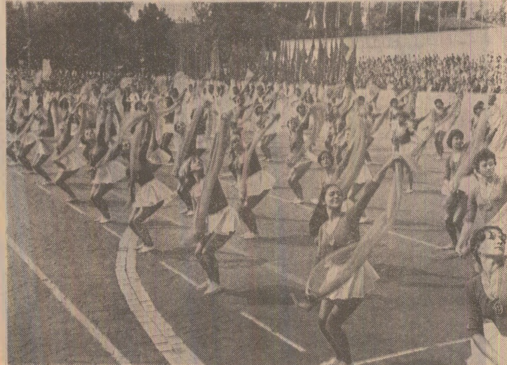
Grație, frumusețe, armonie