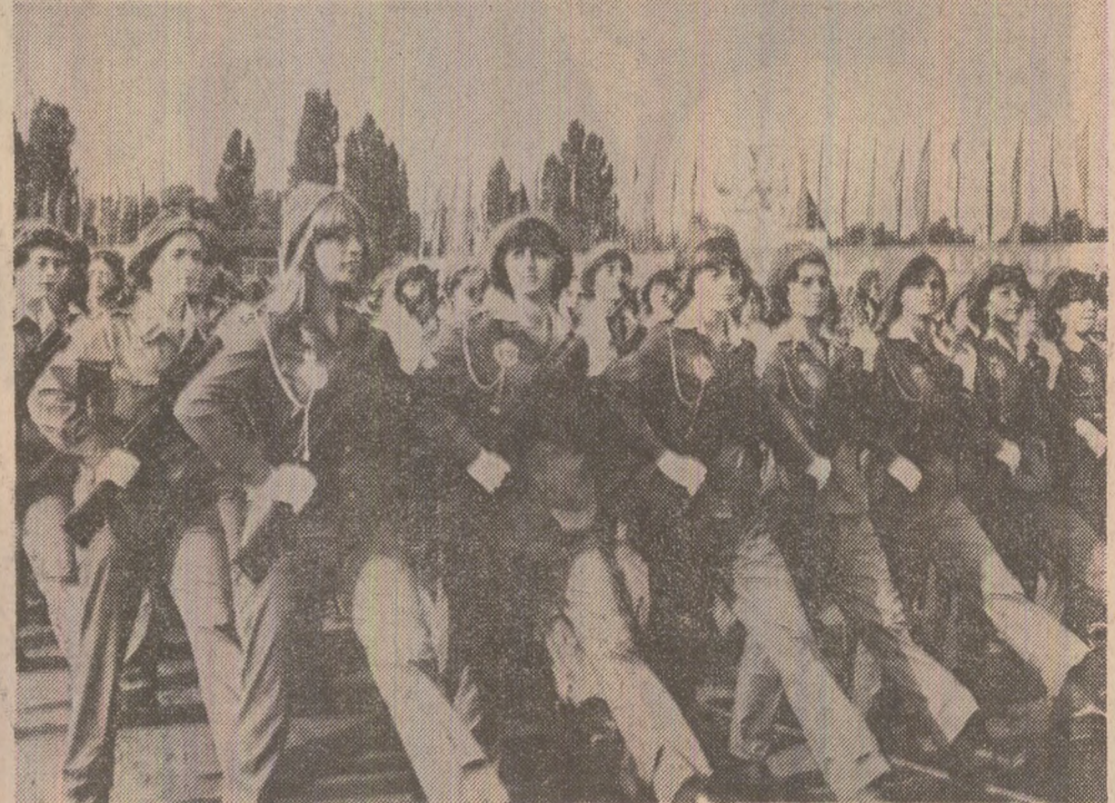
Trec detașamentele de pregătire militară a tineretului