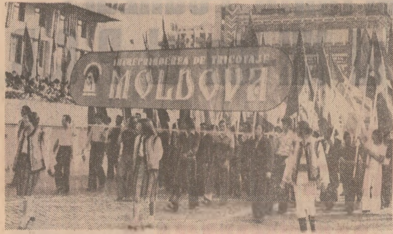
IAȘI: Tineretăa împlinirii contemporane în străvechea cetate de scaun a Moldovei