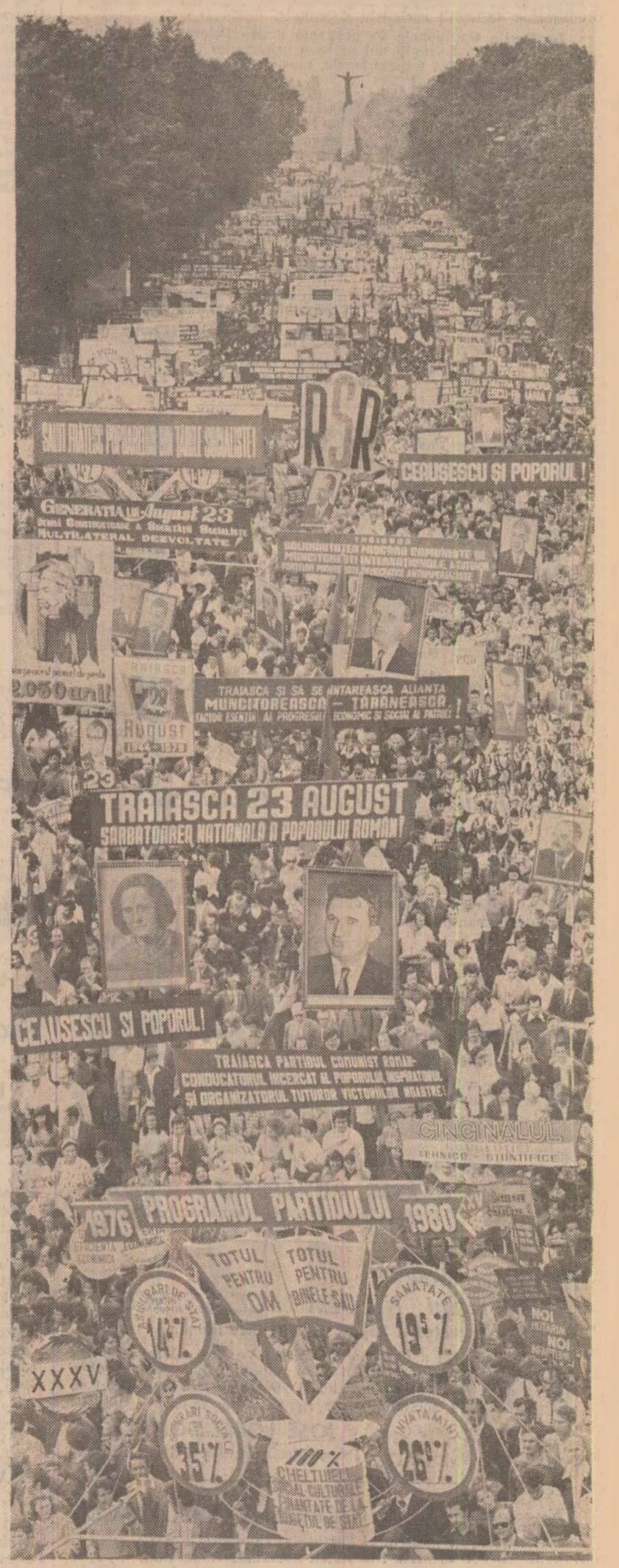
BUCUREȘTI: Coloanele-fluviu ale bucuriei și elanului muncitoresc