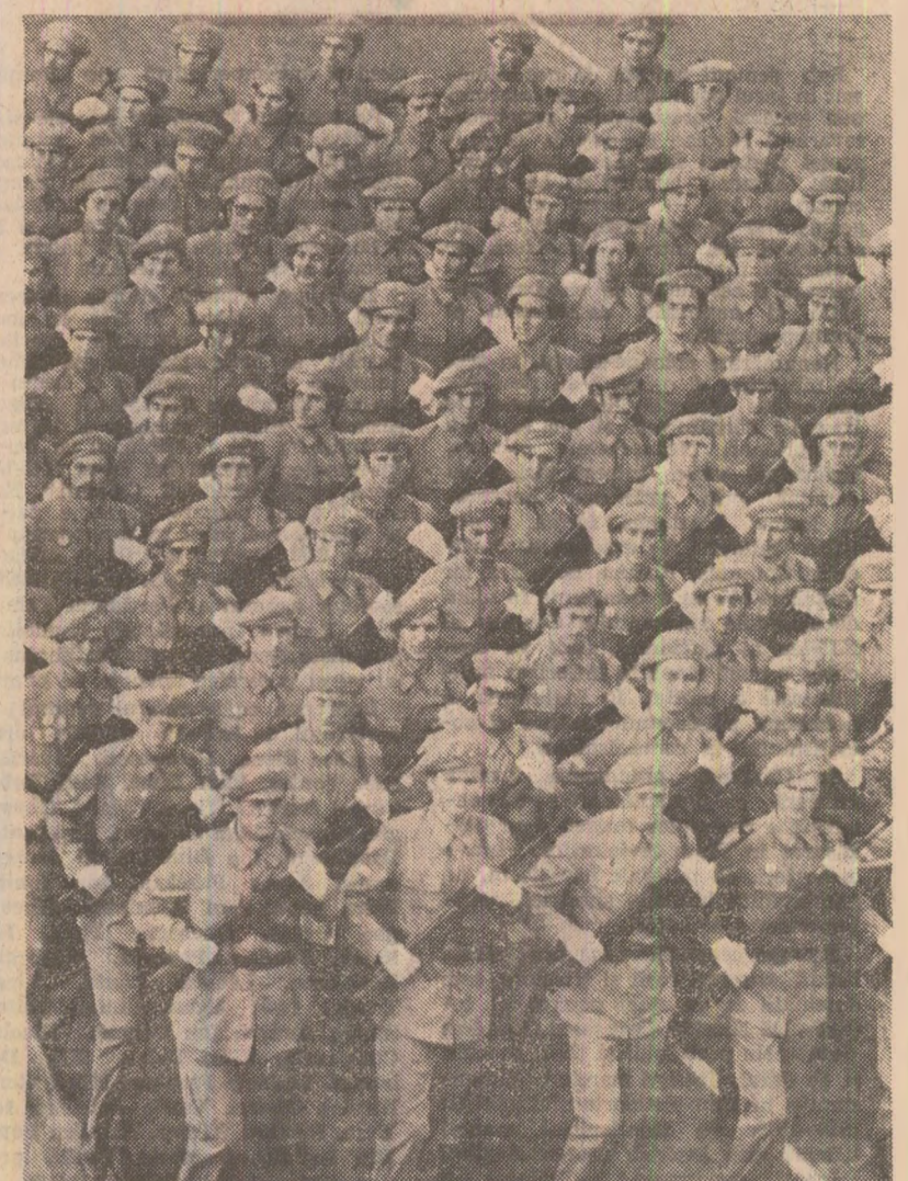
În poezie, bărbăteșe — gărzile patriotice