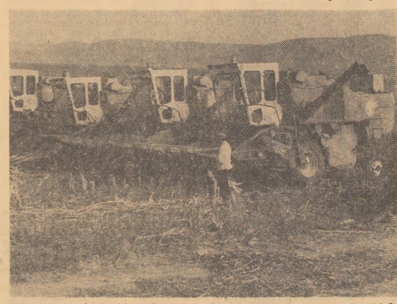
Ora 18: este încă zi-lumină, dar combinele așteaptă noaptea. (Lt. I.A.S. Traianu, județul Tulcea)