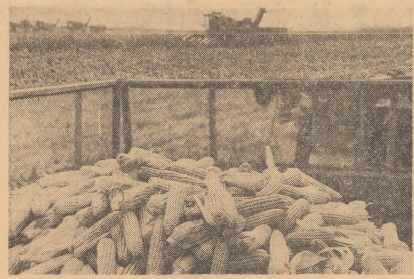
Combinele înaintează în lanurile de porumb ale I.A.S. „Mihail Kogălniceanu”, județul Tulcea, iar remorcile și camioanele preiau imediat recolta