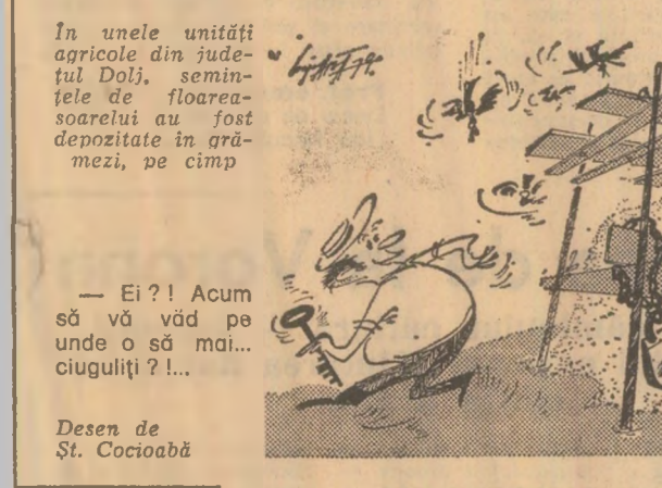
Ei?! Acum să vă văd pe unde o să moie... ciuguliți?...