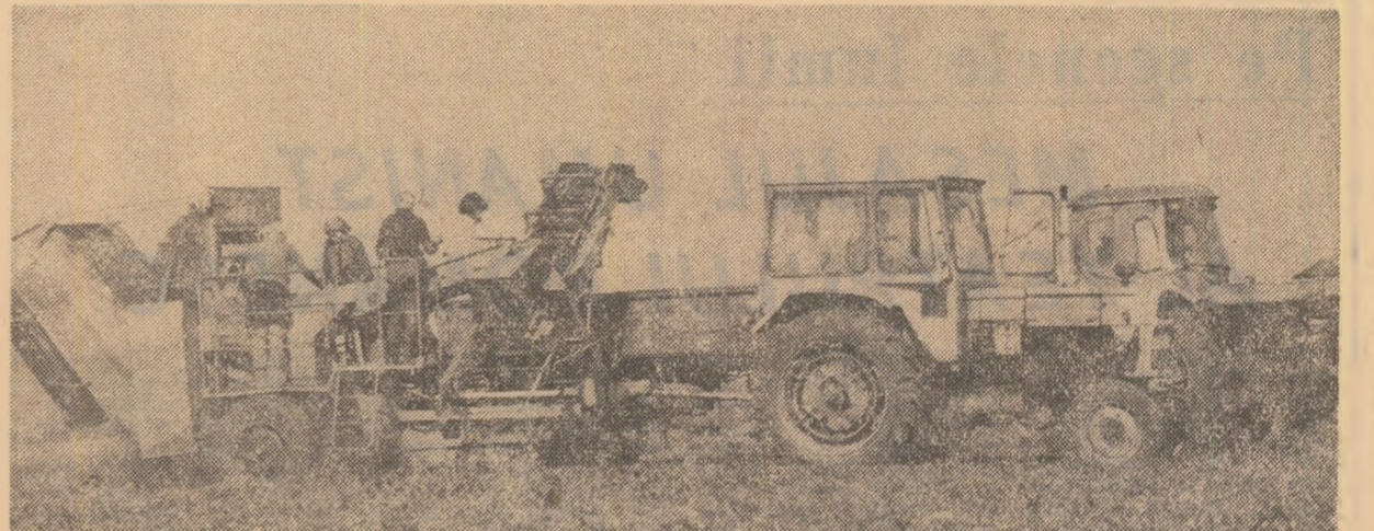
Pe terenurile Institutului de cercetări pentru cultura cartofului Brașov se folosesc utilaje de mare capacitate la recoltarea și sortarea cartofilor

George PARASCAN correspondent „Scintilei”