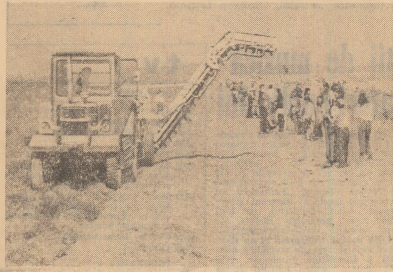
Elevii liceului „Andrei Șaguna” din Brașov ajută pe cooperativii din Ghimbav la recoltarea cartofilor

Un efect negativ asupra bune desfășurări a lucrărilor îl are și faptul că s-a lărgit mult montarea celor 42 stații de sortat cartofi repartizate unităților mari cultivatoare de cartofi din județ. Din cauza neîntelegerilor dintre consiliile de conducere ale cooperativei și cele ale Trusului S.M.A. ca și a neclădirii și nelucidării modalităților de finanțare a acestor instalații, s-a ajuns în situația că multe nu sînt nici la această dată montate. De aceea, sortarea cartofilor se face tot cu soluții improvizate de „ceartă în familie” care aduce numai pagube. Este adevărat că în ultimul timp au fost luate măsuri pentru urgentarea montării instalațiilor, dar acest lucru va cere încă multe zile. Este evident că înseamnă o pierdere și de timp, și de forță de muncă. Organele agricole locale au datoria să acționeze cu toată energia.