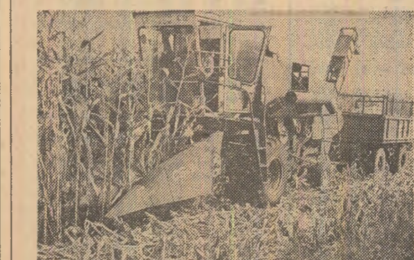
Cînd forțele mecanice sînt folosite intens, viteza zilnică de recoltare se crează și chiar se depășește. Așa s-a lucrat în lanurile de porumb ale cooperativelor agricole Gottlob, județul Timiș.

Organizațiile de partid, comitetele județene trebuie să pună permanent în centrul activității îndeplinirea în cele mai bune condiții a hotărîrilor partidului și legilor țării, a planului de dezvoltare economică și socială, a sarcinilor ce revin județului din planul național unic. Aceasta constituie problema centrală a muncii de partid! Aprecierea muncii organizațiilor de partid nu se poate face după numărul ședințelor și conferințelor ținute sau al dispozițiilor date, ci în primul rînd după felul în care se îndeplinește planul de producție. Aceasta constituie problema fundamentală a activității partidului, baza dezvoltării generale a țării noastre!