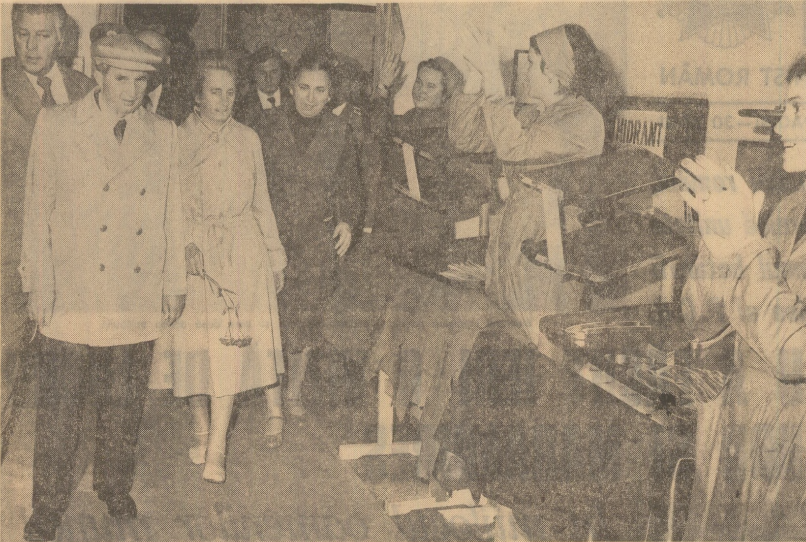
În mijlocul muncitorilor de la întreprinderea de încălțăminte „Solidaritatea” din Oradea