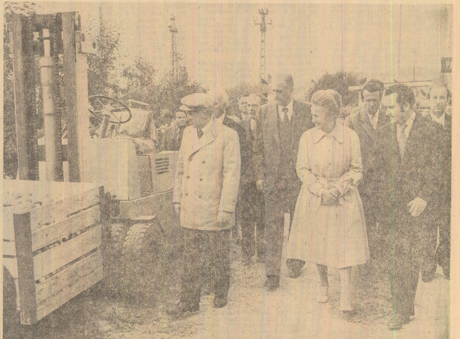
La Stațiunea de cercetări și producție pomicolă Baia Măre