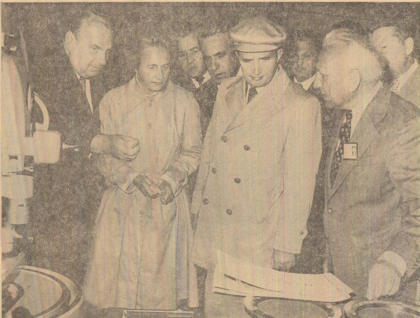
Rodnic dialog de lucru la întreprinderea „Infrățirea” din Oradea

Cu această convingere, vă urez tuturor succese tot mai mari în întreaga activitate, multă sănătate și multă fericire! (Urale și aplauze puternice, îndelungate; se scandează minune în șir: „Ceașescu — P.C.R.”, „Ceașescu și poporul!”). Toți cei prezenți la marea adunare populară ovacionează într-o atmosferă de mare entuziasm pentru Partidul Comunist Român, pentru Comitetul său Central, pentru secretarul general al partidului și președintele Republicii Socialiste România, tovarășul Nicolae Ceașescu).