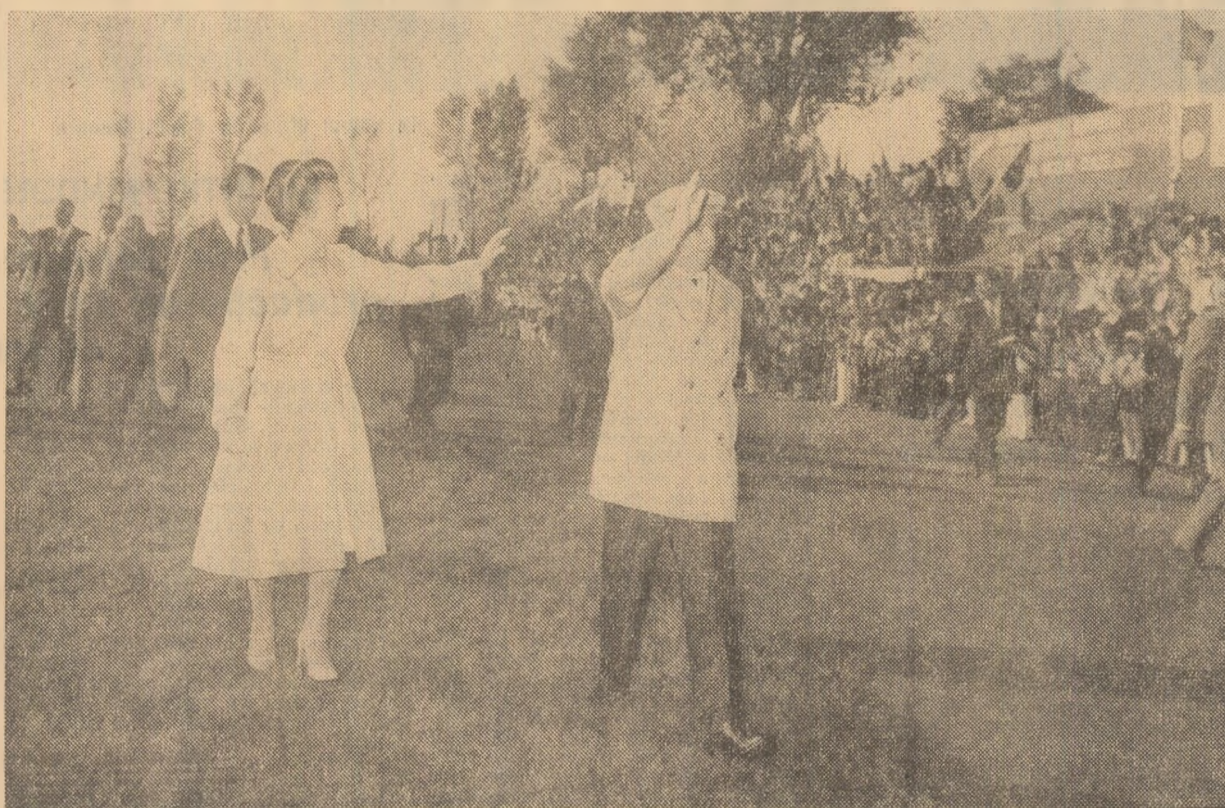
Primire călduroasă, entuziastă la Salonta