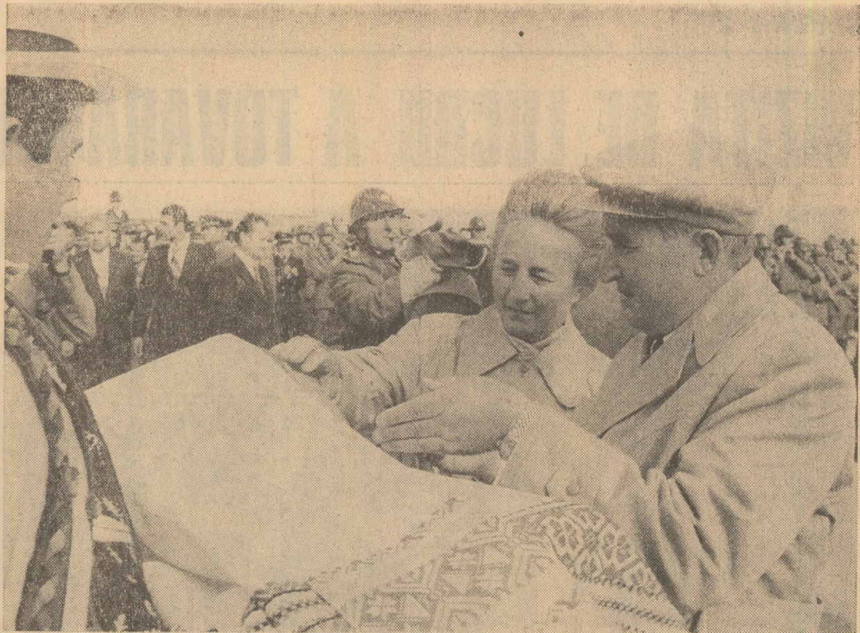
Bihoreni întîmpină pe înalții oaspeți cu pine și sare, după datina străbună

Tovarășul Nicolae Ceaușescu, secretar general al Partidului Comunist Român, președintele Republicii Socialiste România, a continuat luni vizita de lucru în județe din nord-vestul țării. În cursul dimineții, secretarul general al partidului s-a aflat în mijlocul oamenilor muncii din județul Bihor.