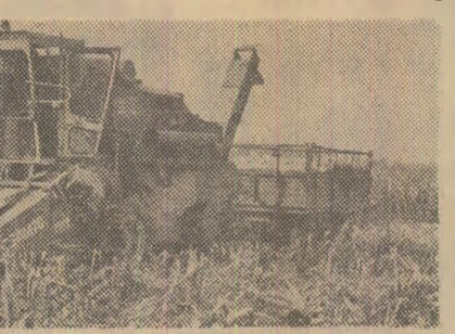
Recoltarea porumbului în unitățile Consiliului agro-industrial Dragalina-Ialomița

Recoltarea porumbului — principala cultură cerealică a țării — se desfășoară cu intensitate în majoritatea județelor. Pînă la această dată, recolta a fost strînsă de pe aproape 300.000 hectare, lucrările fiind mai avansate în unitățile agricole din județele Mehedinți, Brăila, Dolj, Constanța, Tulcea, Dimbovița și altele. Intrucît porumbul s-a cîp pe mari suprafețe, este necesar să fie folosite din plin toate mijloacele mecanice și forța de muncă de la sate, astfel încît să se îndeplinească și depășească vitezele de lucru stabilite în programele privind desfășurarea campaniei agricole de toamnă. Comitele județene de partid, comandamentele locale pentru agricultură și consiliile unice agroindustriale au datoria să asigure ca, odată cu recoltarea, să se desfășoare în flux neîntrerupt transportul și depozitarea știuleților, evitîndu-se orice pierderi.