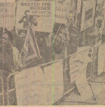
În centrul Londrei, unde se desfășoară, de la 10 septembrie, Conferința în problema Rhodesiană, a fost organizată o demonstrație în sprijinul luptei drepte a poporului zimbabwe pentru libertate și independență

Cererea, adresată de către grupul african președintelui în exercițiu al consiliului, Paul Lusaka (Zambia), ar putea avea ca efect o reunire a Consiliului de Securitate, dacă în cursul consultărilor se decide astfel. O.N.U. nu a recunoscut niciodată calitatea de stat teritoriilor proclamate „independente” de către rezimul de la Pretoria în cadrul politicii sale de apartheid și a adoptat rezoluții în acest sens.