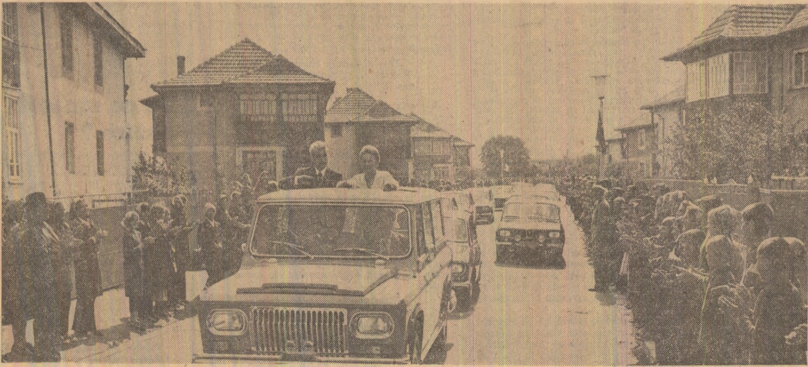
Reîntînire cu chipul nou al Scorniceștilor

În aplauzele puternice ale celor prezenți, a luat cuvîntul tovarășul NICOLAE CEAUȘESCU, secretar general al Partidului Comunist Român, președintele Republicii Socialiste România.