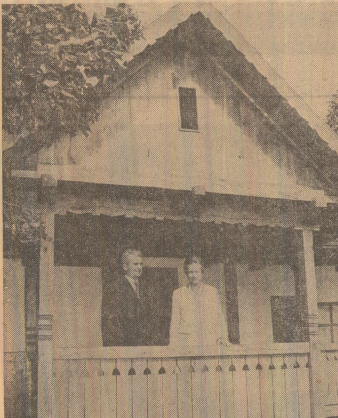
La casa părintească