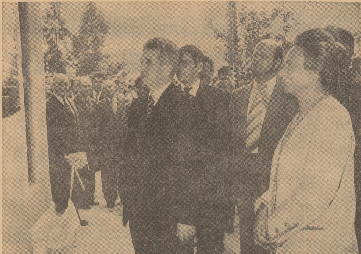
Moment inaugural la întreprinderea de piese și subansamble auto

Vă urez tuturor celor prezenți la această mare adunare populară, tuturor locuitorilor județului Olt succese tot mai mari în întreaga activitate, multă sănătate și multă fericire! (Aplauze și urale puternice, îndelungate. Se scandează minute în șir: „Ceaulescu — P.C.R.!” „Ceaulescu și poporul!” „Ceaulescu — Scornicești, fiu ales al țării ești!”. Cei prezenți la marea adunare populară aclamă puternic, într-o atmosferă de mare entuziasm, pentru Partidul Comunist Român, pentru secretarul general al partidului și președintele țării, tovarășul Nicolae Ceaulescu).