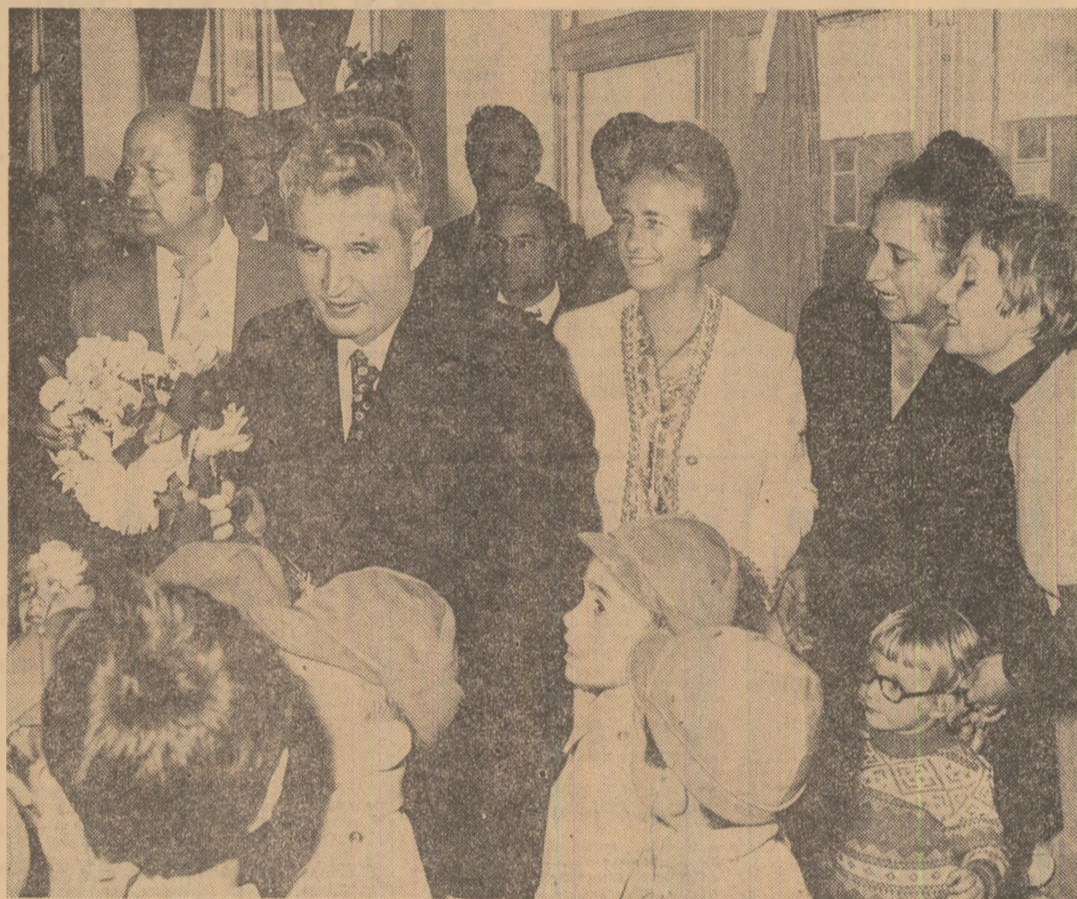
Flori ale dragostei din partea copiilor Scorniceștilor, la întreprinderea de confecții