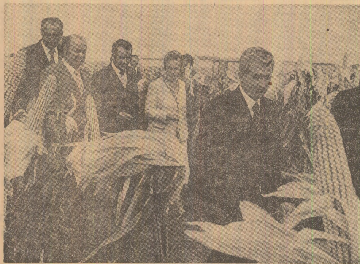
Aprecieri pentru bunele rezultate în cultura porumbului