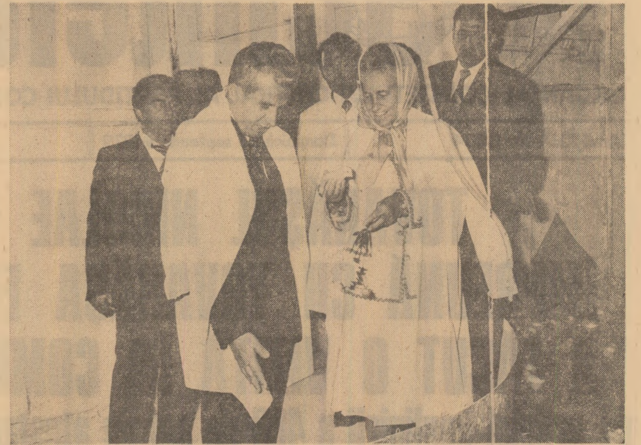
La Complexul avicol este examinată posibilitatea folosirii mai bune a spațiilor existente

Exprimîndu-ne încă o dată cele mai adînci mulțumiri pentru cînteca ce ne-ați făcut-o de a participa la sărbătorirea a 400 de ani de atestare documentară a comunei noastre, pentru