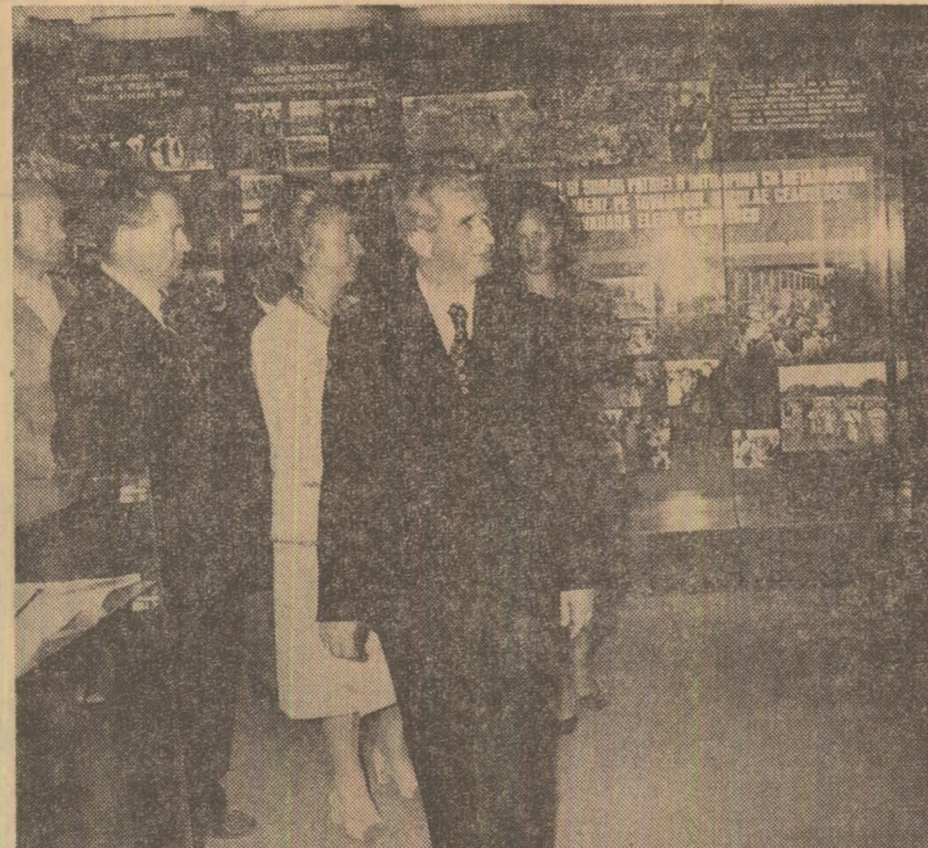
La muzeul de istorie al comunei