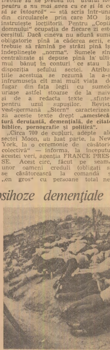
Epilogul tragic de la Jonestown: aproape 1.000 de membri ai „Templului poporului” au fost împinși la „sinucidere” cu cianur de către conducătorul acestei secte.

Fanatism, extoz și frenezie se citește pe chipurile acestor tineri adepți ai „Misunii luminii divine”