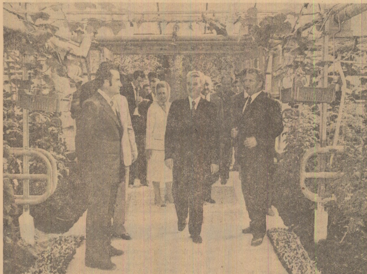
Vizitînd modernele sere ale cooperativei agricole