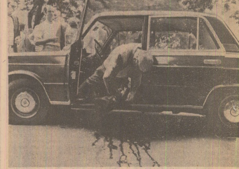
Atentatele teroriste au devenit o realitate cotidiană în Italia. Imagine surprinsă pe una din străzile Romei