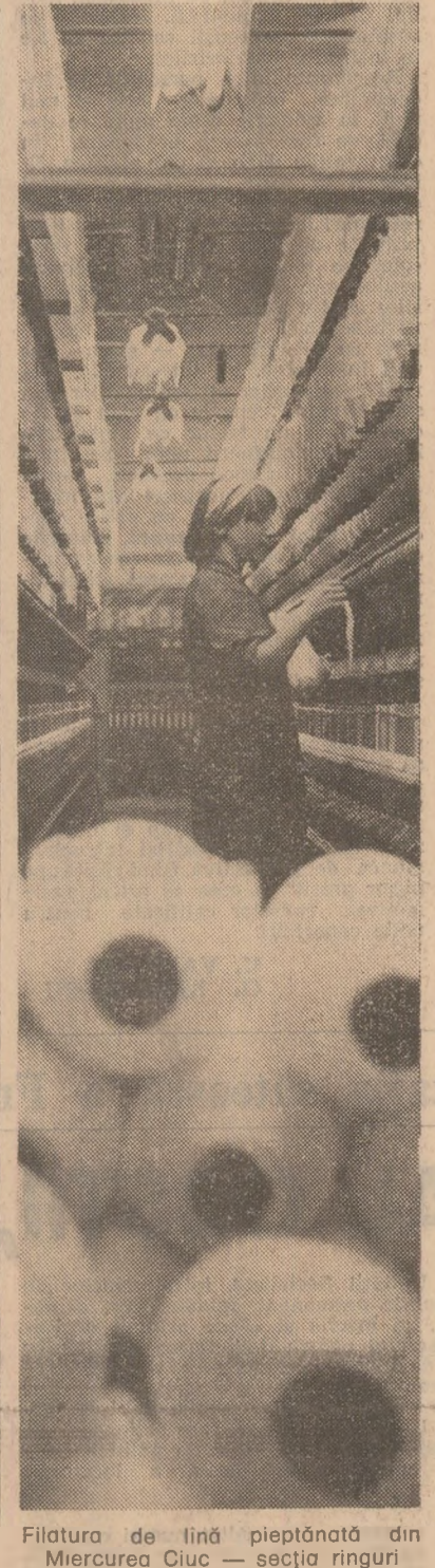
Filatura de lînă pieptonată din Miercurea Ciuc — secția ringuri

S-a nimerit să fiu singur în cușetă. Am patul 17 al vagonului de dormit atașat la acceleratul 243. Acelelăratul asta mă va duce pînă la Hunedoara. Stau în patul 17 și peste mine năpustesc amintirile. Cu 32 de ani în urmă am făcut același drum, adică București — Hunedoara cu trenul „Foamea”. Trenul „Foamea” era ciorchine. Fugeau moldovenii și nu numai moldovenii, de foame. Ne țopisim așa, în jurul mării din drum l-am făcut între tampoane, jumătate pe acoperiș. Credeam că n-o să mai ajung întreg la Hunedoara. Tăcîmii roților, și mai ales amintirile nu mă lasă să dorm. Miine dimineață sînt la Hunedoara. În Hunedoara mea. Mă voi reîntîlni cu vechii mei prieteni. Cu care din ei mă voi întîlni? Tirziu am adormit și am visat căl robii. Cînd a bătut conductorul în usă mă anunțe că urmează Hunedoara, vîșam și zăpadă. Căi robii alergînd prin zăpadă. La Hunedoara era o dimineață frumoasă ca o Giocîndă. Merg agale spre Combinatul siderurgic Hunedoara și mi-aduc aminte că atunci, în acele vremuri, la poarta principală, niste precepte vîndeau turte de mîlai. Trec pe lîngă portar. Îl salut, îmi zîmbește și duce mîna la cozoroc. O fi citit și el „Derbedei” mei. Urc scările la directorul general. E plecat în combinat. Secretara îmi propune să mă urc un etaj. Să mă duc la directorul general adjuncț. Urc. Secretara se uită la mine. Rămăsese increment. Mă mai întrebă o dată la