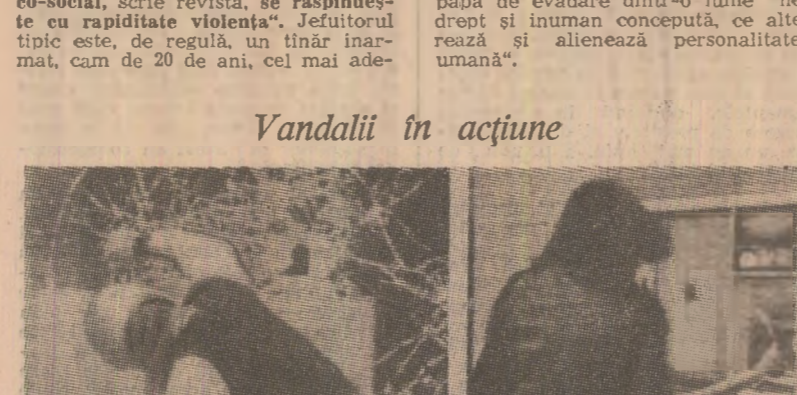
La Paris, bandele de „distrușcători”, dezlănțuite, sparg și sfîrșim tot ce întîlnesc în cale