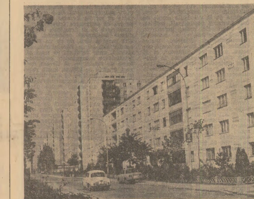
Noii construcții de locuințe în cartierul P.O. ești-Vest

IASI. În noul cartier „Dacia” s-a dat în folosință o centrală telefonică automată care cupleşte 9.000 de posturi din acest cartier și din cartierele „Alexandru cel Bun” și „Mircea cel Bătrîn”. Numărul abonaților telefonicii din municipiul Iași va crește, până la sfârșitul anului, cu peste 50 la sută față de 1968. (Manoile Corcaei).