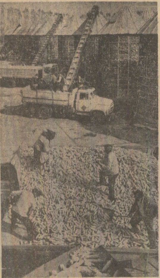
Relatări în pagina a II-a a ziarului