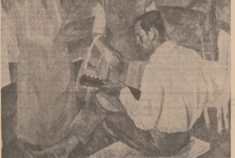
ARMONIE — ulei pe pinză

eu studentia la Bucuresti în 1919, cu minunatul Muzeu de artă al Republicii. Ar fi suficient să enumerăm zecile de muzee sau secții de artă ale muzeelor județene și municipale, sutele de ateliere puse la dispoziția artiștilor, calitatea institutelor de învățământ artistic, a publicațiilor etc. Nu pot să nu compar epoca adolescenței mele, cind în Transilvania nu existau muzee, colecții, cărți, albume sau alte publicații de artă românești, cu zilele noastre, cind tinerii plasticieni și publicii larg au la îndemână atâtea muzee, superbe cărți și albume de artă — dintre care nu puține dedicate de editurile „Meridiane”, „Dacia” și „Kriterion” artiștilor transilvăneni — o revistă de linută ca „Arta”, rubrică de plastică în zeci de ziare și reviste de cultură, la radio și la televiziune. Condițiile de manifestare a artistului îndreptățesc, de aceea, speranța viirii unor noi și valoroase opere umaniste, cum a fost în Transilvania.