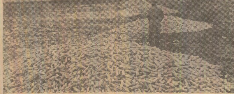
Pe terenurile I.A.S. Adunatii Copăcenii, județul Ilfov, grămezile de porumb stau sub cerul liber, iar camioanele stau pentru că nu sînt oameni la încărcare (fotografia din stînga), iar unii șoferi se plimbă fără rost (fotografia din dreapta)