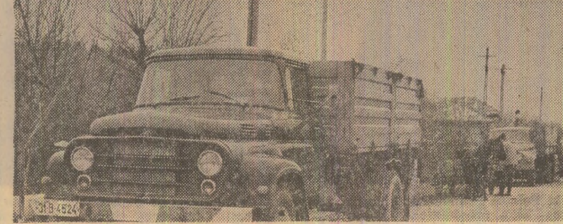
Pe terenurile I.A.S. Adunatii Copăcenii, județul Ilfov, grămezile de porumb stau sub cerul liber, iar camioanele stau pentru că nu sînt oameni la încărcare (fotografia din stînga), iar unii șoferi se plimbă fără rost (fotografia din dreapta)